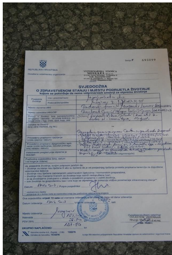
Slika 6. Veterinarska potvrda

Peradarnik tako ostaje zatvoren 8-24 sata, a nakon toga se provjetrava.