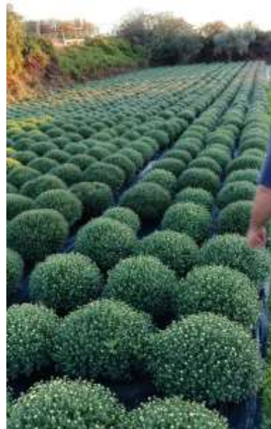
Prilog 2. Multiflora na otvorenom, Split