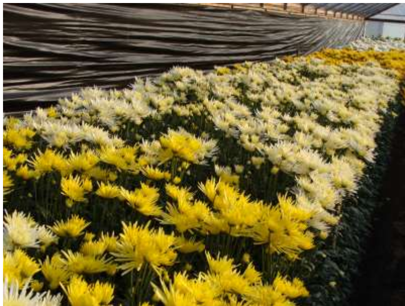
Slika 7. Špine pincirane i uzgojene na više vrhova