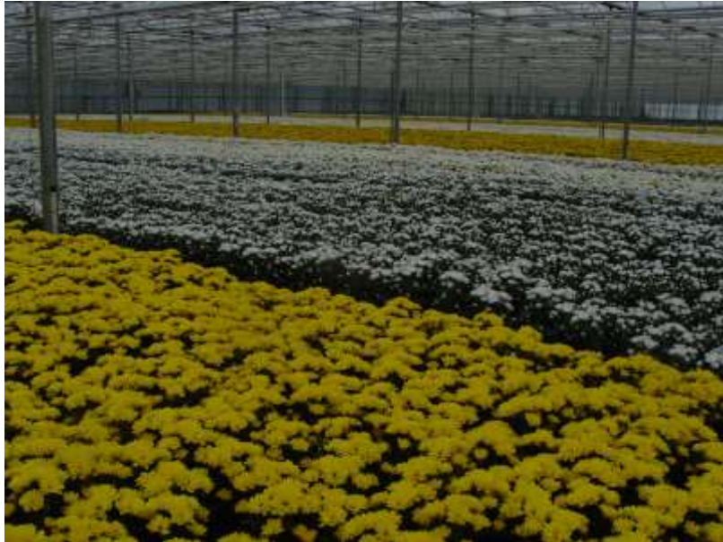
Slika 5. Margarete