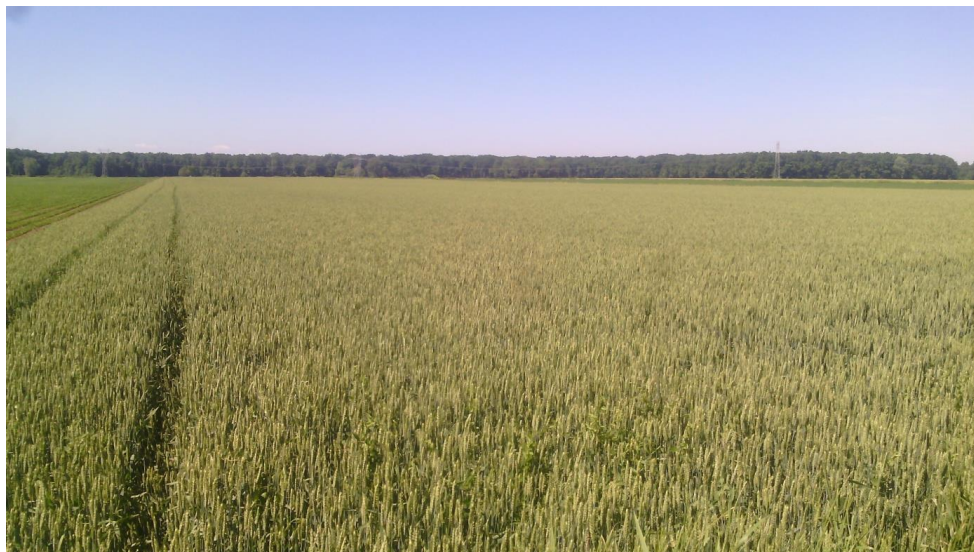
Slika 5. Pšenica sorte Kraljica