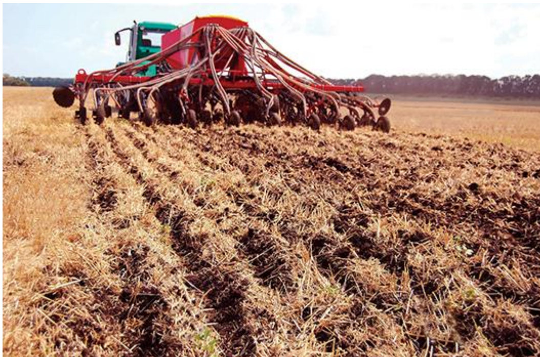
Slika 2. Sijačica za direktnu sjetvu u radu