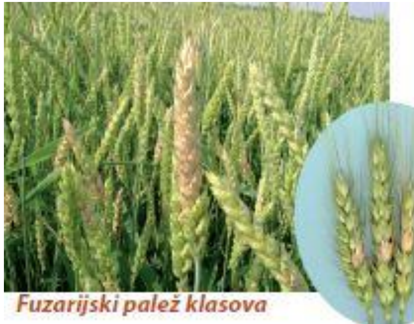
Slika 1. Fuzarijska palež klasa

Žetva, kategorije vlažnosti i sušenje zrna pšenice