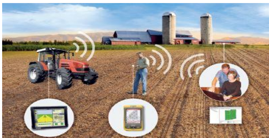
Slika 3. Precizna poljoprivreda