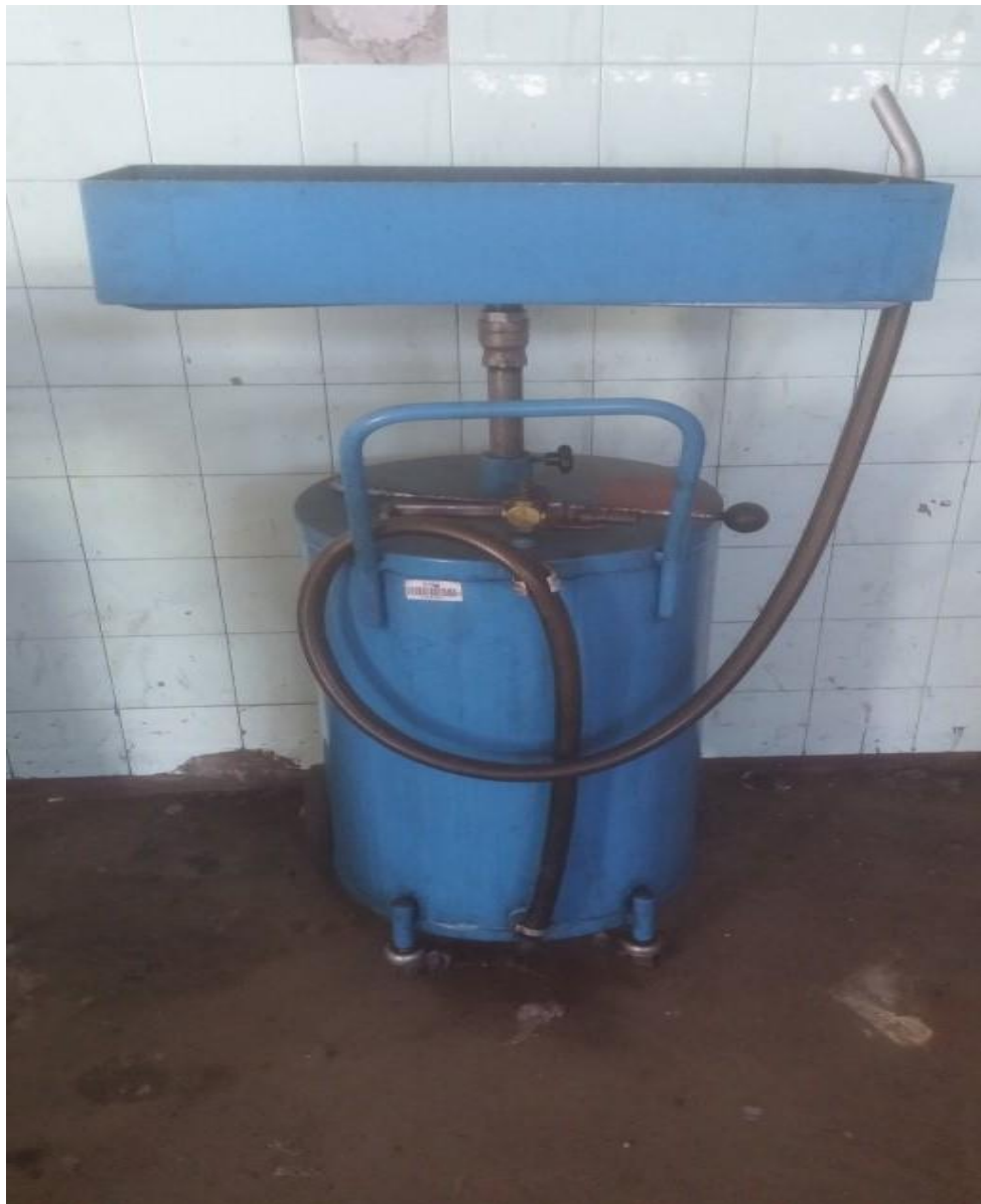
Slika 11. Posuda za prihvatanje rabljenog ulja.

Tvrtka „Agro-Tovarnik“ sakuplja otpadna ulja u plastičnu ambalažu, te ju skuplja u sabirne spremnike (slika 11.). Rafinerija preuzima njihovo otpadno ulje iz spremnika. Poseban ekološki problem čini plastična ambalaža koja se ne zbrinjava na Zakonom propisan način već se odbacuje u objektima i okolišu tvrtke, što nikako nije prihvatljivo. Onečišćena voda iz radionice odvodi se u kanalizaciju. Otpad poput starih akumulatora se skladišti, također kao i stare gume u skladište starih guma. Stare zauljene krpe odvoze se na otpadno smetlište.