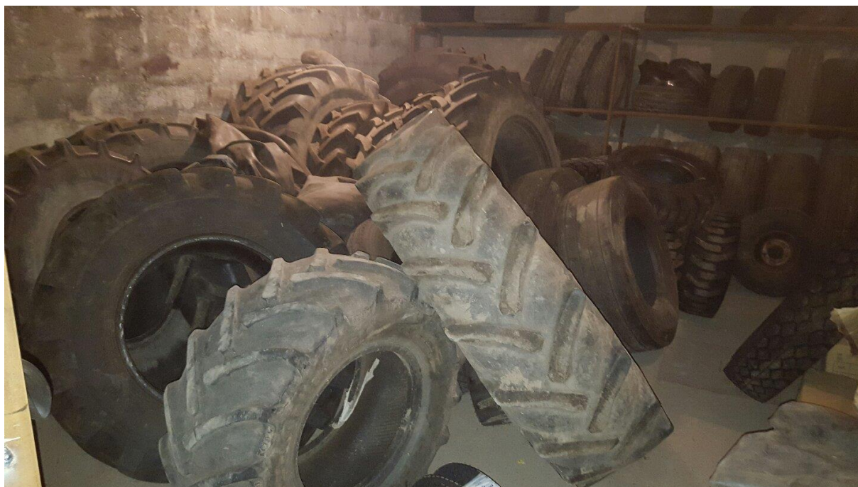
Slika 5. Skladište starih guma