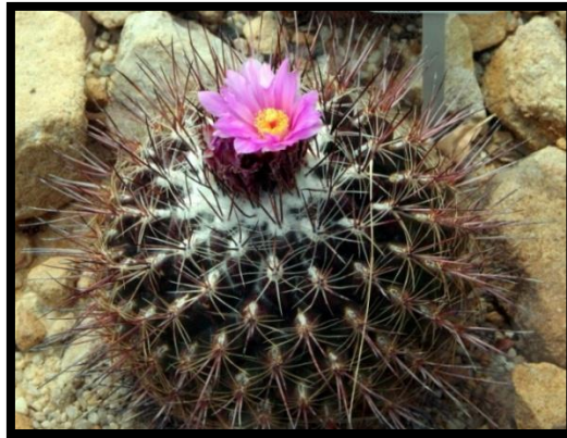
Slika 14: Thelocactus conothenos

Ljubitelji kaktusa telokaktuse uvrstavaju među najljepše i najvrijednije primjerke svoje zbirke. Potječu iz Teksasa i Meksika. Ime je dobila od grčke riječi thele – bradavica . Ima neobične bradavice koje su svojstvene toj vrsti. Cvjetovi mogu biti bijele, žute ili ružičaste boje, u raznim nijansama. Najraširenija vrsta je Thelocactus bicolor . Telokaktus (Slika 14) treba zalijevati umjerno i držati ga na osunčanom i toplom mjestu.