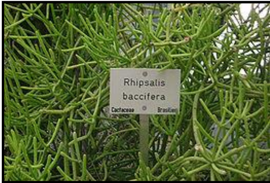
Slika 4: Kaktus Rhipsalis baccifera