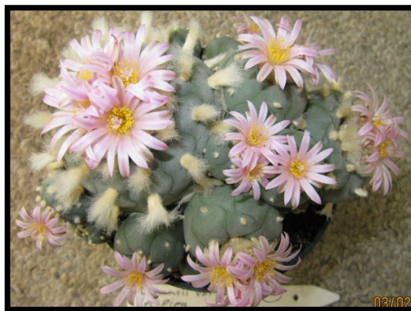
Slika 17: Lophophora Williamsii var. Decipens

Lofofora (Slika 17) ima meko tijelo bez bodlji. Stablo je modrosive boje, kuglastog oblika. Na njemu se nalaze razmaknute areole s malim čupercima dlačica. Lofofora sadrži psihogene alkaloidne snažnog narkotičkog djelovanja. Na taj način je zaštićena od proždiranja raznih životinja. Potrebno ju je zalijevati umjereno.