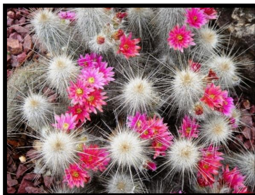
Slika 13: Ježasti stupasti kaktus, lat. Echinocereus

Rod Echinocereus (Slika 13) obuhvaća oko 60 vrsta. Prepoznatljivi su po prekrasnim velikim cvjetovima, promjera oko 12 cm. Boja cvjetova može biti crvena, ružičasta, narančasta ili žuta. Cvjetovi se često održe čak i duže od tjedan dana. Ježasti stupasti kaktus se jednostavno može prepoznati po zelenoj boji unutar njuške tučka. Stabljika je obrasla gustim bodljama. Često raste kao puzavica. Treba ga zalijevati redovno i držati na sunčanoj strani.