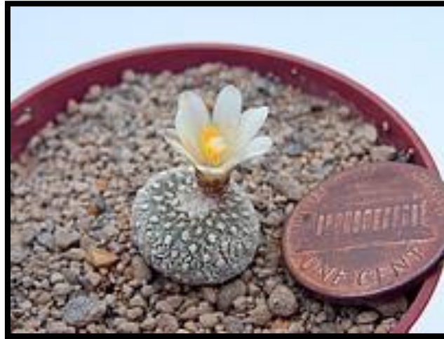
Slika 7: Kaktus Blossfeldia liliputana

Kaktusi su sukulentne trajnice i obilježava ih vrlo raznolik habitus tako da mogu biti u obliku drveća, grmlja, penjačica, zeljastog bilja ili epifita. Veličinom su također raznoliki. Neke su patuljastih formi velike svega 1 cm, npr. Blossfeldia liliputana Werdem. (Slika 7).