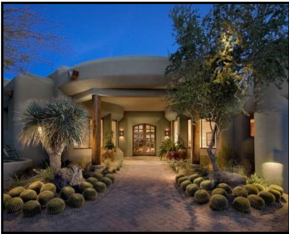
Slika 24: Dekoracija eksterijera kaktusima

Za razliku od ostalog bilja kaktusi vrlo dobro podnose osunčana i suha staništa, stoga se posebno preporučuju za dekoracije staklenih stijena, zimskih vrtova i kamenjara (Slika 24).