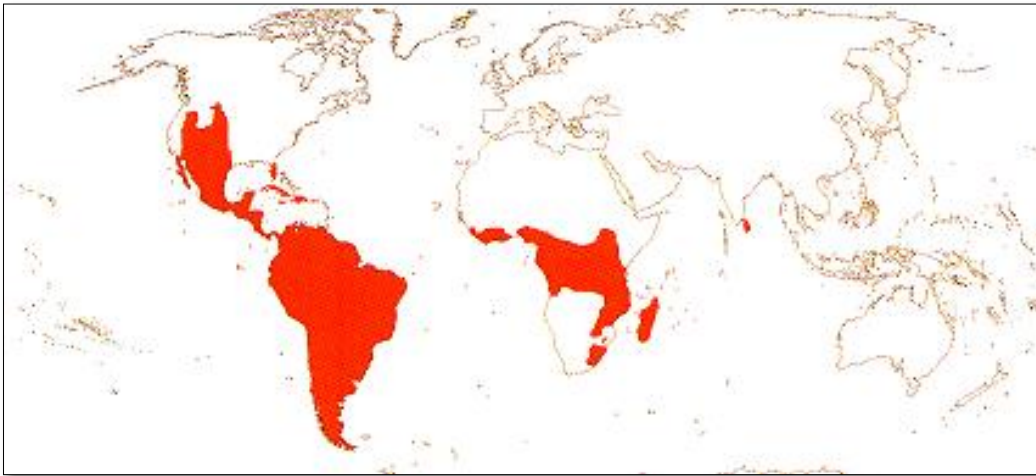
Slika 3: Rasprostranjenost porodice Cactaceae

Kaktusi su danas rasprostranjeni po cijelom svijetu. Njihova pradomovina su pustinje i polupustinje tropske Amerike, od Kanade do Patagonije. U Andama ih nalazimo i do 4700 m nv. Prve primjerke u Europu su donijeli Kolumbovi mornari oko 1570. godine nakon otkrića Novog svijeta. Današnje područje rasprostranjenja (Slika 3) obuhvaća i Afriku, Madagaskar, Mauricijus, Sejšeli, Šri Lanku i Sredozemlje (Nikolić, 2013).