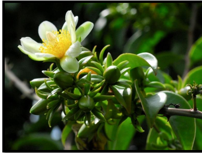
Slika 10: Kaktus Pereskia aculeata

Neke vrste kaktusa imaju prave, asimilacijske listove, te rastu kao lisnato grmlje. Primjer takvih kaktusa je Pereskia , koja predstavlja najprimitivniji oblik kaktusa (Slika 10).