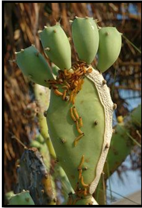
Slika 20: Gusjenice se hrane na kaktusu

Australija je 1925. godine uvezla jajašca kukca Cactoblastis cactorum iz Argentine, te su pušteni već sljedeće godine. Kukac Cactoblastis Cactorum uništava rod Opuntia u stadiju gusjenice (Slika 20). Do 1930. godine, populacija argentinskog kukca je izuzetno narasla, te je do 1933. ogromno područje bilo oslobođeno od invazivne vrste Opuntia . Mnogi dijelovi zemlje su sada bili raskršteni i pogodni za naseljavanje stanovništva.