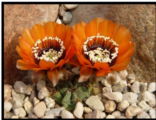
Slika 15: Lobivia jajoiana

Rast lobivije je kuglast, a kod nekih vrsta su rebra odvojena i pretvorena u ukošene grbe. Njihovo prepoznatljivo obilježje su bijeli, žuti, crveni, narančasti ili ružičasti cvjetovi koji traju samo jedan do dva dana. Čak i ljeti traže nešto hladnije temperature, a najbolje uspjeva kada je velika razlika između dnevne i noćne temperature.