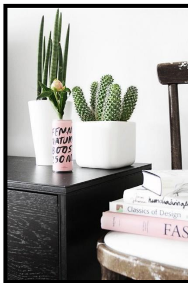
Slika 26: Kaktus kao sobna biljka

Većina kaktusa je manjeg rasta i ne zauzimaju mnogo prostora, stoga su vrlo zahvalni kao sobne biljke (Slika 28). Navikli su na suh zrak i malo vode, stoga ne traže puno pažnje i često zalijevanje. Saditi se mogu pojedinačno ili skupno u veću posudu, s čime postizemo efekt zelenog mini vrta.