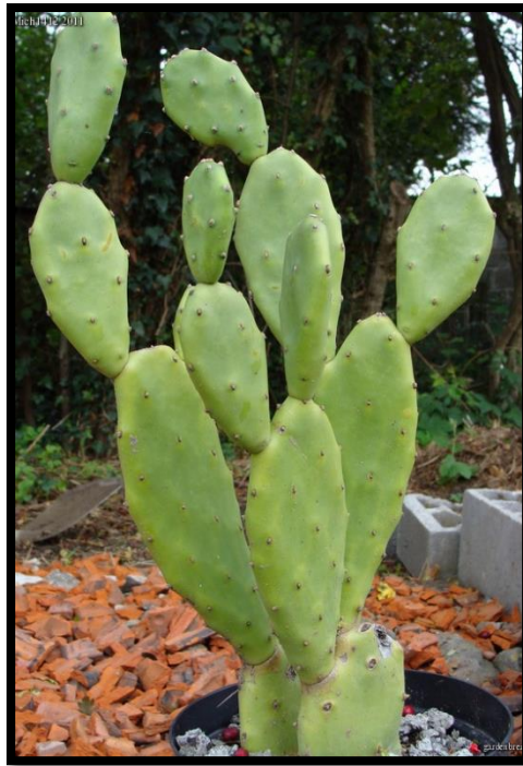
Slika 19: Opuntia inermis

Od nabrojanih sedam inavznivnih vrsta, dvije su bile najagresivnije. Opuntia inermis (Slika 19) se raširila po najvećem dijelu Australije i stoga se smatrala najopasnijim korovom. Također, i Opuntia stricta (Slika 21) je vrlo brzo prekrila velike površine diljem kontinenta.