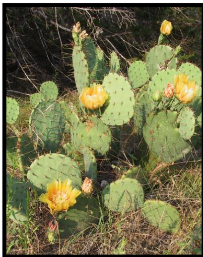
Slika 27: Opuntia humifusa

Možemo ih uzgajati u vanjskim vrtovima čak i u hladnijim područjima, gdje je važno izdvojiti vrstu Opuntia fragilis koji podnosi vrlo niske temperature, čak do -30^{\circ}\text{C} . Malo manje otporni, Opuntia humifusa (Slika 27) i Opuntia phaeacantha (Slika 30) mogu podnijeti temperature do -20^{\circ}\text{C} .