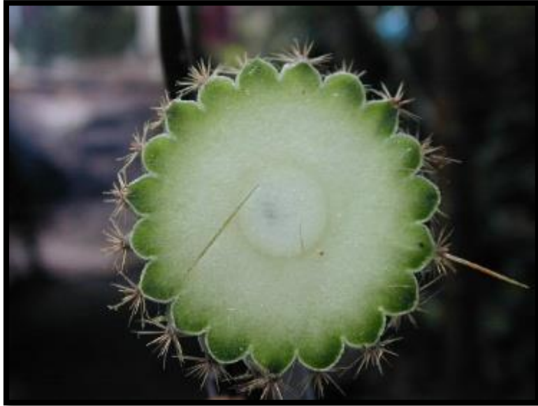
Slika 2: Presjek kroz tkivo kaktusa

mesnatim listovima ili stabljikama, što im omogućuje uspješno preživljavanje i normalan razvoj za vrijeme nepovoljnih sušnih razdoblja od nekoliko mjeseci, neovisno o tome dali rastu u stjenovitim pustinjama, suhim stepama ili pak suhim planinskim predjelima.