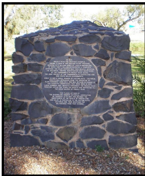
Slika 22: Cactoblastis spomenik

U znak zahvalnosti ovom leptiru, u mjestu Dalby (Queensland, Australija) izgrađen je spomenik (Cactoblastis monument, Slika 22). A otok Ascension je u znak zahvalnosti dizajnirao poštansku marku s likom kukca Cactoblastis cactorum (Slika 23).