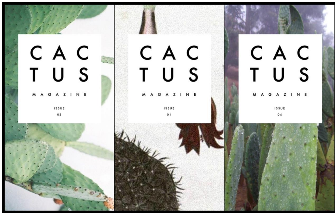
Slika 6: Naslovnice časopisa o kaktusima

5. The Succulent Society of South Africa