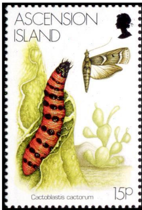
Slika 23: Poštanska markica Cactoblastis