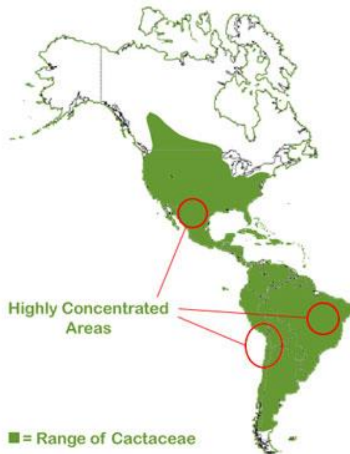
Slika 1: Porijeklo kaktusa

Kaktusi pripadaju porodici Cactaceae . Gotovo isključivo potječu iz Novog svijeta, odnosno iz Sjeverne, Srednje i Južne Amerike sa susjednim otocima (Slika 1). Područje rasprostranjenosti kaktusa se proteže od Kanade (gdje rastu zimootporne vrste opuncija) preko Meksika sve do južnih područja Čilea. Nalazimo ih i u visokim planinskim predjelima (u Andama čak i na visinama od 4000 metara) i u negostoljubivim kamenim pustinjama, gdje gotovo ni jedna druga biljna vrsta ne može opstati.