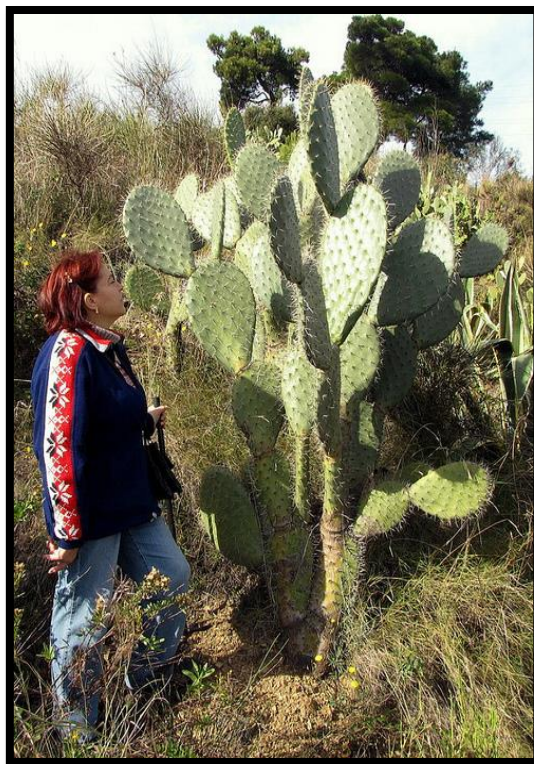
Slika 18: Opuntia streptacantha

Rod Opuntia broji više od 250 vrsta koji većinom potječu iz Amerike. Neke vrste su patuljaste, dok neke mogu narasti do veličine drveta (Slika 18). Dobro uspijevaju na suncu i u polusijeni, a preko zime im je potrebna veća količina vode. U ovom rodu se nalazi vrsta najotpornija na nepovoljne vremenske uvjete, a to je Opuntia fragilis . Plodovi vrsta roda Opuntia se nazivaju bodljikave kruške, odnosno indijske smokve. One su jestive, samo je potrebno odstraniti male bodljice.