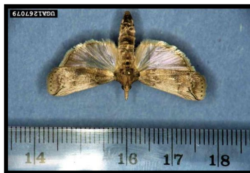
Slika 21: Leptir Cactoblastis cactorum

Osim Australije, rod Opuntia je pravio probleme na Havajima, u Indiji i Cejlonu, gdje je problem također riješen s kukcem Cactoblastis cactorum (Slika 21).