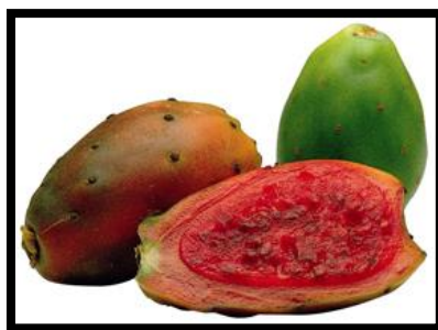
Slika 12: Plod kaktusa

Plod (Slika 12) je obično suhi nepucavac, dok je rijede suhi pucavac. Najčešće se razvija mnogosjemena boba. Unutrašnjost boba je najčešće ispunjena sočnom pulpom koja je nastala od unutrašnjih dijelova plodnih listova i placenti. Stjenka ploda može biti gola, vunasta, bodljikava i ljuskava. Sjemenke nemaju endosperm.