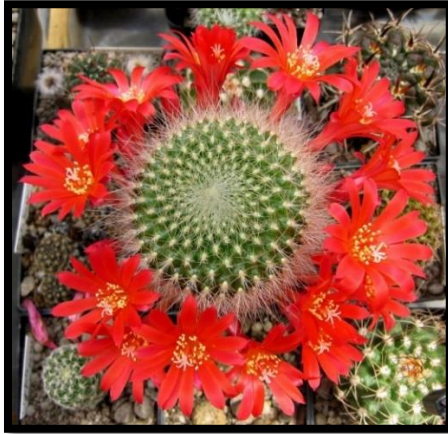
Slika 16: Rebutia senilis

Rebucije (Slika 16) su najbogatije cvjetovima. Oko njenog stabla izrastaju u obliku vjenčića. Kaktusi su kuglastog oblika i malog rasta. Cvjetovi su bijele, žute, narančaste, crvene i ružičaste boje.