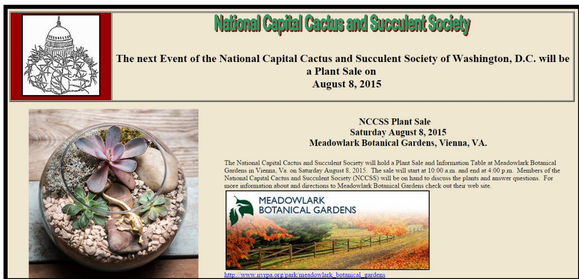
Slika 5: Web stranica Washington DC društva ljubitelja kaktusa