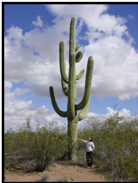
Slika 8: Kaktus Carnegiea gigantea u indijanskom rezervatu Tohono O'Odham

Nasuprot ovim patuljastim vrstama postoje i kaktusi golemih stupastih oblika, viših i od 20 m (Slika 8), kao npr. Carnegiea gigantea (Engelm.) Britton. et Rose.