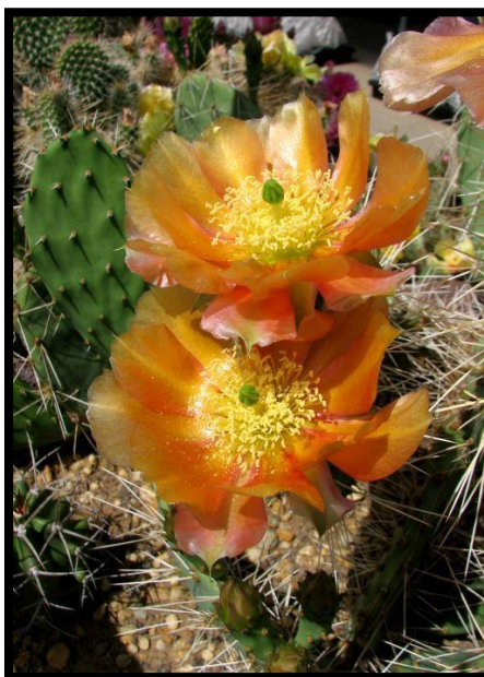
Slika 28: Opuntia phaeacantha