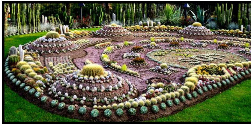
Slika 25: Vrt kaktusa

Kaktusi svoju izdržljivost duguju mesnatim listovima u koje pohranjuju vodu, što im omogućava preživljavanje u surovim klimama. Njihovi listovi su zanimljivih oblika, a budući da brzo rastu i razmnožavaju se, nisu im potrebne posebne pozicije i uvjeti. Mogu se uzgajati na stolu u dnevnom boravku, vrtu, balkonu (Slika 25). Potrebno je samo malo zemlje te dosta svjetlosti i sunca.