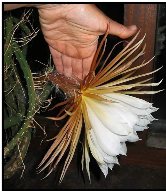
Slika 11: Selenicereus grandiflorus