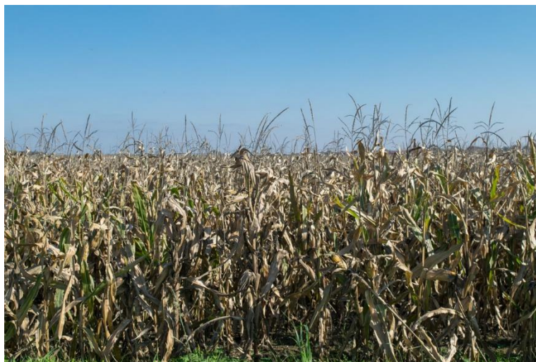
Slika 3. Usjev kukuruza

Kukuruz u 2016. godini na P.D. “Lešić Ivica” zasijan na 10,92 ha. Na parceli “Račkovica” (veličine 8,04 ha) predusjev je bila soja, a na parceli „Blajna ” (veličine 2,88 ha) predusjev je bila šećerna repa.