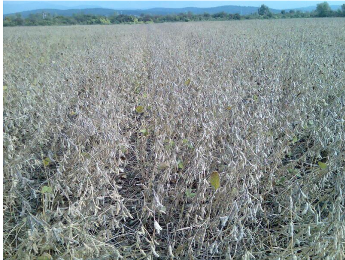
Slika 2. Soja pred žetvu

( http://poljoprivredni-forum.com/showthread.php?t=16343&page=14 )