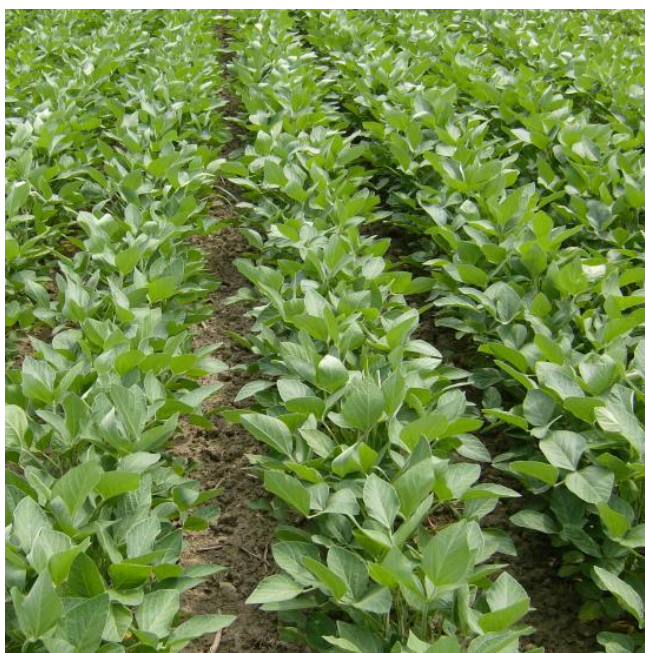
Slika 1. Biljka soje

Soja je u 2016. godini na P.D. “Lešić Ivica” zasijana na 7,68 ha. Na parceli “Raščica” (veličine 7,1 ha) predusjev je bila pšenica, a na parceli “Bistra” (veličine 0,58 ha) predusjev je bio kukuruz. Na Slici 1. prikazan je usjev soje.