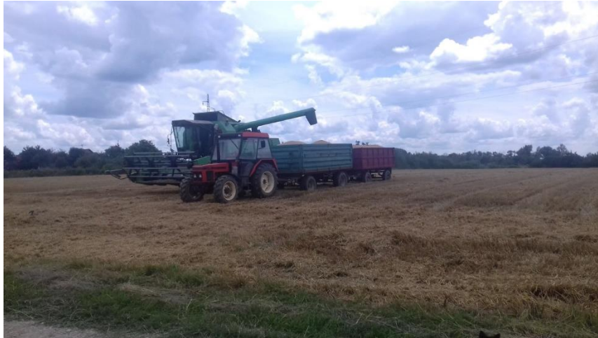
Slika 5. Žetva pšenice (vlastita fotografija)