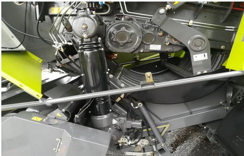
Slika 11. Pogon komore

Zatim takvo sijeno dolazi do komore za oblikovanje bala koja je četverokutne izvedbe u kojoj se nalazi klip koji se kreće uz pomoć zamašnjaka, na vrhu klipa nalazi se nož koji odsijeca svaki sloj sijena zbog lakšeg sabijanja (slika 11.).