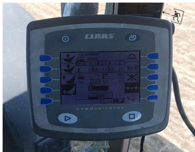
Slika 8. Claas komunikator