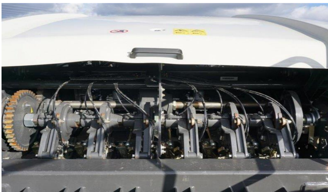
Slika 7. Uređaj za vezivanje bala

Uređaj za vezanje – vezanje bala kod presa visokog pritiska se vrši jačim konopom-manilom ili žicom. Bale se vežu sa 2 uzdužna veza tako da uređaj za vezanje ima 6 aparata za vezanje i automat za uključivanje vezača. Svaki aparat se sastoji od igle, petljača, držača konopa i noža. Igla je polumjesečastog oblika, a zadatak joj je da donese drugi kraj konopa preko petljača u držač, a nakon završenog vezanja ostavlja prvi kraj konopa za narednu balu. Hod igle mora biti usklađen sa kretanjem klipa. Igla je postavljena na koljenastoj osovini ispod uređaja za formiranje bala. Petljač se sastoji od kljuna i tega. Zadatak mu je da formira petlju. Držač konopa drži konop pri formiranju bale i pri vezanju. Može biti izveden u obliku horizontalnih ili vertikalnih diskova ili tanjura. Nož može biti pokretan i nepokretan.