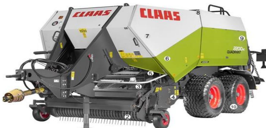
Slika 4. Dijelovi prese: 1. Upravljač, 2. Pick up uređaj, 3. Dupli rotor sa 4 zvijezde, 4. Roto rezač sa 25 noževa, 5. 3 progresivna ciklusa punjenja po jednom udaru klipa, 6. Interaktivna sigurnost između ulagača i podizanja, 7. 51 klip udubljenja, 8. 6 krakova jedno komponentnih čvorova bez ostataka niti, 9. 4 hidraulična kompresijska cilindra za više gustoće, 10. Kotači