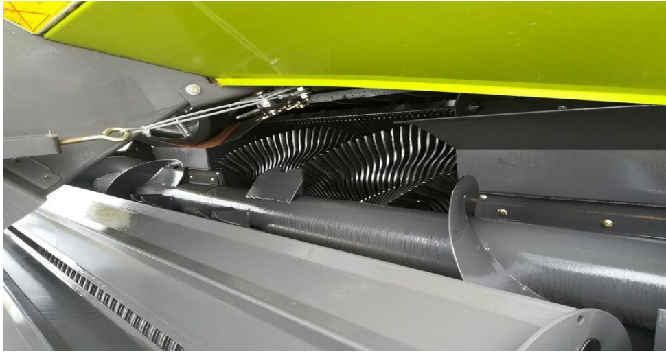
Slika 10. Uređaj za transport

Zupci se krećući prema dolje zahvaćaju sijeno te ga podižu sa tla i limovima uvlače unutra gdje se sijeno skida sa zubaca. Masa sijena putuje do dijela koji transportira sijeno u komoru za formiranje bala. Uređaj za transport izveden je u vidu pužnice koja mijenja smjer pod kutom od 90° (slika 10.).