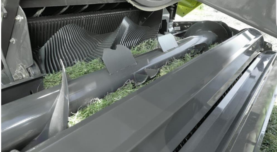
Slika 5. Uređaj za podizanje i transport sijena