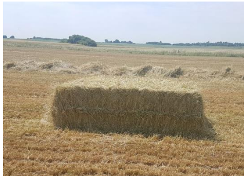
Slika 1. Izgled bale

Na slici 1. vidljiva je izvedba četvrtaste bale dimenzija 50 x 80 cm, a dužine su podesive. Pojedinačna masa bala je oko 400 kg, ali podesiva je i na veću masu. Bale se vežu debljom i jačom manilom 150 – 200 m/kg ili žicom.