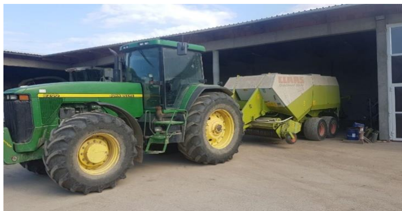
Slika 3. John Deere 8200 i Claas Quadrant 2200

Na slici 3. Prikazana je visokotlačna presa Claas Quadrant 2200 agregatirana sa traktorom John Deere 8200 .