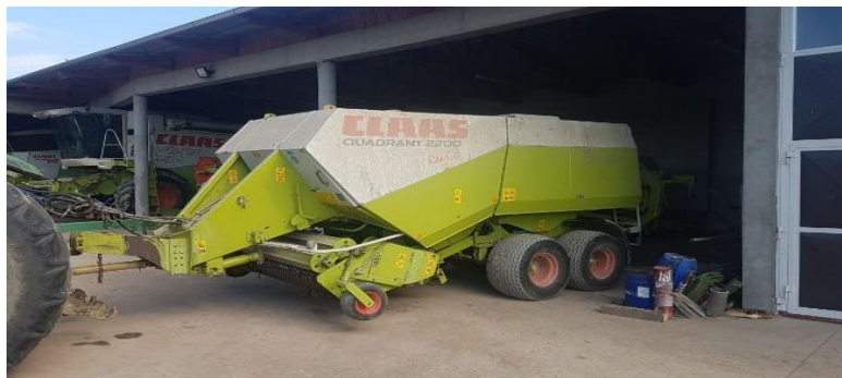
Slika 2. Claas Quadrant

Na slici 2. prikazana je visokotlačna presa Claas Quadrant 2200 prilikom tehničkog starenja na OPG-u „Kolak“.