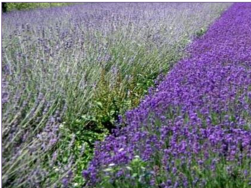
Slika 2. Lavandin „Budrovka“ (lijevo) i lavanda (desno) u jaskanskom području

latifolia Vill.) poznata kao lavandin. U Hrvatskoj je glavno područje uzgoja otok Hvar, gdje se uzgaja nekoliko sorata koje nisu determinirane do vrste, a uzgaja se najviše domaća lavanda, odnosno lavandin, tamnozelenih listova i izrazito plavih cvjetova (Slika 2). Godišnja proizvodnja eteričnog ulja lavandina iznosi svega oko 2 tone. Podataka o značajnijem uzgoju drugih vrsta i sorti lavande nema. Uzgoj lavande, temeljem značajnih državnih poticaja, danas se proširio u kontinentalnoj Hrvatskoj te u Istri (Ozimec i sur., 2009.).