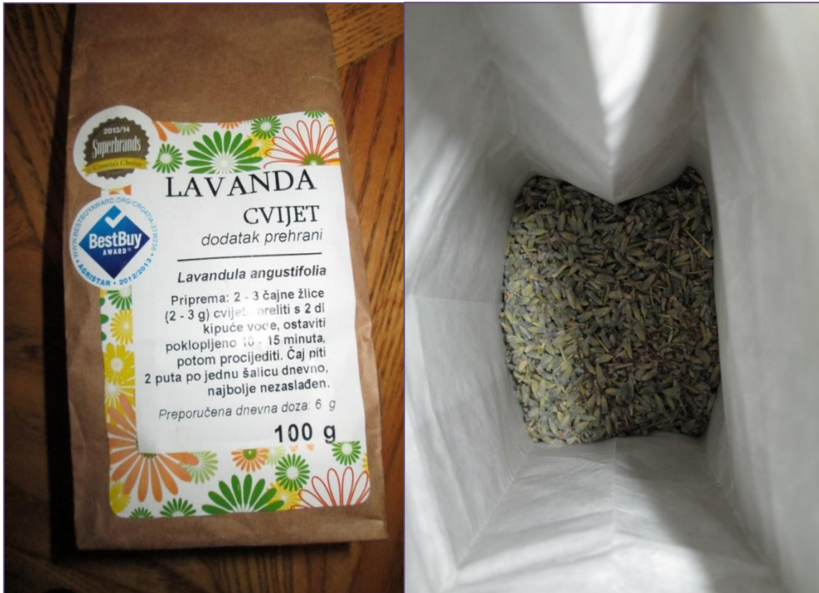
Slika 7. Cvjetovi lavande za pripremu čaja