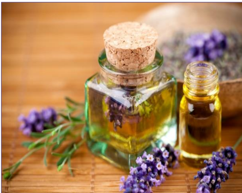
Slika 6. Eterično ulje lavande

kod unutarnje primjene eteričnog ulja lavande jer već 1 gram može nadražiti želudac i crijeva, te izazvati vrtoglavicu i pomućenje svijesti (www.ljekovite-bilje.hr, 2018.).