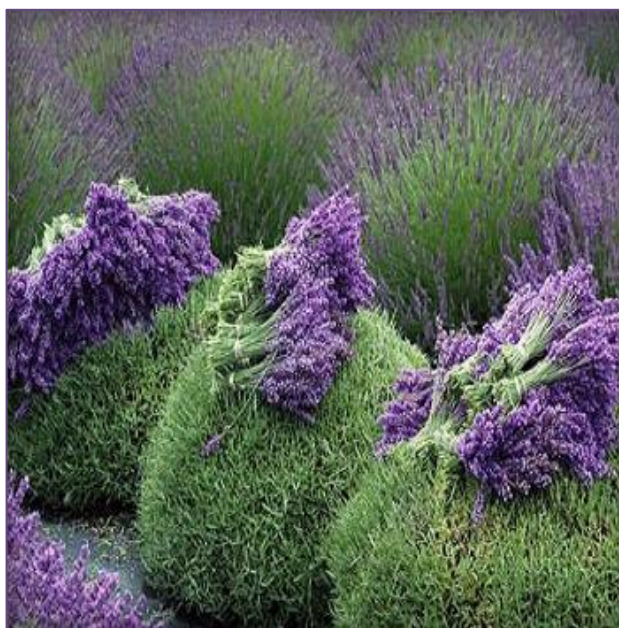
Slika 1. Lavanda

Lavanda je vrlo omiljena ukrasna biljka, a sve više se uzgaja i plantažno. Ime lavanda potječe od latinske riječi lavare što znači kupati se, i objašnjava osnovnu namjenu suhoga cvijeta i lavandinog eteričnog ulja. Lavanda (Slika 1) posjeduje brojna ljekovita svojstva koja su početkom 20. stoljeća otkrivena sasvim slučajno. Francuski kemičar Rene Gattefosse (jedan od utemeljitelja aromaterapije) je radeći u svome laboratoriju zadobio tešku opeklinu ruke. Rastreseno je ozlijeđenu ruku uronio u najbližu tekućinu, a to je bila posuda puna eteričnoga ulja lavande. Bol se ublažila, a opeklinu je zarasla puno brže od očekivanoga. Sva istraživanja koja su provedena nakon toga su potvrdila antiseptično i antibakterijsko svojstvo lavande, te ispravnost njezine ljekovite primjene (www.agroklub.com, 2018.).