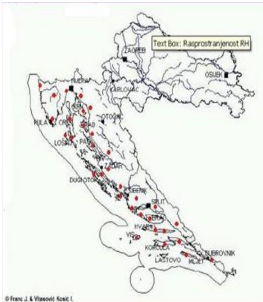
Slika 5. Rasprostranjenost lavande