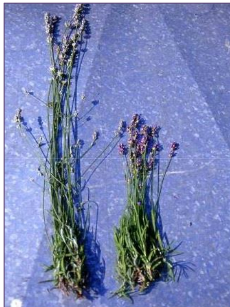
Slika 4. Razlika u visini i razgranatosti cvjetne stabljike lavandina „Budrovka“ (lijevo) i lavande (desno)