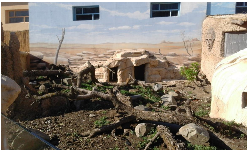
Slika 4. Nastamba za merkate u osječkom zoološkom vrtu

Ova slika je dobar primjer nastambe za merkate jer ima odgovarajuću površinu, životinje imaju zaklon od ljudskih pogleda, mogu vidjeti što se događa i nije previše skućena, ne moraju biti direktno na suncu ako ne žele i približno je napravljena onom okolišu u kojem oni inače obitavaju, iako možda ima malo više obogaćen prostor nego u divljini. Osim ovog dijela što se vidi na slici, postoji još i unutarnji dio nastambe u kojem im se nalaze hrana i voda, a posjetitelji taj dio mogu vidjeti kroz posebno napravljeni prozor, ali postoji i dio koji posjetitelji ne mogu vidjeti unutra. Također, životinje mogu zemlju kopati, a i već su si napravile svoje tunele kao što to inače u divljini rade.