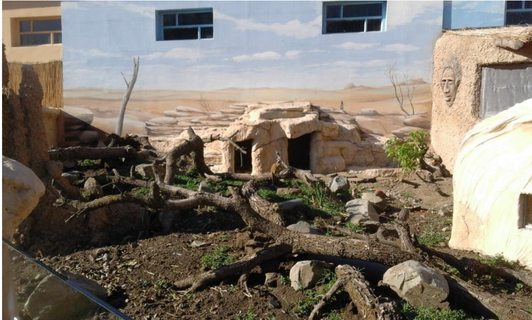
Slika 4. Nastamba za merkate u osječkom zoološkom vrtu

Ova slika je dobar primjer nastambe za merkate jer ima odgovarajuću površinu, životinje imaju zaklon od ljudskih pogleda, mogu vidjeti što se događa i nije previše skućena, ne moraju biti direktno na suncu ako ne žele i približno je napravljena onom okolišu u kojem oni inače obitavaju, iako možda ima malo više obogaćen prostor nego u divljini. Osim ovog dijela što se vidi na slici, postoji još i unutarnji dio nastambe u kojem im se nalaze hrana i voda, a posjetitelji taj dio mogu vidjeti kroz posebno napravljeni prozor, ali postoji i dio koji posjetitelji ne mogu vidjeti unutra. Također, životinje mogu zemlju kopati, a i već su si napravile svoje tunele kao što to inače u divljini rade.