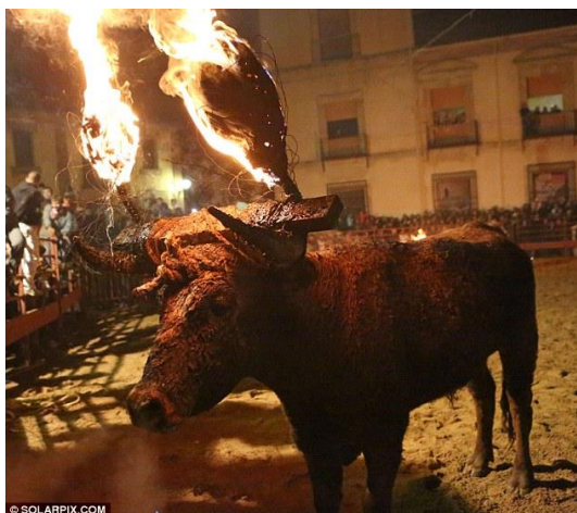
Slika 6. Bik s vatrom na rogovima

Španjolska nas nastavlja užasavati još jednom okrutnom tradicijom, a to je paljenje vatre na rogovima mladih bikova (Slika 6.). Ovaj događaj se odvija u pokrajini Soria, blizu Madrida.