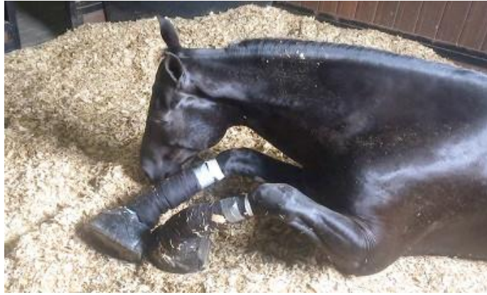
Slika 11: Konj podložen metodi za visok neprirodni hod