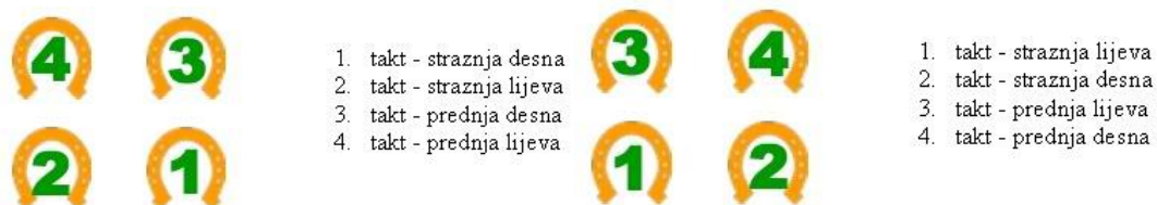
Slika 10: Lijevi i desni galop

Galop je najbrže kretanje konja. Dijeli se na lijevi i desni galop (Slika 10).