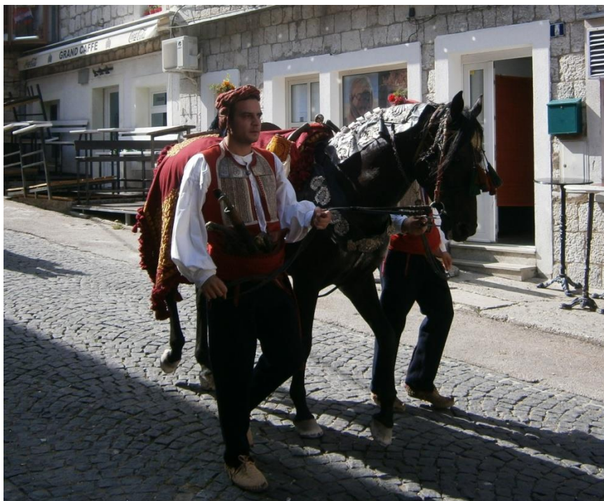
Slika 7. Edek

U Sinjskoj alci se konje poštuje kao i samu tradiciju, pa su tako dobili naziv alkarski konji. Više različitih pasmina mogu spadati pod alkarske konje, a najčešći su arapski konji, engleski punokrvnjaci i lipicanci. Osim njih, stazom trče i pasmine holstein, trakeneri, gidrani, buđoni, čak i polukrvnjaci i križanci. Alkarska ergela pokušava uzgojiti tip konja Alkar. Taj konj bi trebao biti brz, mirnog galopa i temperamenta. Konj kojeg nitko ne jaše je edek (Slika 7.), opremljen je sedlom turskog podrijetla sa srebrom i sedefom umetnutim u drvene dijelove. Na sedlu konja visi sablja ukrašena i okovana srebrom. Edek je pričuvni konj vojvode, iako ga je narodna predaja poistovjetila sa zarobljenim konjem Seraskara Mehemed-paše.