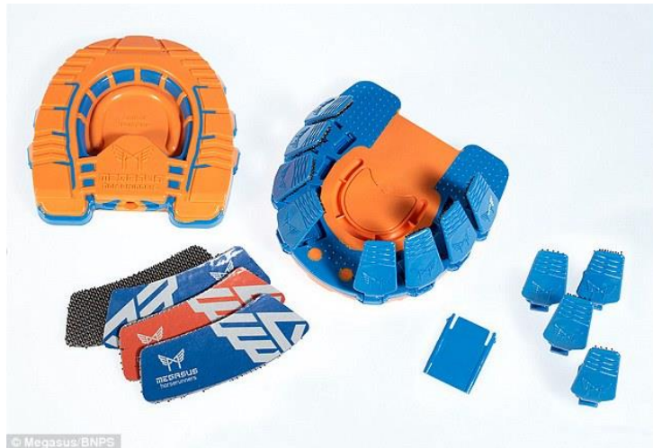
Slika 9. „Clip-on“ potkove

Primjer poboljšanja konjičke opreme su potkove koje se mogu zalijepiti ili zakačiti za kopito. Potkove koje se mogu zalijepiti dizajnirali su John Wright i Jeffery Newnhman. Jedini problem na koji su naišli je taj što po zakonu u Ujedinjenom Kraljevstvu (UK) konje moraju potkivati licencirani profesionalci, tj. vlasnik ne smije sam potkivati konja, što znači da ne smije koristiti ovu vrstu potkova. Međutim, ovu inovaciju su priznali dizajneri iz USA-a pa ove potkove mogu koristiti vlasnici konja u državama gdje ne postoji zakon kao u UK-u. Još jedna zamjena za klasične potkove su „clip-on“ potkove (Slika 9). Te potkove su dizajnirane tako da se zakače na kopito, te ne sadrže materijal koji bi mogao naštetiti životinji.