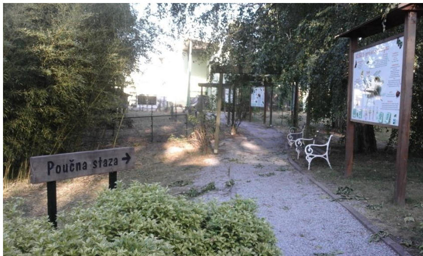
Slika 1. Ploče za edukaciju posjetitelja u osječkom zoološkom vrtu

podignu prikazuju odgovor na postavljeno pitanje, što može i djecu zainteresirati da što više nauče o životinjama.