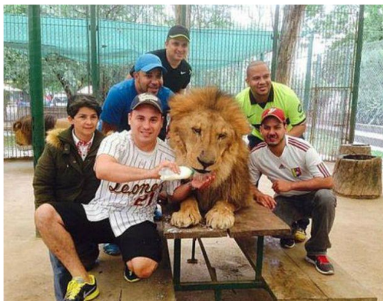
Slika 3. Nadrogirani lav

Jedan zoološki vrt u Argentini išao je toliko daleko zbog novca, da su drogirali životinje samo kako bi se ljudi mogli s njima slikati. Tom zoološkom vrtu je prijetilo zatvaranje, iako nisam mogla naći nikakve daljnje informacije što se na kraju dogodilo sa tim zoološkim i životinjama u njemu. Tamošnji zakon zabranjuje direktan kontakt između ljudi i životinja, ali na društvenim mrežama su se pojavljivale slike posjetitelja u direktnom kontaktu sa životinjama što se jasno vidi na slikama (Slika 3.), a to je pobudilo organizacije za zaštitu životinja.