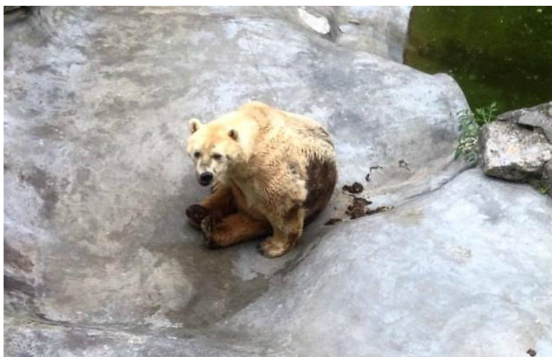
Slika 2. Polarni medvijed u beogradskom zoološkom vrtu

Jedan zoološki vrt u Argentini išao je toliko daleko zbog novca, da su drogirali životinje samo kako bi se ljudi mogli s njima slikati. Tom zoološkom vrtu je prijetilo zatvaranje, iako nisam mogla naći nikakve daljnje informacije što se na kraju dogodilo sa tim zoološkim i životinjama u njemu. Tamošnji zakon zabranjuje direktan kontakt između ljudi i životinja, ali na društvenim mrežama su se pojavljivale slike posjetitelja u direktnom kontaktu sa životinjama što se jasno vidi na slikama (Slika 3.), a to je pobudilo organizacije za zaštitu životinja.