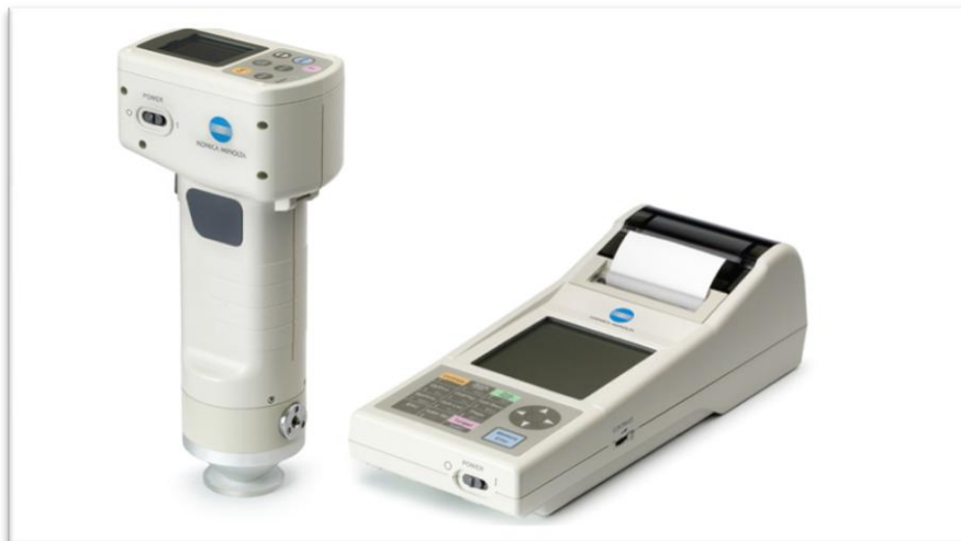
Slika 9. Minolta CR 300

Boja mesa je prvi kriterij kojim se potrošači vode prilikom kupovine mesa. Sadržaj pigmentata, sadržaju unutarmišićne masti te kemijske reakcije koje se događaju unutar njega su čimbenici o kojima ovisi boja mesa. CIE (Commision Internationale de l' Eclairage, 1976.) vrijednostima se označavaju vrijednosti boje koje se mogu odrediti pomoću Minolta – 300, Labscan II ili nekim drugim uređajima. Vrijednosti kojima se izražava boja mesa su L^* , a^* i b^* gdje L^* označava bljedoću, a^* stupanj crvenila mesa i b^* mjeri stupanj žute boje. Osim toga, boja se može odrediti i vizualno skalom od 1 do 5 gdje 1 označava najsvjetliju nijansu, a 5 najtamniju (Kralik i sur., 2007.). Mioglobin se može javiti u tri oblika, a to su reducirani pigment koji je purpurno – crvene je boje, oksimioglobin koji je oksigenizirani pigment i svijetlocrvene je boje te metmioglobin koji je oksidirani pigment i tamnocrvene je boje (Kovačević, 2001.). Nadalje, meso koje ima veći udio unutarmišićne masti ima svjetliju boju u odnosu na meso kod kojeg je unutarmišićna mast manje zastupljena (Brewer i McKeith, 1999.).