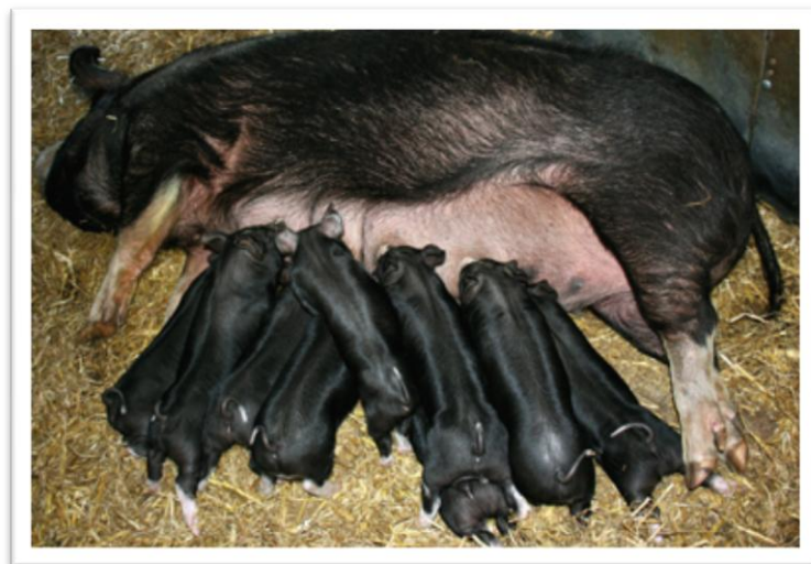
Slika 4. Dojna krmača s prascima

Meso berkšira sadrži veći postotak unutar-mišićne masti od novijih plemenitih pasmina koje imaju 2 do 3%. Radi navedenog suhomesnate prerađevine proizvedene od berkšir pasmine su dobre kakvoće. Berkšir se smatra pasminom kombiniranih svojstava, tj. mesnato masnom pasminom (HPA, 2016.).