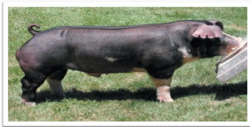
Slika 5. Poland china

Krmače ove pasmine su ranozrele i srednje plodnosti. Prase 7 do 9 prasadi u leglu težine 1,2 do 1,3 kg. Tovna svojstva i kakvoća mesa također su zadovoljavajući (HPA, 2016.).