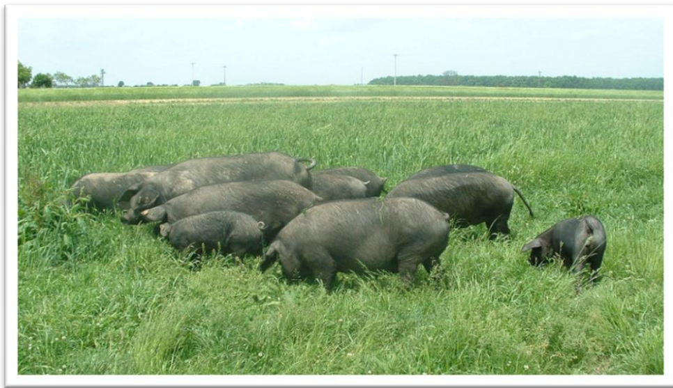
Slika 8. Svinje na ispustu s kućicama

Ekstenzivno držanje crne slavonske svinje sa ispašom ima dugu tradiciju u Republici Hrvatskoj. Za držanje fajferice na otvorenom treba osigurati dovoljno velike pašnjačke ili šumske površine. Prema podacima najveći broj uzgajivača nalazi se u Vukovarsko – srijemskoj, Sisačko – moslavačkoj i Brodsko – posavskoj Županiji. Primjeri iz Europske Unije pokazuju da je ekstenzivna proizvodnja zaštićenih domaćih pasmina svinja na otvorenom pogodna za seoski turizam. Prednost je u tome što su pasmine manje podložne stresu što je važno u daljnjoj reprodukciji, zatim potrebna su manja investicijska sredstva nego kod izgradnje farmi za intenzivan uzgoj. Smatra se da se na jednom hektaru površine može držati 20 do 25 krmača s podmlatkom do 30 kg. Nakon jednog turnusa trebalo bi površinu odmoriti po dva do tri mjeseca. Odmor površine potreban je radi sprječavanja zaraza prasadi i ostalih kategorija svinja (Károlyi i sur., 2010a.).