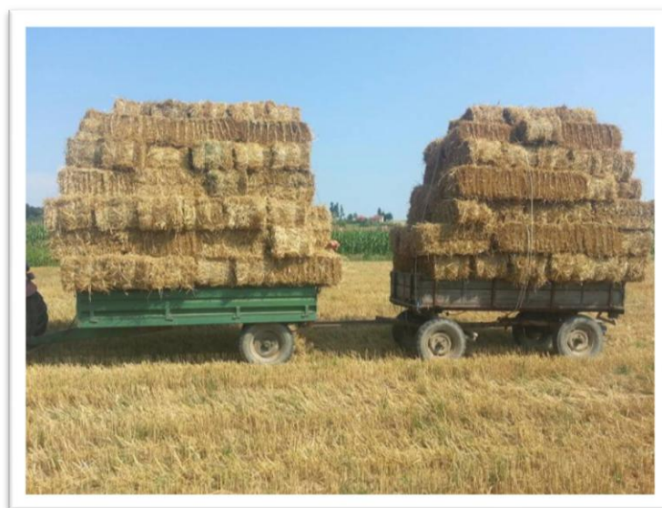
Slika 7. Transport slame za tovljenike

Držanjem svinja na dubokoj stelji dobiva se kvalitetan svinjski gnoj, što doprinosi smanjivanju upotrebe mineralnih gnojiva na gospodarstvu i snižavaju troškove gnojidbe. Zagađenje okoliša s razgradnim plinovima ( amonijak, ugljični dioksid, sumporovodik) je minimalno. S obzirom da nema pranja obora, potrošnja vode na gospodarstvima je minimalna. Ventilacija tovlilišta odvija se preko prozora jer zbog minimalnog zagađenja štetnim plinovima nije potrebno osiguravati dodatnu ventilaciju. Troškovi izgradnje objekata su manji po m 2 površine poda jer se ne ugrađuje kanalizacija i oprema za ventilaciju, kao i zbog potrebe manjeg broja obora s pregradama i pojilicama.