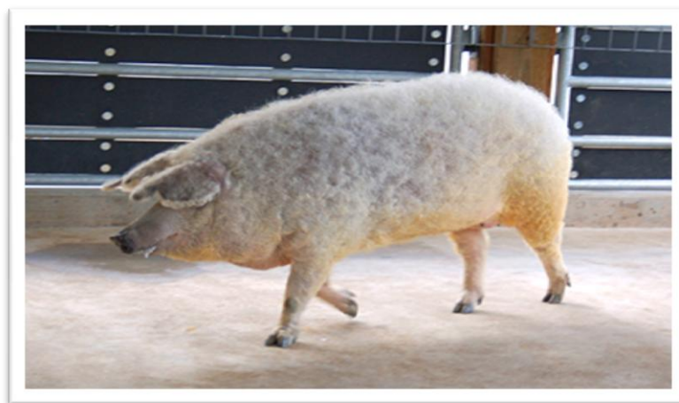
Slika 3. Lasasta mangulica

Glava lasaste mangulice je srednje duga i ugnuta s klampavim ušima. Manjeg je trupa od svijetlog soja mangulice pokrivenog gustom kovrčavom smeđom čekinjom, osim na nogama i trбуhu. Ova pasmina je imala kratke i oborene sapi i tanke cjevanice, što se kao nedostatak javlja i u crnoj slavonskoj pasmini svinja. Lasasta mangulica je kasno dozrela pasmina. Spolnu dozrelost nazimnice postižu s navršenom godinom starosti. Krmače u zreloj dobi postižu tjelesnu masu oko 150 kg i prase 3 do 6, nerijetko i više prasadi u leglu teške oko 1,2 kg. Prasad se rađa s bijelo-tamnim uzdužnim prugama, koje nestaju s navršenih tri mjeseca starosti. Prasad je sa starosti od 2 mjeseca teška 9 do 10 kg. U tovu s kukuruzom tjelesnu masu od 100 kg tovljenici postižu s 8 mjeseci, trošeći 6 do 7 kg kukuruza za kilogram prirasta. Lasasta mangulica je tipična masna pasmina s 2/3 masti i 1/3 mesa u trupovima. Meso s grubim mišićnim vlaknima je slabije kakvoće, pa su prerađevine suhe, tvrde i manje ukusne (HPA, 2016.).