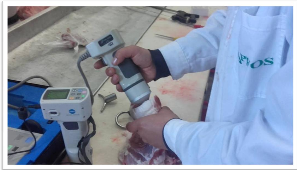
Slika 11. Određivanje boje na uzorcima mesa

pH vrijednosti je određena 45 minuta post mortem te 24 h post mortem pomoću uređaja Mettler Toledo“ MP120-B. Vrijednost je izmjerena ubodom mjerne sonde na odsječku m. longissimus dorsi te na m. Semimebranosus . Boja mesa je izmjerena na odsječku najdužeg leđnog mišića 24 sata post mortem pomoću Minolta kolorimetra (CR 300, Minolta Camera Co. Ltd., Osaka Japan). Gubitak mesnog soka, odnosno drip loss, određen je „metodom vrećice“ prema Kauffmanu (1992).