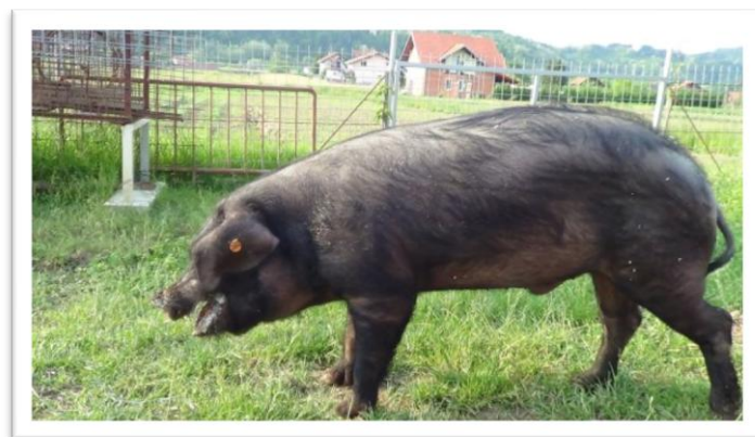
Slika 2. Eksterijer nerasta crne slavonske svinje

Glava crne slavonske svinje je duga s ugnutom profilnom linijom i poluklopavim ušima. Trup je relativno kratak s dubokim i širokim prsima. Butovi su srednje obrasli mišićima. Noge crne slavonske svinje su kratke i tanke. Koža je pepeljasto sive boje obrasla rijetkom, ravnom i dugom crnom sjajnom čekinjom (Karolyi i sur., 2010.).