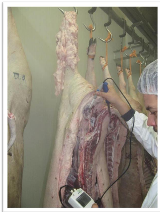
Slika 10. Mjerenje inicijalne pH vrijednosti na polovicama

Nakon klanja na toplim polovicama su uzete mjere mase polovica, dužine polovica, dužine i opsega buta i debljine slanine i mišića. Od klaoničkih svojstava uzeti su sljedeći parametri : pH 45 u butu i najdužem leđnom mišiću (MLD), pH 24 u butu i najdužem leđnom mišiću, boja mesa i sposobnost vezanja vode.