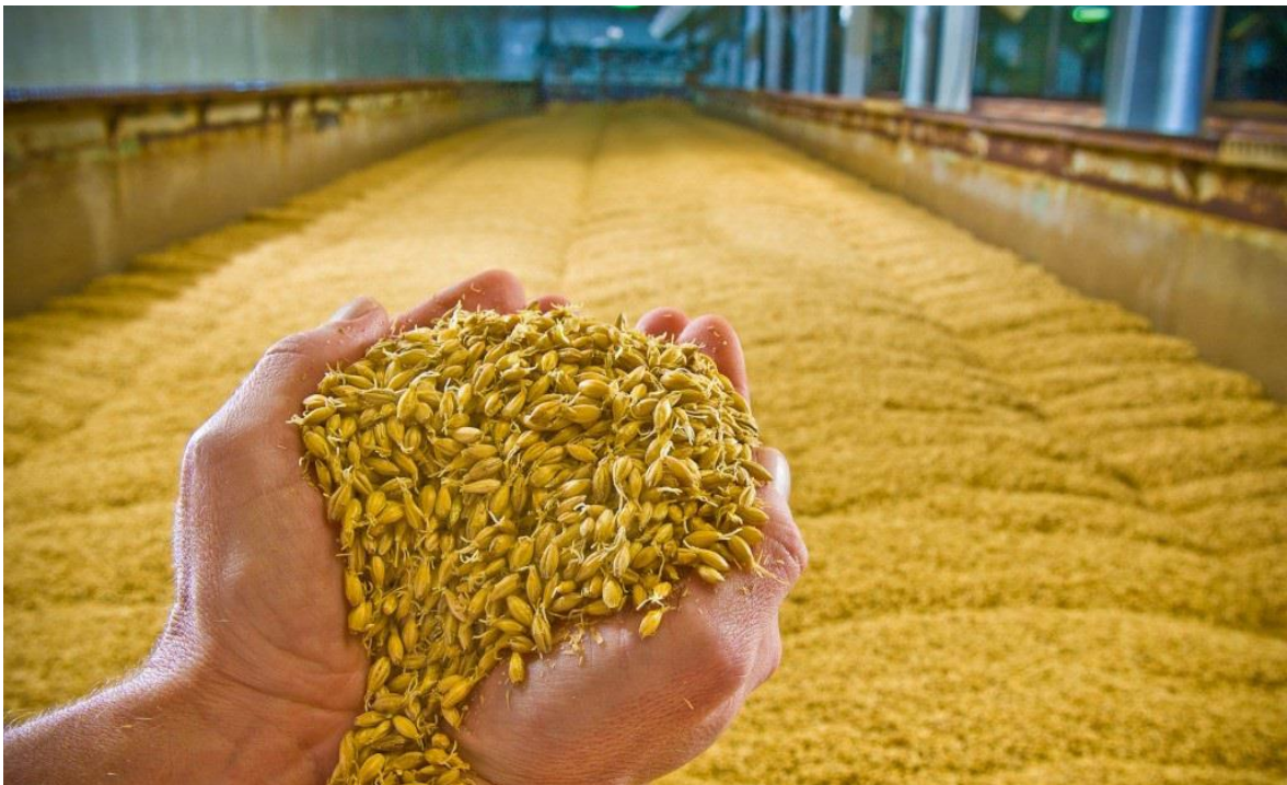
Slika 3. Ječmeni slad

U godinama s prosječnim temperaturama i količinom padalina sorte jarog ječma imaju veći sadržaj ekstrakta, a u godinama s manjkom vlage i visokim temperaturama slad je kvalitetniji kod ozimog ječma (Pržulj i sur., 1998.). Iskorištenje ekstrakta slada zavisi od sorte ječma, područja proizvodnje, godine proizvodnje i parametara koji se nalaze u korelaciji s iskorištenjem ekstrakta slada, kao što su sadržaj bjelančevina, sadržaj pljevica, udio zrna debljih od 2,8 mm i razgrađenosti staničnih opni u endospermu, koja osiguravaju dobro usitnjavanje slada i pristup enzima do škrobnih zrnaca tijekom komljenja (citolička razgrađenost), razgrađenosti bjelančevinskih supstanci (proteolitička razgrađenost) i razgrađenosti škroba u sladnom zrnju, odnosno sladovini nakon komljenja. Kolbachov broj je pokazatelj proteolitičke razgradnje i predstavlja udio rastvorljivog dušika u ukupnom dušiku slada.