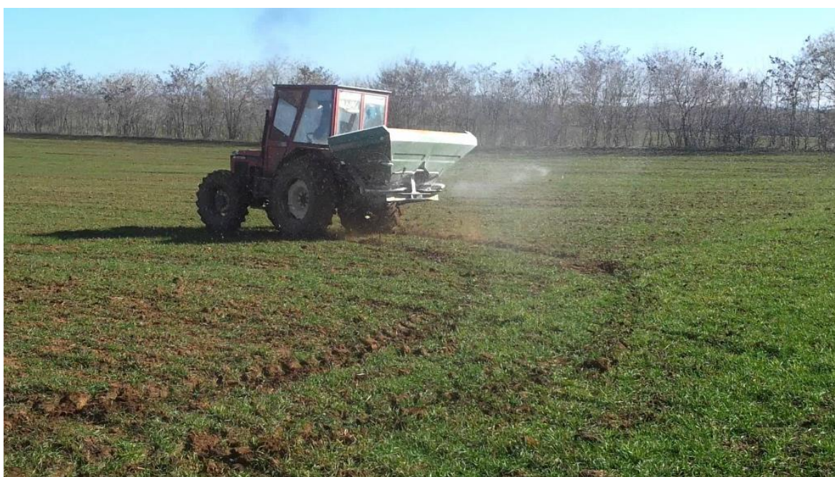
Slika 6. Prihrana ječma

Fosforna i kalijeva gnojiva se primjenjuju prije sjetve i to 1/2 prije osnovne obrade tla, a 1/2 kod predsjetvene obrade tla. Za jari ječam 1/2 ovih gnojiva treba primijeniti u jesen prilikom osnovne obrade tla, a jednu polovicu u proljeće kod predsjetvene obrade tla. Za ozimi ječam oko 20 – 30 % dušičnih gnojiva treba dodati prije sjetve, a ostala količina dodaje se tijekom vegetacije u dvije prihrane. Prva prihrana obavlja se odmah nakon kretanja vegetacije u proljeće i dodaje se 60 % preostalog dušika. Druga prihranu s preostalih 40 % dušika mora se obaviti do početka vlatanja jer kasnija prihrana može povećati sadržaj bjelančevina u zrnu. Osnovna gnojidba obavlja se NPK formulacijama gnojiva (8:26:26; 7:20:30; 5:20:30 S), a prihrana KAN-om (27 % dušika).