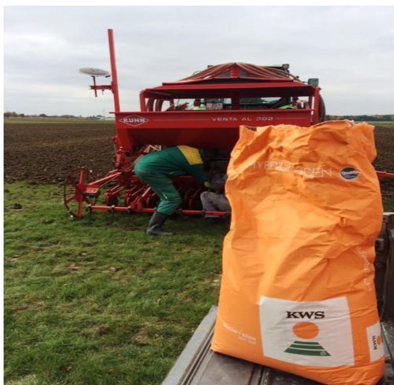
Slika 7. Sjetva pivarskog ječma

Dubina sjetve ovisi o tlu, roku sjetve, vlažnosti tla i temperaturi, a iznosi 3 – 5 cm za ozimi ječam (na lakšim tlima 4 - 5 cm, a na težim 3 cm) i 3 - 4 cm za jari ječam. Sije se žitnim sijačicama, na međuredni razmak 12,5 ili 15 cm.