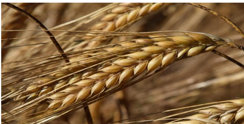
Slika 1. Klas ječma