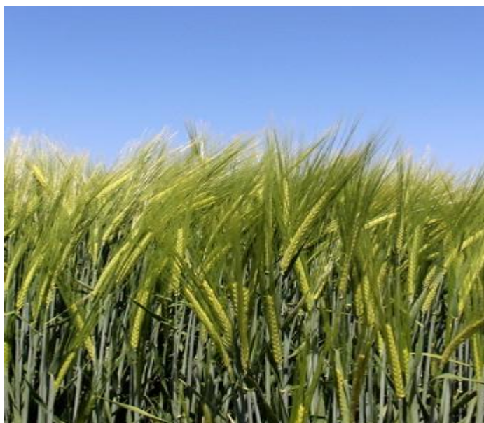
Slika 9. BC Vedran

To je ozimi ječam, dvorednog klasa. Visina stabljike je 85-88 cm. Otpornost na polijeganje mu je vrlo dobra. Masa 1000 zrna iznosi 44 – 47 grama, a hektolitarska masa 63-67 kg. Optimalni rok sjetve je od 1.10.- 20.10., preporučena norma sjetve iznosi 500 – 550 klijavih zrna/m 2 .