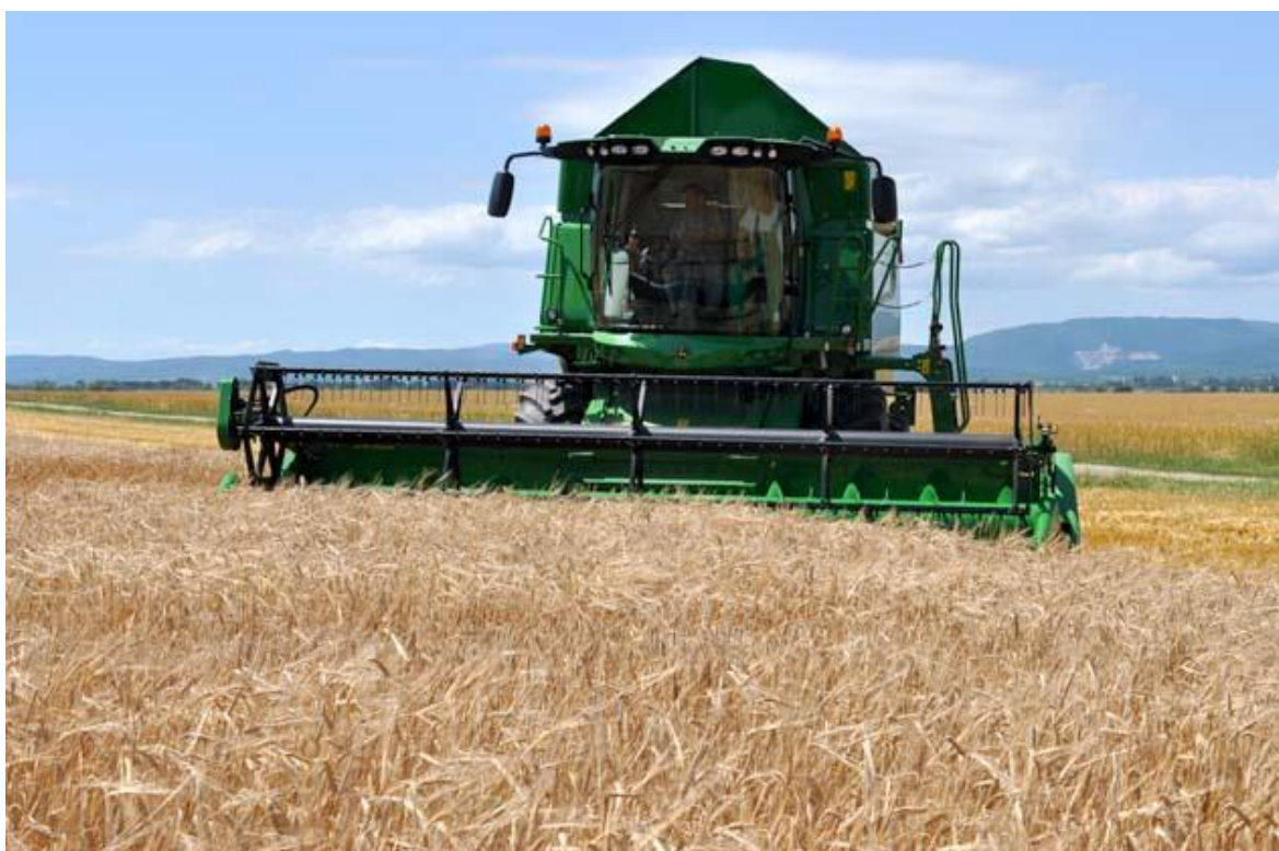
Slika 8. Žetva ječma

Žetva pivarskog ječma obavlja se kod vlage zrna od 14 %. Žetvu ječma treba obaviti u što kraćem roku jer u protivnom dolazi do smanjenja prinosa i kvalitete zrna. Žetvu treba obaviti u punoj zriobi. Ukoliko je neravnomjerno sazrijevanje, što često bude slučaj kod jarog ječma zbog različitih razloga, bolje je pričekati nekoliko dana. Ukoliko se žanje sa povećanom vlagom, zrno mora ići na sušenje što stvara dodatne probleme kod prijema, skladištenja, čuvanja tehnološke kvalitete, a povećava i troškove za proizvođača. Ječam se rano žanje pa se nakon njega mogu proizvoditi postrne kulture za zrno, krmu, silažu ili zelenu gnojidbu (Gračan i Todorčić 1983.). Uz provođenje svih agrotehničkih mjera može se očekivati 5 i više t ha -1 . Prinosi jarog ječma su niži od prinosa ozimog ječma, a kreću se u 3 do 4 t ha -1 , ali uz vrlo ranu sjetvu i intenzivne agrotehničke mjere i tehnologiju prinosa proizvodnje može se približiti razini prinosa ozimog ječma.