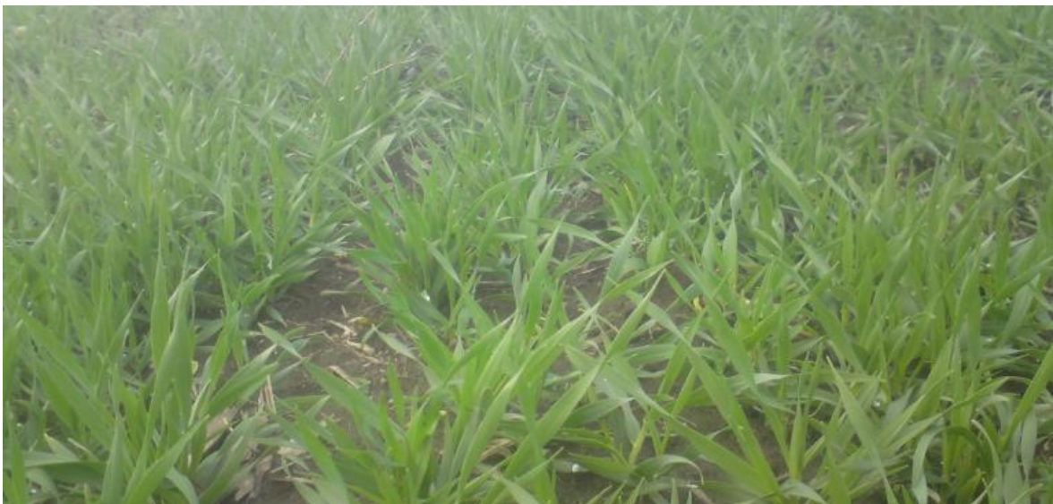
Slika 5. Ječam u fazi busanja

Ima slabije razvijeniji korijen od drugih žitarica i ne podnosi tla slabije kvalitete (naročito pivarski) te kisela tla. Takva tla treba izbjegavati dok se ne popravi stupanj njihove kiselosti. Optimalan pH iznosi 6,5-7,2. Za uzgoj ječma treba izabrati tla na kojima nema zadržavanja suvišnih oborinskih voda i visokih podzemnih voda. Klimatski uvjeti i tlo imaju veliki utjecaj na kemijski sastav zrna ječma. Zato ječam, a naročito pivarski, treba uzgajati na plodnijim tlima.