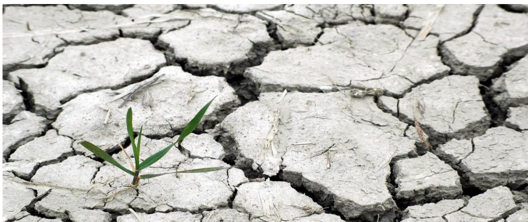
Slika 4. Posljedica suše na usjevu

Suše se u Hrvatskoj pojavljuju svake treće do pete godine, a ovisno o intenzitetu i dužini trajanja može smanjiti urod poljoprivrednih kultura i do 90 %. No, navodi se da je posljednjih godina najveća šteta uzrokovana poplavama, odnosno 41,8 % svih šteta uzrokovanih klimatskim varijabilnostima. Predviđa se daljnje smanjenje u prinosima ratarskih kultura na globalnoj razini zbog navedenih utjecaja. Od posebne važnosti bit će uvođenje sustava navodnjavanja. Poplave i stagnirajuće površinske vode, kojima je panonsko područje sve pogođenije, predstavljaju veliku prijetnju travnjacima i pašnjacima, ozimom pšenici te proljetnom ječmu. Zanimljivo je istaknuti da je panonsko područje i ostali prostor Republike Hrvatske iznimno ranjiv na pojavu tuče, te toplinskih valova.