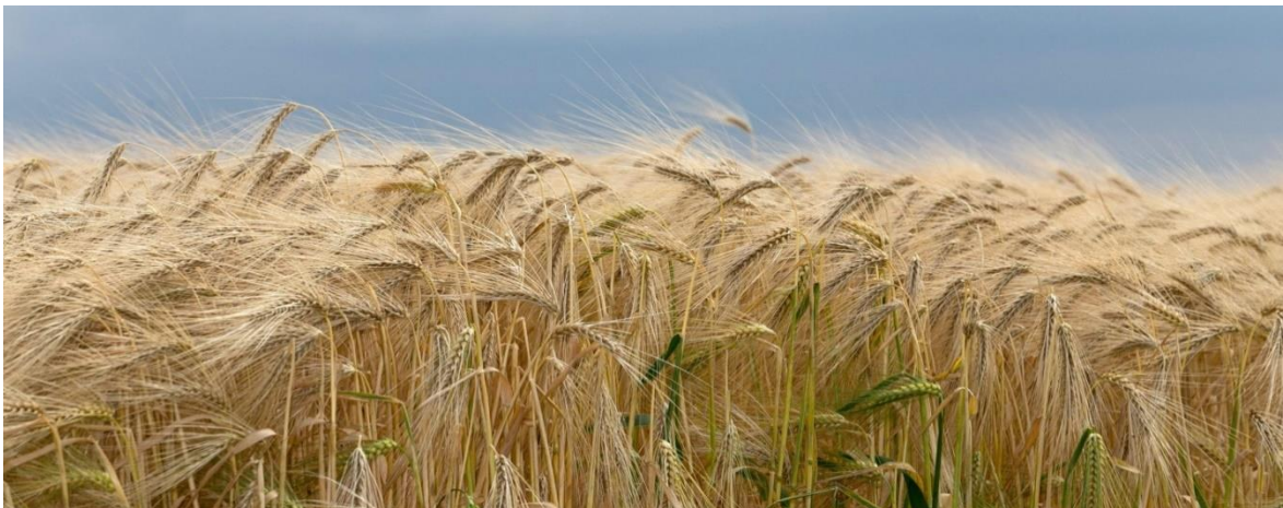
Slika 2. Pivarski ječam