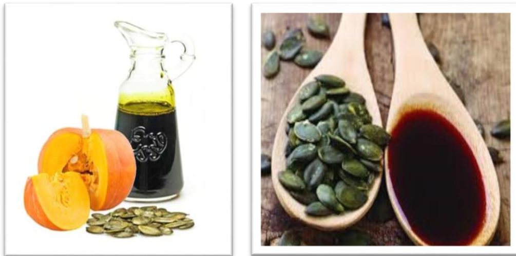
Slika 6. Ulje bundeve