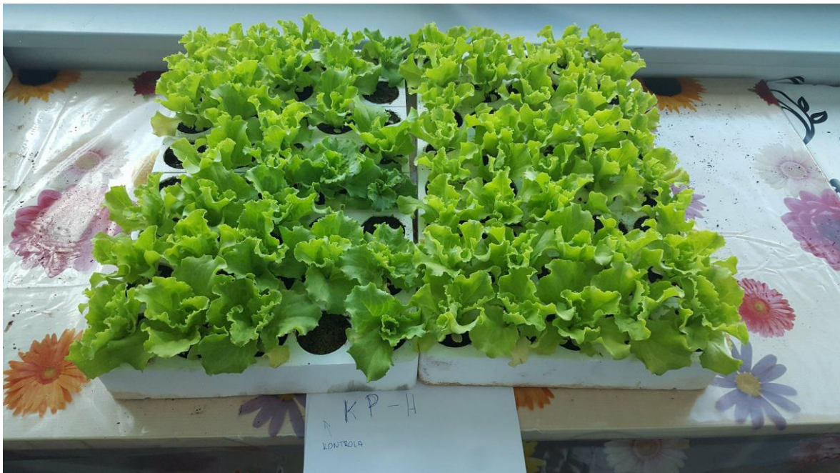
Slika 2. Kontrole i tretirane presadnice salate u KP-H supstratu

Analiza biljnog materijala provedena je u laboratoriju Zavoda za agroekologiju Poljoprivrednog fakulteta u Osijeku.