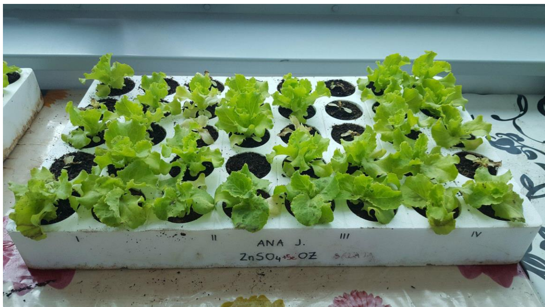
Slika 1. Presadnice salate u Organskoj zemlji

Isto tako, u okviru laboratorijskih istraživanja provedene su kemijske analize uzoraka supstrata na početku sjetve, te kemijske analize presadnica salate.