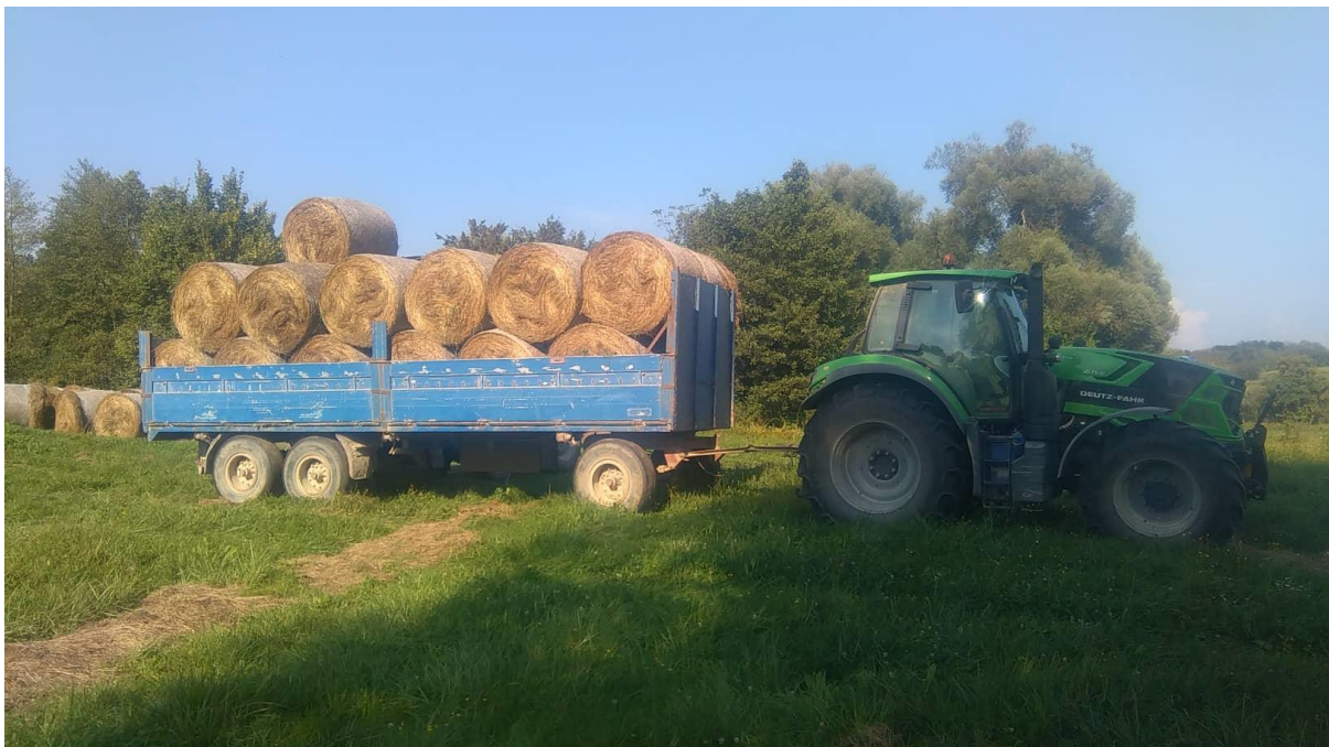
Slika 5: Transport bala sijena

gdje se spremaju pod nadstrešnicu. Prinos suhog sijena bio je oko 3000kg/ha. Količina bala sa jednog hektara bila je 12-13 rolo bala. Težina bale kretala se oko 250kg/bali.