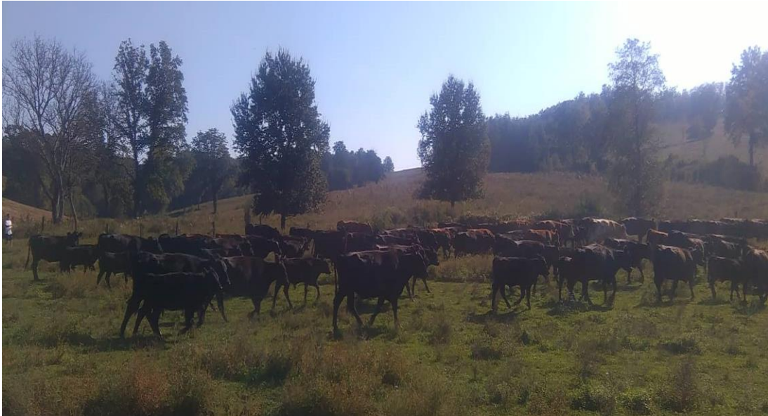
Slika 3: Pregon goveda sa pašnjaka