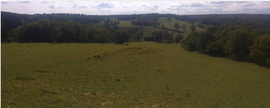
Slika 4: Pašnjaci na brdovitom terenu