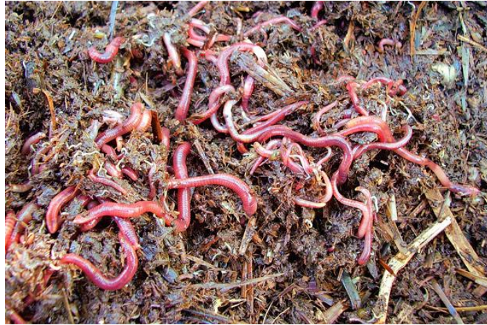
Slika 3: Vermikompost

https://www.ireceptar.cz/res/archive/240/028640.jpg?seek=1385557754