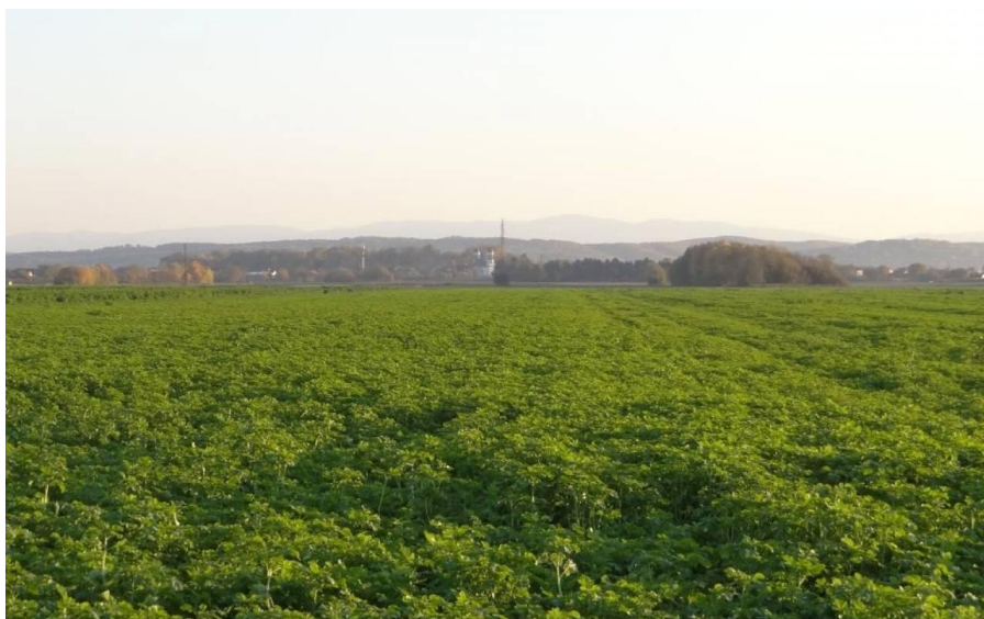
Slika 4: Zelena gnojidba

http://pinova.hr/media/34/2014/08/07/dc45279d691e493bf53d0ccd8cde7026_e9313706f95cf857a2cae00d3f71b77c_crop.jpg