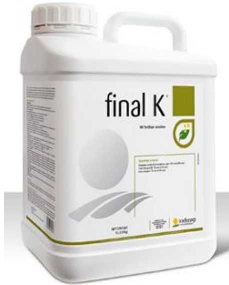
Slika 10: Kalijevo gnojivo

https://i2.wp.com/www.gnojidba.info/wp-content/uploads/2014/07/Final-K-etiketa.png