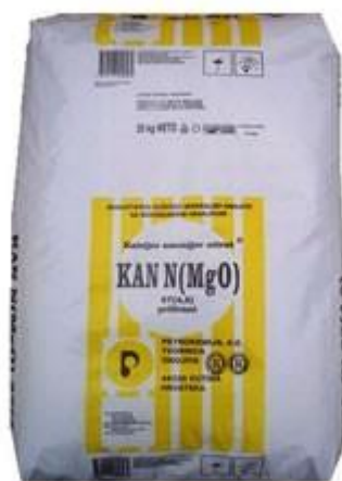
Slika 7: Pojedinačno dušično gnojivo KAN

Miješano gnojivo proizvodi se suhim miješanjem nekoliko gnojiva bez kemijske reakcije. (Lončarić i Karalić, 2015.).