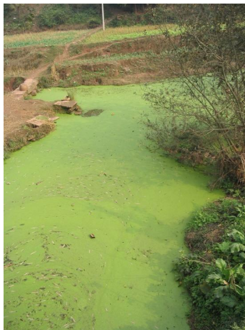
Slika 11: Eutrofikacija vode

https://upload.wikimedia.org/wikipedia/commons/thumb/7/74/River_algae_Sichuan.jpg/1200px-River_algae_Sichuan.jpg