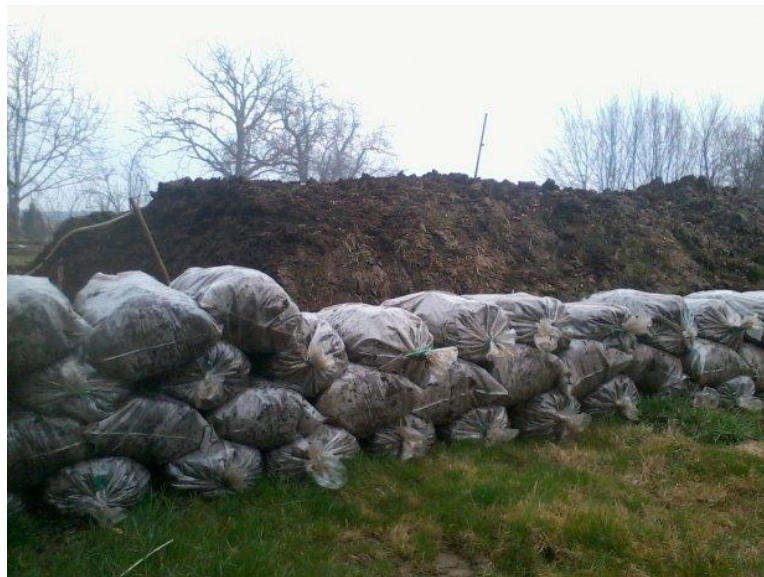
Slika 1: Zreli kruti stajski gnoj

Gnojnica ili tekući stajski gnoj je smjesa urina, vode, tvari koje nastaju razlaganjem urina te vrlo malih količina krutih čestica. Nastaje pri uzgoju domaćih životinja na stelji koja ne upija urin u potpunosti već se on skuplja u jamama za gnojnicu.