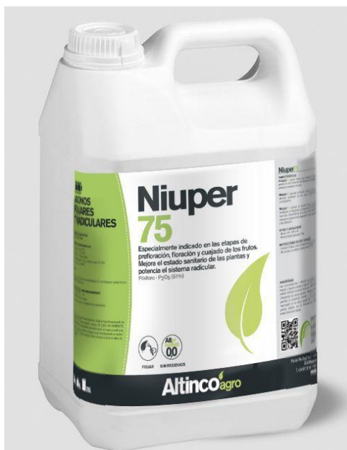
Slika 9: Visoko koncentrirano tekuće fosforno gnojivo

https://s7.pik.ba/galerija/2017-05/13/01/slika-718065-5916eb782f378-default.jpg