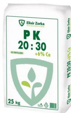
Slika 6: Složeno dvojno gnojivo (fosfor i kalij)

http://cerera-agro.hr/wp-content/uploads/2017/10/cerera-agro-SuperStart_10_35.png