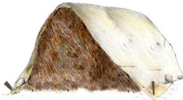
Slika 2: Kompostna hrpa

dugotrajni i spori procesi degradacije lignina i ostalih rezistentnih komponenti i stvaraju se stabilne humusne komponente (Slika 2.),(Lončarić i sur., 2015.).