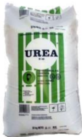
Slika 8: Pojedinačno dušično gnojivo UREA

https://s7.pik.ba/galerija/2017-05/13/01/slika-718065-5916eb782f378-default.jpg