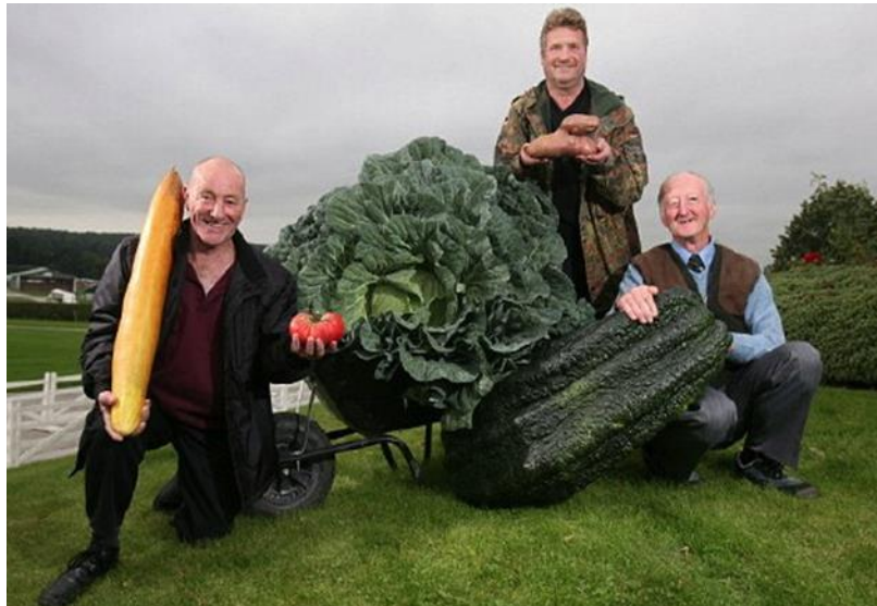
Slika 7. Povrće uzgojeno u vrtovima Findhorna