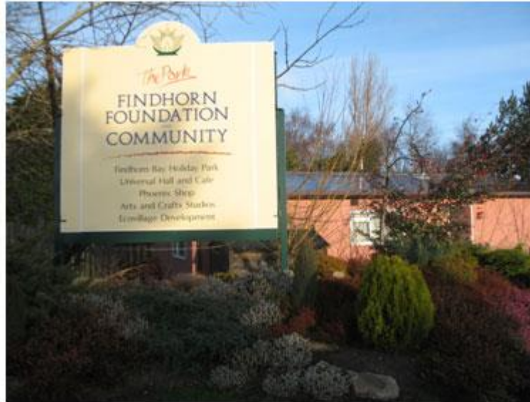
Slika 6. Ulaz u eko selo Findhorn

lokalne, regionalne i nacionalne zajednice koja se sve više okreće održivom razvoju. Kroz slijedeća poglavlja predstaviti ću posebnosti i uspjehe Findhorna kako u održivom razvoju vlastite zajednice, tako i u njihovom nemjerljivom utjecaju na cjelokupni održivi razvoj na planeti.