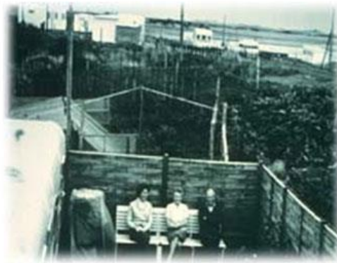
Slika 5. Dorothei Mclean, Eileen i Peter Caddy, osnivači