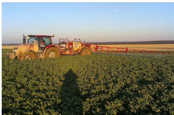
Slika 5. Prskanje usjeva protiv bolesti

Ovisno o godini tj. ekološkim uvjetima pojavljuju se bolesti uljane repice kao što su: koncentrirana pjegavost, suha trulež stabljike, bijela trulež i siva plijesan. Najznačajnija, koja se pojavljuje još tijekom jesen je suha trulež stabljike.