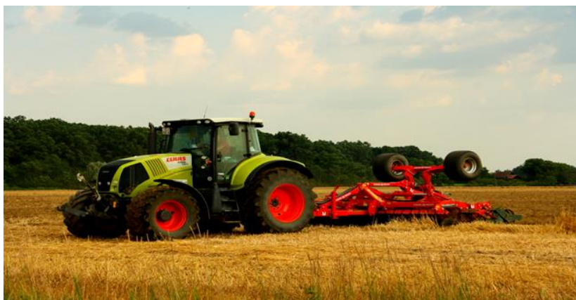
Slika 4. Prašenje strništa s kratkom tanjuračom

dio sjemena će ostati na površini, a dio na mjestima na kojima je bolja priprema, ići će dublje; u oba slučaja može izostati klijanje i nicanje, pa ćemo dobiti prorijeđen sklop (Gagro, 1998.).