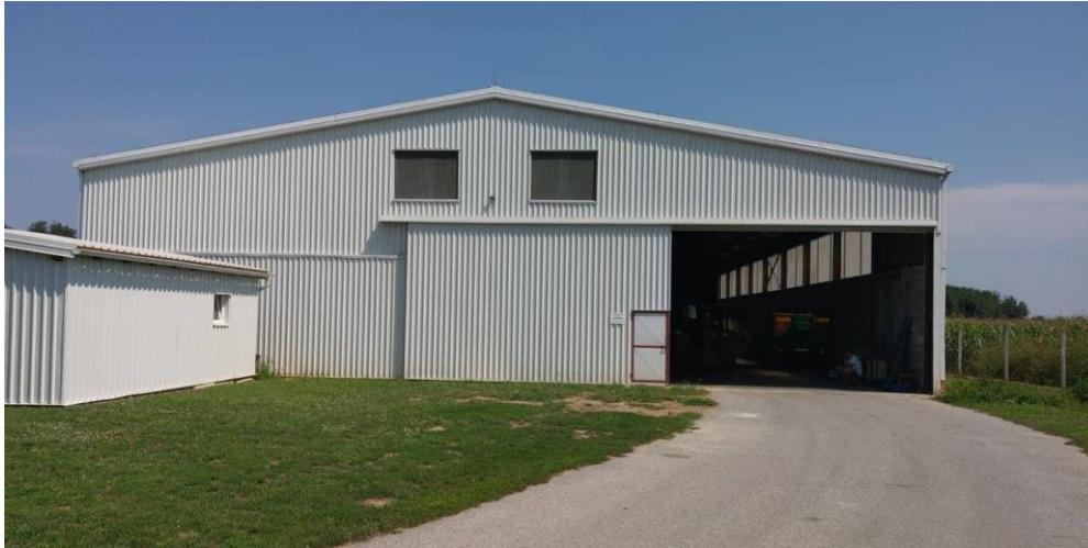
Slika 2. Prostor namijenjen za smještaj mehanizacije i skladištenje ratarskih kultura

OPG Dragan Čolaković osnovano je 2005. godine te trenutno raspolaže sa oko 240 ha obradive površine od kojih je 128 ha u zakupu. Vlasnik raspolaže sa svom potrebnom mehanizacijom te prostorima namijenjenima za smještaj mehanizacije i skladištenje ratarskih kultura.