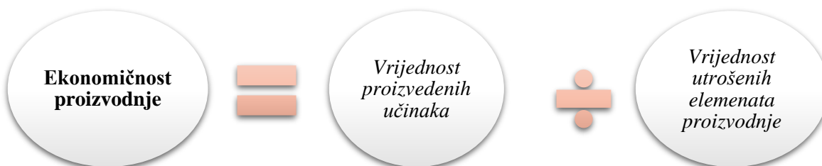
Slika 9. Ekonomičnost proizvodnje

Prema Ranogajec (2009.) ekonomičnost proizvodnje predstavlja izraz učinaka potrošnje svih elemenata proizvodnje i izražava se koeficijentom ekonomičnosti. Koeficijent može biti jednak, manji ili veći od 1. Ekonomičnost se izračunava tako da se vrijednost proizvedenih učinaka podijeli sa vrijednosti utrošenih elemenata proizvodnje, odnosno ukupnim troškovima. Izražava koeficijentom koji se računa prema formuli: