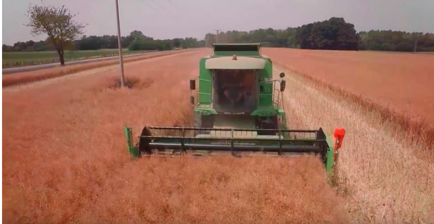
Slika 8. Žetva uljane repice; OPG Dragan Čolaković