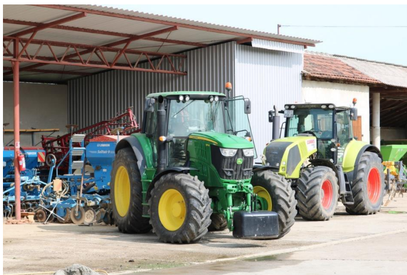
Slika 1. Mehanizacija na OPG-u Dragan Čolaković

Nekoć su se bavili stočarstvom te strpljivo i revno držali krave i bikove, no danas se, s obzirom na stanje u stočarstvu, a i na lokaciju gospodarstva gdje je niža vodoopskrba zbog čega nisu mogli ishoditi dozvolu za izgradnju većeg objekta, bave isključivo ratarstvom, a zahvaljujući tomu, žive od svog rada.