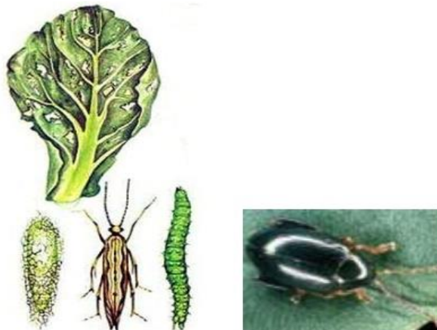
Slika 7. Repičin crvenoglavi buhač