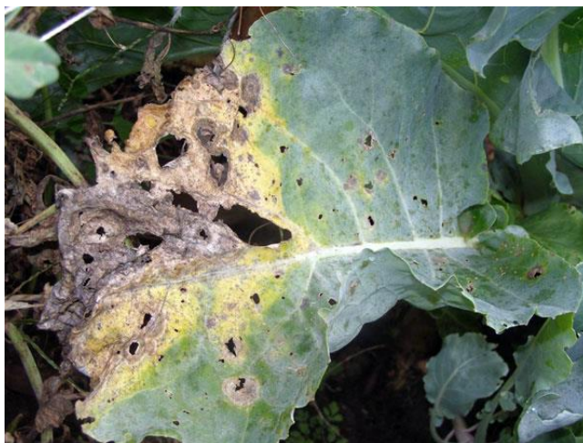
Slika 6. Suha trulež stabljike i vrata na listu

Mjere borbe protiv ove bolesti su pridržavanje plodoreda i izbor otpornih hibrida. Kada su jeseni i proljeća topla i vlažna u usjevu uljane repice može se pojaviti pepelnica. Podložna je i virusnim bolestima kao što su virus mozaika postrne repe i virus mozaika rotkve.