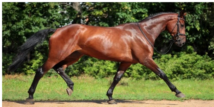
Slika 12. Holstein

Danas se holstein uzgaja u čistoj pasmini, ponekad se koristi kao oplemenjivač, a u Republici Hrvatskoj postoji 111 konja pasmine holstein (HPA, 2017.).