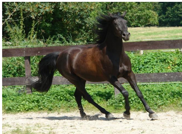
Slika 8. Arapski punokrvnjak

Jedna od najstarijih i najljepših pasmina danas je upravo arapski punokrvnjak, poznat još od prije četiri i pol tisućljeća. Pretpostavlja se da je arapski punokrvnjak zapravo potomak tarpana, iako Witt (citat Ogrizek i Hrasnica, 1952.) objašnjava da su veliki utjecaj na oblikovanje arapskog konja imali turkmenski konji (srednja Azija i Iran). 3 glavne linije dominirale su stoljetnim uzgojem arapskog punokrvnjaka: Kuhaylan (čvršći tip), Saqlavy (profinjeni tip) i Muniqi (tip osobite brzine).