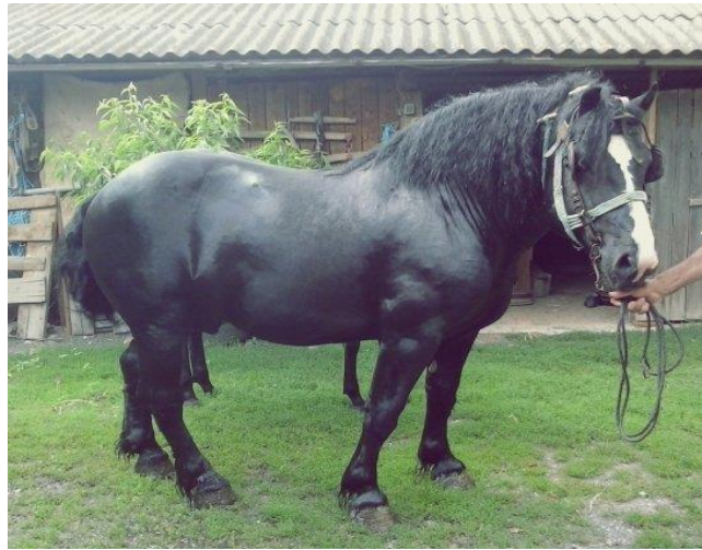
Slika 4. Hrvatski hladnokrvnjak

se smatra da može podići kvalitetu uzgoja, tako da uzgajivači ne mogu samostalno odabrati pastuhe (Uzgojni program hrvatski hladnokrvnjak, 2012.).