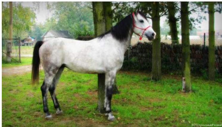
Slika 6. Hrvatski toplokrvnjak

konja plemenitog izgleda i ponosnog držanja, dobrog karaktera te lijepog, pravilnog i srednjeg do velikog okvira. Provedbom programa također teži se brojčanom povećanju populacije i genetskom unaprjeđenju hrvatskog toplokrvnjaka u Hrvatskoj. Unutar općenitog uzgojnog cilja, hrvatski toplokrvnjak uzgaja se u dva uzgojno usmjerena podtipa: podtip preponsko-dresurnog konja (PD) i podtip konja za svestranu upotrebu (SU). Za izgradnju pojedinog podtipa odabiru se roditeljska grla visoke uzgojne i uporabne vrijednosti u pojedinim športskim disciplinama (UUHT, 2012.).