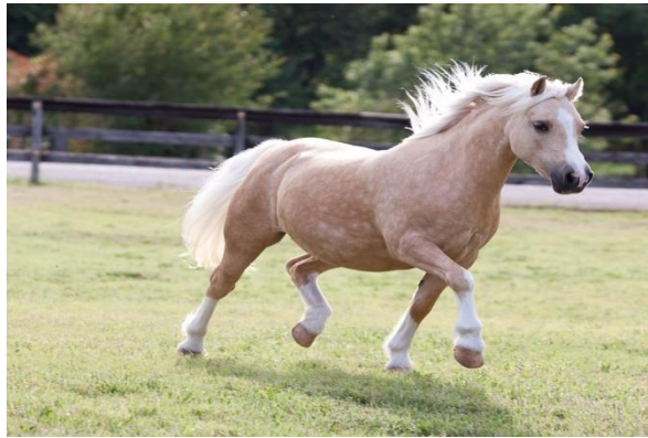
Slika 16. Velški poniji