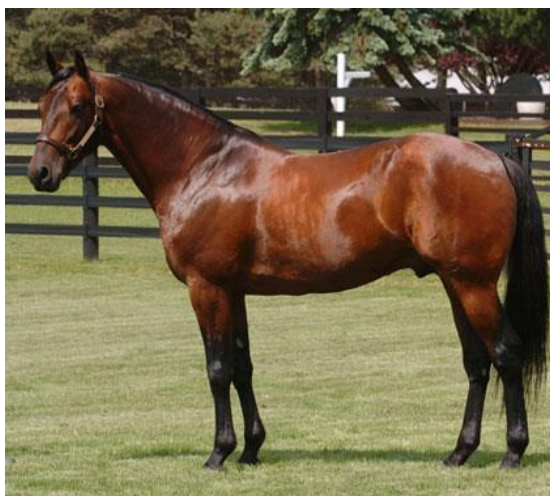
Slika 18. Američki kasač

Sustavni uzgoj američkog kasača započeo je sredinom devetnaestog stoljeća. Kod njegova nastanka koristili su se arapski i engleski punokrvnjak, pacer (kanadski rahvanac) i norfoški kasač. Ivanković (2004.) navodi da je važno za napomenuti kako je 1849. godina važna iz razloga što je tada oždrijebljen pastuh Hambletonian , čiji su sinovi zasnovali deset linija američkog kasača. Od deset, danas su još uvijek u uzgoju samo četiri, a to su Mc Kinney , Bingen , Axworthy i Peter the Great .