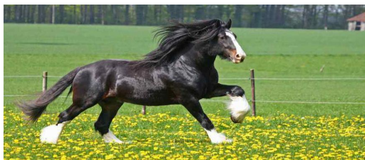
Slika 14. Shire

Kao jedna od najkrupnijih pasmina konja, shire je nastao u Engleskoj kao ratni konj, a u Republici Hrvatskoj danas postoje samo dvije jedinke (HPA, 2017.). Na utvrđivanje pasmine najviše su utjecali frizijski i flandrijski pastusi, koji su se križali s lokalnim kobilama. Danas se uzgaja u čistoj krvi, bez potrebe da se koristi kao oplemenjivač, a uzgojni ciljevi su za konja za vuču ili rad u poljoprivredi.