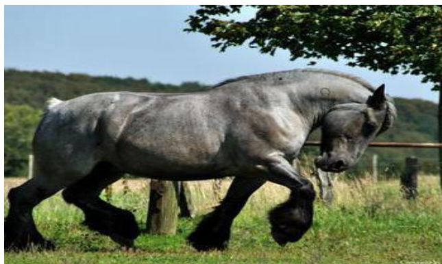
Slika 13. Belgijski hladnokrvnjak