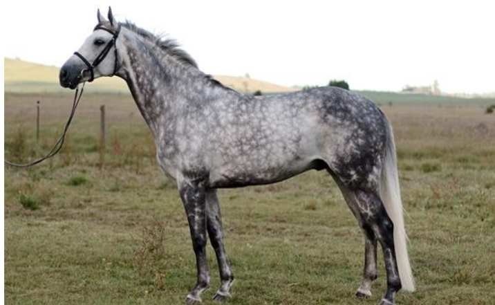
Slika 11. Trakehner

Početak uzgoja trakehnera datira iz prve polovice osamnaestog stoljeća na području Njemačke, osnutkom ergele Trakehnen. Uzgojni cilj bio je stvaranje snažnog konja i dobra temperamenta, koji bi služio u poljoprivredi i sportskim natjecanjima. Nastao je sustavnim uzgojem, koristeći arapskog i engleskog punokrvnjaka te akhaltekinca.