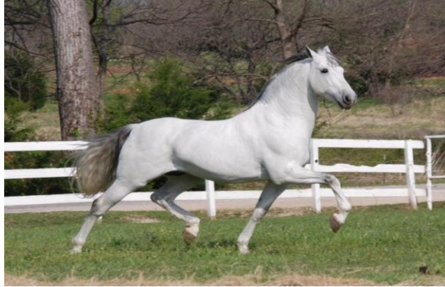
Slika 10. Andaluzijski konj

Danas se uzgaja u čistoj krvi, često se koristi kao oplemenjivač nekih pasmina, a uzgojni ciljevi andaluzijskog konja su dresurna natjecanja i zaprežni sport. U Republici Hrvatskoj postoji svega 7 jedinki andaluzijskog konja (HPA, 2017.).