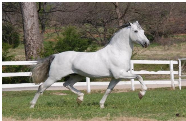
Slika 10. Andaluzijski konj

Danas se uzgaja u čistoj krvi, često se koristi kao oplemenjivač nekih pasmina, a uzgojni ciljevi andaluzijskog konja su dresurna natjecanja i zaprežni sport. U Republici Hrvatskoj postoji svega 7 jedinki andaluzijskog konja (HPA, 2017.).