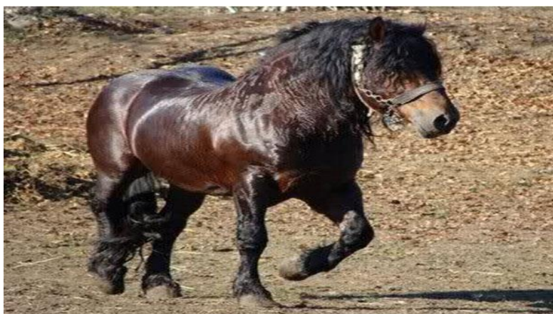
Slika 3. Hrvatski posavac