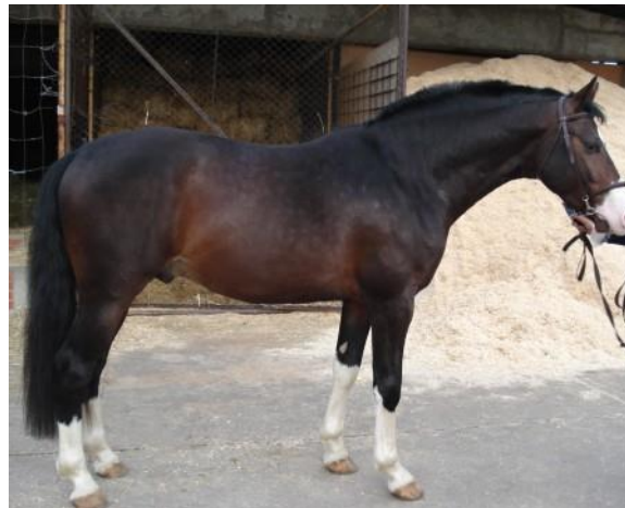
Slika 7. Hrvatski sportski konj

konja, Genetske baze hrvatskog sportskog konja tako čine roditeljski parovi iz vlastitog uzgoja (30%), njemačkog sportskog konja (31%) i holstein pasmine (22%) (HUUSK, 2013.). Konji koji su se koristili kao rasplodna grla su pastusi porijekla poznatih sportskih pasmina, pa je hrvatski sportski konj nastao od uzgojnih tipova sportskih konja, toplokrvnih sportskih pasmina te grla konja koja imaju izvrsnu kvalitetu.