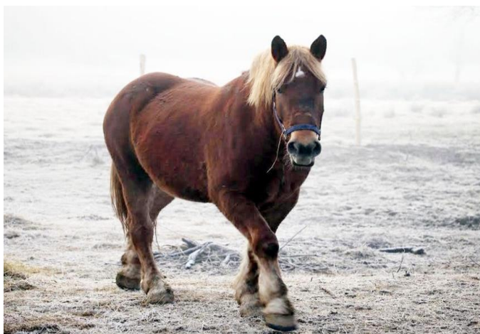
Slika 5. Međimurski konj