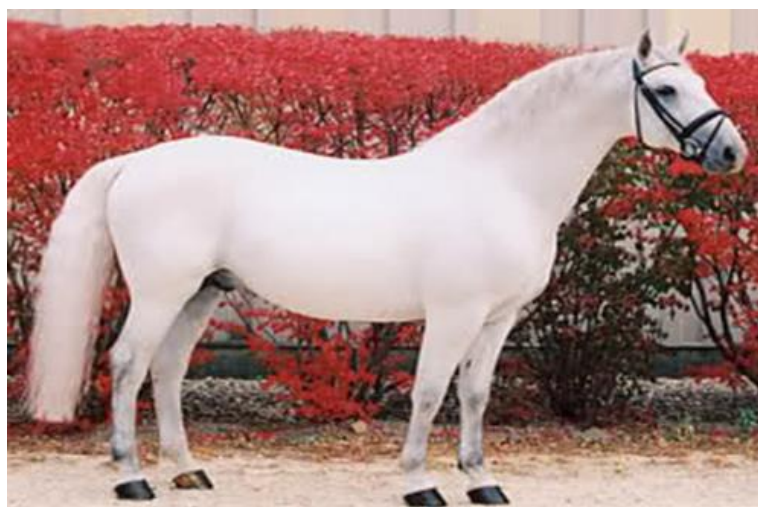
Slika 2. Lipicanac

Uzgoj lipicanske pasmine započeo je 1580. godine kada je osnovana ergela za uzgoj konja za gospodarske i vojne zahtjeve u Lipici (mjestu po kojemu su lipicanci dobili svoje ime). Ciljani uzor za uzgoj lipicanske pasmine bio je barokni španjolski konj.