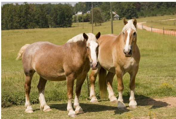
Slika 15. Persheron

Persheron je podrijetlom iz jugozapadne Francuske, a danas se uzgaja po cijelom svijetu. Vrlo rano, križan je s arapskim punokrvnjacima, no ne zna se kako je persheron zapravo nastao. Kasnije su se orijentalni konji Francuske križali sa španjolskim konjima. Također, jedna od teorija je da je persheron u srodstvu s boulonnais pasminom. Sve u svemu, persheron ima bogatu povijest križanja, koja su pasminu doveli do današnjih rezultata.