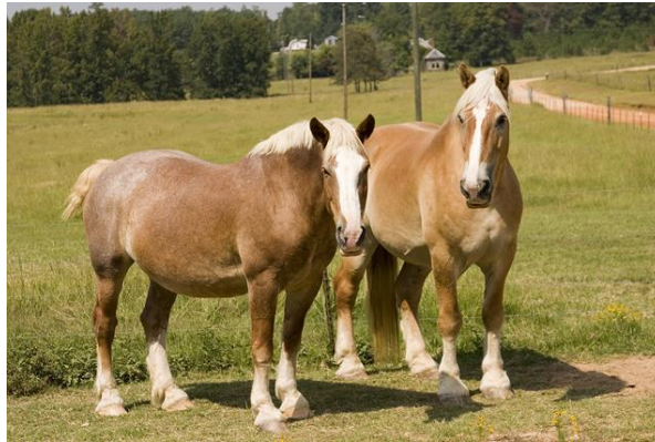
Slika 15. Persheron

Persheron je podrijetlom iz jugozapadne Francuske, a danas se uzgaja po cijelom svijetu. Vrlo rano, križan je s arapskim punokrvnjacima, no ne zna se kako je persheron zapravo nastao. Kasnije su se orijentalni konji Francuske križali sa španjolskim konjima. Također, jedna od teorija je da je persheron u srodstvu s boulonnais pasminom. Sve u svemu, persheron ima bogatu povijest križanja, koja su pasminu doveli do današnjih rezultata.