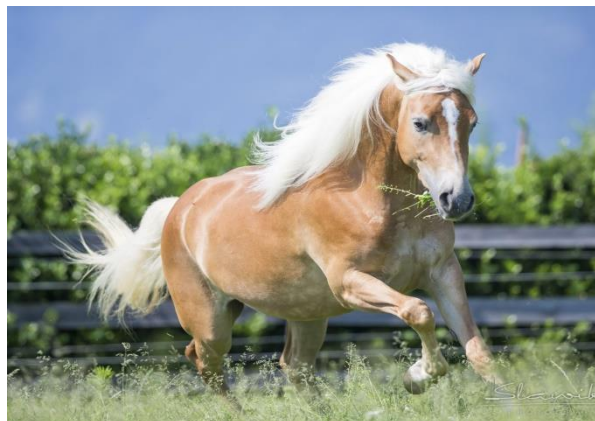
Slika 17. Haflinger

Preci haflingera datiraju još iz vremena Rimskog carstva kao snažni i otporni mali konji. Kasnije se su oni počeli planski oplemenjivati prvenstveno orijentalnim pastusima. Jedan od glavnih rodonačelnika današnjih linija haflingera bio je arapski pastuh Folie , 1874. U današnje vrijeme uzgaja se u čistoj krvi i ne koristi se kao oplemenjivač, a u Republici Hrvatskoj postoji 140 jedinki (HPA, 2017.). Ipak, može se koristiti u uporabnom križanju, ukoliko je to potrebno, sukladno s pravilnikom o uzgoju za pojedinu pasminu.