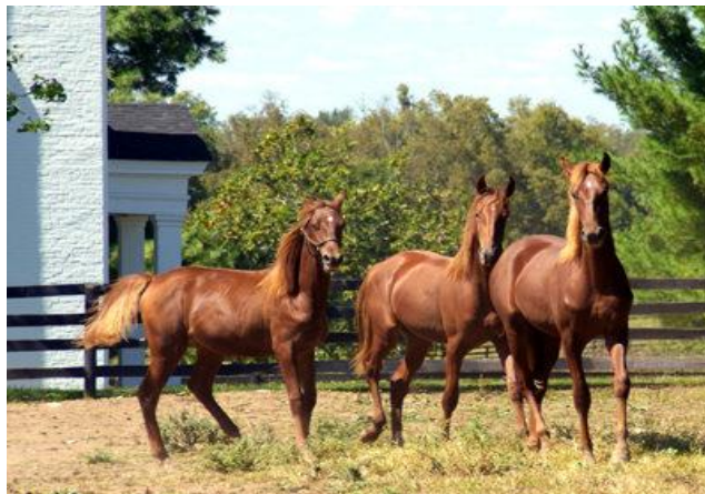
Slika 9. Engleski punokrvnjaci

U osamnaestom stoljeću u Yorkshireu počelo je plansko oplemenjivanje lokalnih engleskih kobila orijentalnim pastusima. Englezi su željeli zadržati postojeći okvir konja, ali popraviti gracioznost i brzinu. Tako je engleski punokrvnjak zasnovan na 3 arapska pastuha ( Byerley Turk , 1689.; Darley Arabian , 1705.; Godolphin Barb , 1728.) i pedesetak izabranih lokalnih kobila, što je rezultiralo trima linijama engleskog punokrvnjaka: Herod , Eclipse i Matchem (Ivanković, 2004.).