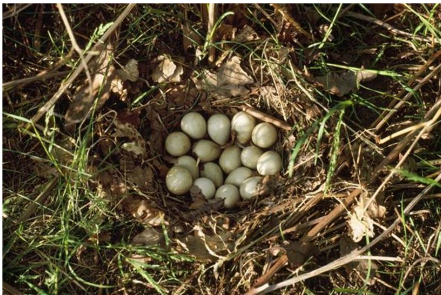
Slika 7. Jaja trčke skvržulje u gnijezdu

je u svibnju i lipnju. Mladi se nazivaju potrkusi i nakon što se osuše mogu odmah slijediti majku, dok cijelo jato predvodi mužjak. Plodnost i nosivost trčki opada sa starošću, kao i kod velikog broja ostalih divljih koka i domaće peradi. Stoga bi u lovištu trebalo biti što više mladih trčki, u tom slučaju priplod je veći. Jaja su kruškolikog oblika, maslinasto zelene boje, te imaju finu zrnastu površinu i blago voštani sjaj.