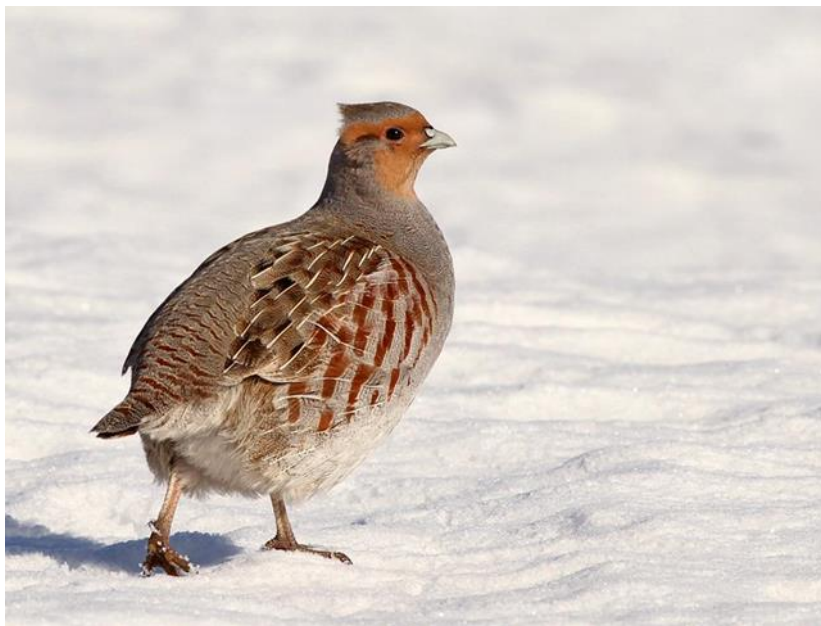
Slika 3. Trčka skvržulja na snijegu