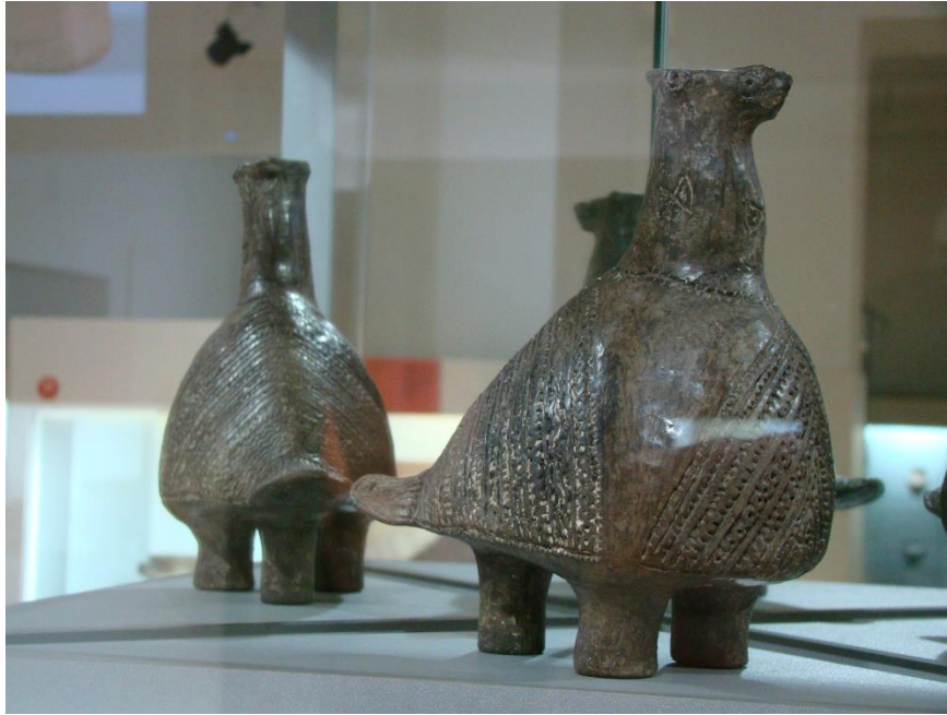
Slika 1. Vučedolska golubica u Arheološkom muzeju u Zagrebu