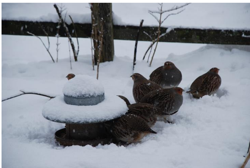
Slika 8. Hranilište za trčke tijekom zime

Pored izlaganja same hrane, mora se voditi računa, da na hranilištu ima čiste pitke vode, dok se ne smrzava, krupnozrnog pijeska i sitnih kamenčića, bez čega nema pravilne probave.