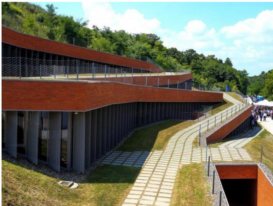
Slika 2. Muzej vučedolske kulture