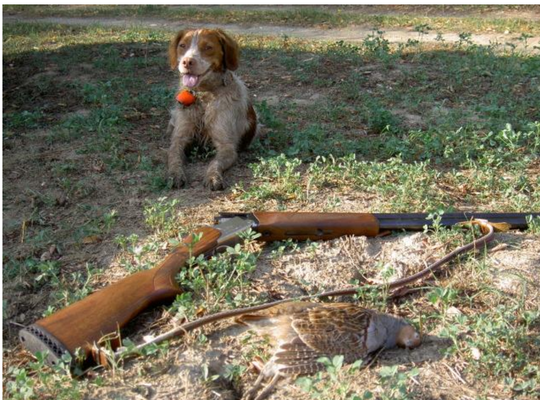
Slika 10. Uspješan lov na trčku skvržulju

Lov prigonom na trčke manje se upotrebljava i to baš zbog opasnosti od nesreća. Tako se lovi tek onda, kad trčke postanu već toliko oprezne, da se dižu na velikoj udaljenosti ispred lovaca ili kad se u lovištu izmjenjuju polja s niskim šikarama. Lovci se rasporede i zatvore veću površinu daleko ispred pogoniča, koji se polako kreću prema njima. Pogoniči moraju ići polako, stalno poravnani i ne smiju istrčavati jedan pred drugoga. U lovu prigonom zahtijeva se najveća opreznost lovaca, kako bi se izbjegla svaka mogućnost nesretnih slučajeva. Najvažnije je, da svaki lovac u svakom trenutku zna, gdje mu se nalazi susjedni lovac s lijeve i desne strane. Lovci u lovu prigonom ne smiju gađati trčke, koje lete na njih ispred pogoniča, kao ni na jata, koja lete u smjeru ostalih lovaca.