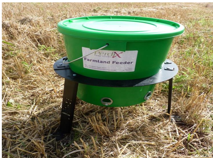
Slika 9. Hranilište „Perdix Farmland Bird Feeder“