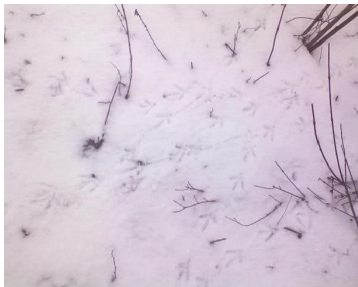
Slika 6. Tragovi trčke na snijegu

Otisak noge (trag) odrasle trčke sličan je otisku noge fazana i domaće kokoši, samo je manji. Veličina traga je oko 5 cm. Trčka stavlja u hodu jednu nogu ispred druge, tako da ostavlja trag u jednoj liniji.