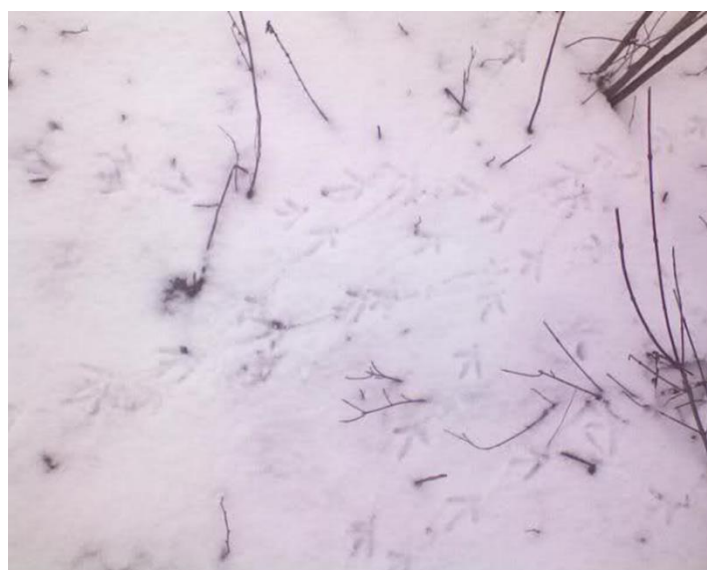
Slika 6. Tragovi trčke na snijegu

Otisak noge (trag) odrasle trčke sličan je otisku noge fazana i domaće kokoši, samo je manji. Veličina traga je oko 5 cm. Trčka stavlja u hodu jednu nogu ispred druge, tako da ostavlja trag u jednoj liniji.