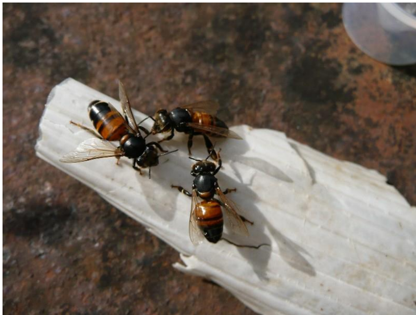
Slika 4. Kronična pčelinja paraliza

Virus kronične paralize je nejednake dužine i širine. Razmnožava se u različitim tkivima pčela. Znatni broj virusnih čestica utvrđen je u živčanom sustavu, u glavi pčele i u mednom mjehuru. Bolest se javlja tijekom jake nektarne paše, u košnicama smještenim na jakom suncu, uz malo leto i slabo prozračivanje. Na pojavu bolesti utječu i nasljedne osobine.