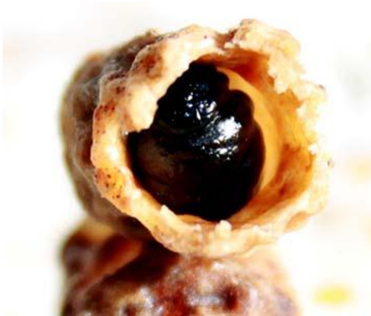
Slika 3. Virus crnih matičnjaka

Virus crnih matičnjaka može se izolirati iz pčela sakupljačica koje su bolesne od nozemoze. Rezultati istraživanja pokazuju da je umnažanje tog virusa usko povezano s razvojem nozemoze. Zaražene kukuljice matice ugibaju, a stjenke matičnjaka postaju tamnosmeđe ili crne boje. U početku bolesti kukuljice postaju blijedožute boje, a između kožice i tijela nakuplja se tekućina. Iz uginulih kukuljica može se izdvojiti velika količina virusa.