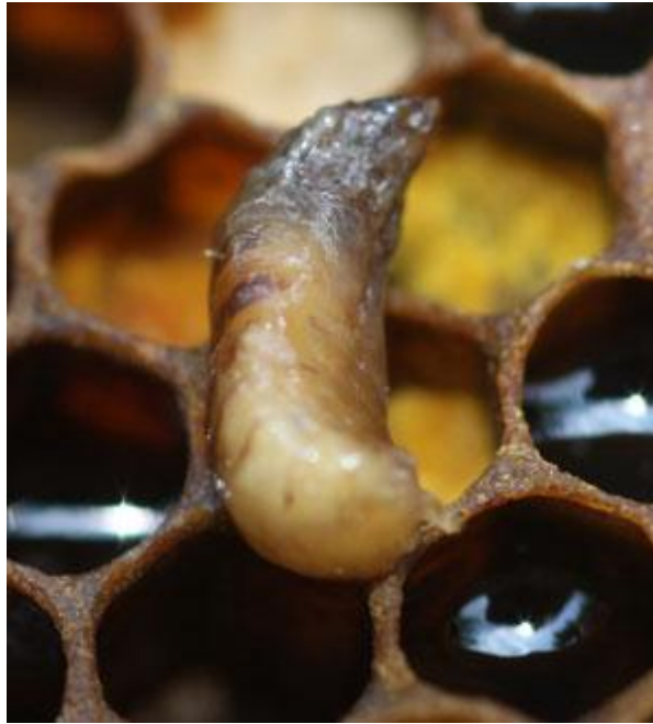
Slika 1. Mješinasto leglo

Pojava mješinastog legla smanji se u kasno proljeće kada počne intenzivan unos nektara, ali ako simptomi ustraju, preporuča se zamjena matice s mladom maticom.