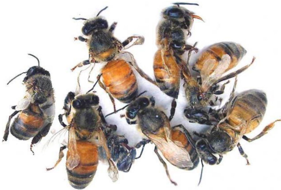
Slika 2. Virus deformiranih krila

Zimska smrtnost zajednice je jako povezana s prisutnosti virusa deformiranih krila, neovisno o invadiriranosti varoozom. To nam govori da bi se najezda grinje trebala smanjiti u naprednoj zajednici stvarajući zimske pčele da bi osigurale smanjenje titara.