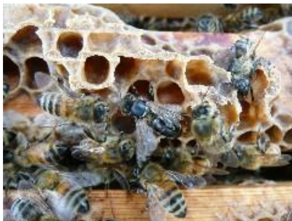
Slika 5. Crna pčela zaražena virusom akutne pčelinje paralize

Akutna pčelinja paraliza virusna je bolest mladih pčela radilica u pčelinjim zajednicama napadnutih grinjom Varroa destructor . Bolest nastupa u doba najjačeg razvoja pčelinjih zajednica. Nagla pojava bolesti tumači se aktiviranjem virusa prilikom uboda grinja koje sišu hemolimfu, što dovodi do naglog umnažanja virusa u hemolimfi, te dolazi do uginuća zaražene pčele.