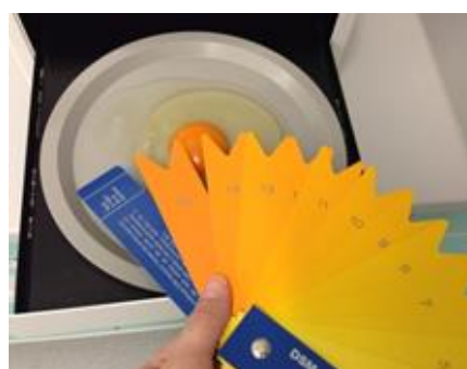
Slika 8. Određivanje boje žumanjka