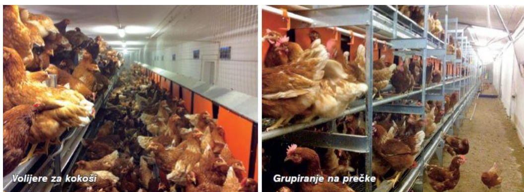
Slika 3. Izgled volijere (avijarija) koji predstavlja etažni sistem držanja nesilica u štali