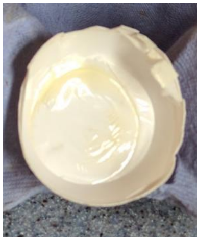
Slika 5. Izgled zračne komorice jaja starog 20 dana

Kod unutarnjih osobina jaja važno je spomenuti visinu zračne komorice, koja je najčešći pokazatelj svježine odnosno starosti jaja (Slika 5.). Visina zračne komorice se određuje prosvjetljavanjem (ovoskopiranjem) jajeta, s jedne strane, u tamnom prostoru. Odmah nakon nesenja visina zračne komorice (koja se nalazi na tupom kraju jajeta) nije veća od 3 mm, a promjer joj iznosi 0,5-1,0 cm. Svakoga dana poslije nesenja, visina zračne komorice prosječno se povećava za oko 0,32 mm. Indeks žumanjka je omjer njegove visine i promjera. Ovisan je o pasmini (genotipu), dobi kokoši i načinu skladištenja jaja, dok hranidba nema utjecaja. Indeks žumanjka promjenjiv je, od 32 do 52%. Žumanjak starenjem dobiva plosnati oblik, a indeks mu iznosi oko 0,25 (25%). Indeks bjelanjka je omjer njegove visine i promjera ili visine i površine razlijevanja. Vrijednosti pH bjelanjka i žumanjka mjere se uz pomoć pH metra.