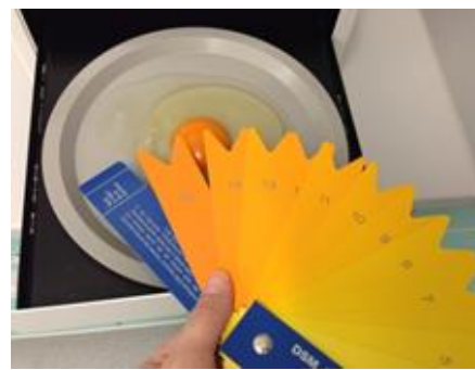
Slika 8. Određivanje boje žumanjka