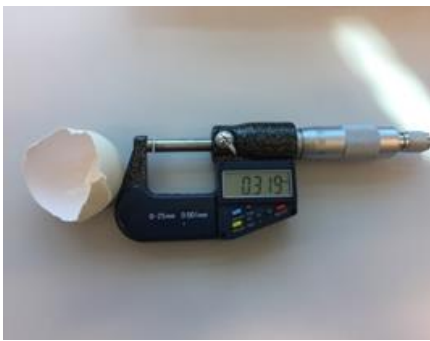
Slika 7. Određivanje debljine ljuske

od 0,001 mm na sredini ljuske jaja (slika 7). Indeks oblika izračunat je iz mjera širine i dužine jaja prema slijedećem obrascu: indeks oblika (%)=širina jajeta/dužina jajeta*100 (Panda, 1996.). Boja žumanjka, Haugh jedinice (HJ) i visina bjelanjka utvrđeni su automatskim uređajem Egg Multi-Tester EMT-5200. Vrijednosti pH bjelanjka i žumanjka, izmjerene su pH metrom MP 120. Rezultati istraživanja obrađeni su uz pomoć programa Statistica for Windows version 13.0 (StatSoft Inc., 2017.). Rezultati su obrađeni pomoću analize varijance (ANOVA). Ukoliko je P vrijednost bila statistički značajna razlike između skupina testirane su Fisherovim LSD testom.