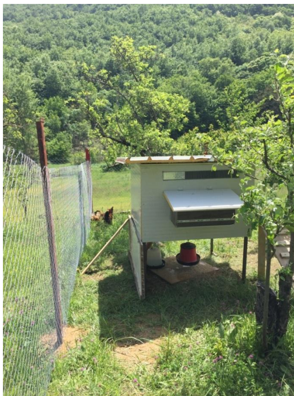
Slika 2. Slobodni „free range“ sustav držanja nesilica za proizvodnju konzumnih jaja