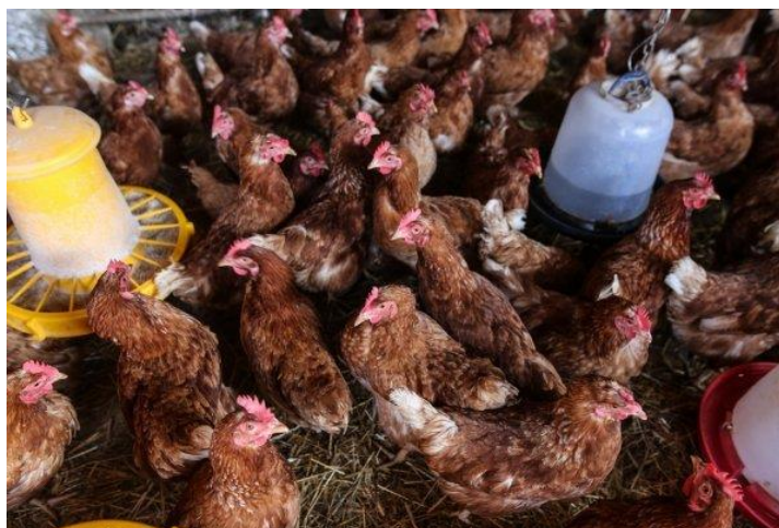
Slika 4. Podni sustav držanja kokoši nesilica na dubokoj stelji

Držanje nesilica na rešetkastom podu podrazumijeva držanje peradi isključivo na rešetki. Prema zahtjevu EC Direktive 1999/74/EG, gustoća naseljenosti peradarnika ne smije biti veća od 9 kokoši/m 2 iskoristive površine. Konstrukcija poda mora biti izvedena na takav način da podržava smjer prednjih noktiju noge, a nagib poda ne smije prijeći 14% ili 8°. Na 120 kokoši potrebno je osigurati 1 m 2 grupnog gnijezda ili 7 kokoši na jedno individualno gnijezdo. Grupna gnijezda su sa sustavom za izbacivanje jaja i to u obliku podiznog poda gnijezda. Neposredna blizina trake za skupljanje jaja i blagi unutrašnji nagib osigurava minimalni udio jaja s oštećenom ljuskom (zaprljanom od fecesa ili razbijenom). Svako preostalo jaje automatski prelazi na traku zbog „podijeljenog“ poda prije nego što se gnijezdo zatvori zbog čega nema opasnosti od kljucanja jaja. Na taj način je minimalan udio prljavih jaja jer tijekom noći dolazi do podizanja poda radi zatvaranja gnijezda i tako se osigurava da gnijezda ostaju čista tijekom proizvodnje.