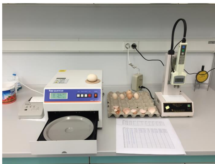
Slika 9. Mjerenje kvalitete jaja