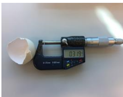
Slika 7. Određivanje debljine ljuske

od 0,001 mm na sredini ljuske jaja (slika 7). Indeks oblika izračunat je iz mjera širine i dužine jaja prema slijedećem obrascu: indeks oblika (%)=širina jajeta/dužina jajeta*100 (Panda, 1996.). Boja žumanjka, Haugh jedinice (HJ) i visina bjelanjka utvrđeni su automatskim uređajem Egg Multi-Tester EMT-5200. Vrijednosti pH bjelanjka i žumanjka, izmjerene su pH metrom MP 120. Rezultati istraživanja obrađeni su uz pomoć programa Statistica for Windows version 13.0 (StatSoft Inc., 2017.). Rezultati su obrađeni pomoću analize varijance (ANOVA). Ukoliko je P vrijednost bila statistički značajna razlike između skupina testirane su Fisherovim LSD testom.