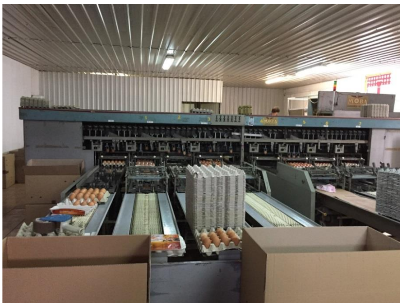
Slika 6. Izgled sortirnice i pakirnice za konzumna jaja na farmi Marijančanka

vrijeme prijevoza ili u skladištu trgovine na malo (u slučaju da zaliha ne prelazi količinu koja će se prodati u roku od tri dana), neće se smatrati hlađenim jajima. Ako su jaja hlađena iz nekog razloga, moraju se označiti s „hlađena jaja“ i ne smiju se označavati kao „A“ klasa (čak i ako ispunjavaju ostale uvjete te klase). Jajima „B“ klase smatraju se sva ona jaja koja ne ispunjavaju uvjete za „A“ klasu jaja. Na sortirnom uređaju (Slika 6.), uz pomoć kružnog transportera, jaja se prebacuju na pojedinačne vagice, gdje se svako jaje važe te prema masi odvaja u odgovarajuće odjeljke. Postoji 4 odjeljka za 4 razreda jaja prema masi i to: XL jaja mase preko 73 g; L jaja mase od 63g do 73g; M jaja čija se mase kreće od 53g do 63g i jaja S razreda mase manje od 53 g.