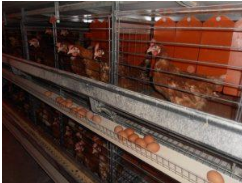
Slika 1. Konvencionalna proizvodnja jaja u obogaćenim kavezima

koji imaju instalirane takve sustave. Naime, do ulaska Republike Hrvatske u Europsku Uniju dozvoljeno je držanje kokoši nesilica u klasičnim kavezima do završetka proizvodnog ciklusa. Slijedeći ciklus proizvodnje morati će se odvijati u obogaćenim kavezima ili pak u alternativnim sustavima držanja. Svi proizvođači koji grade nove objekte za proizvodnju konzumnih jaja moraju se tome prilagoditi.