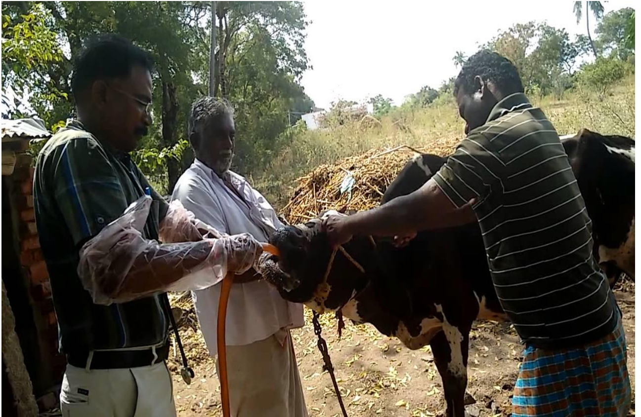
Slika 10. Guranje cijevi kravi kroz usta da bi se pomakao predmet i završio u buragu

Veliki predmeti također cjevčicom mogu biti ugurani u burag radi prestanka gušenja i lakšeg uklanjanja predmeta.