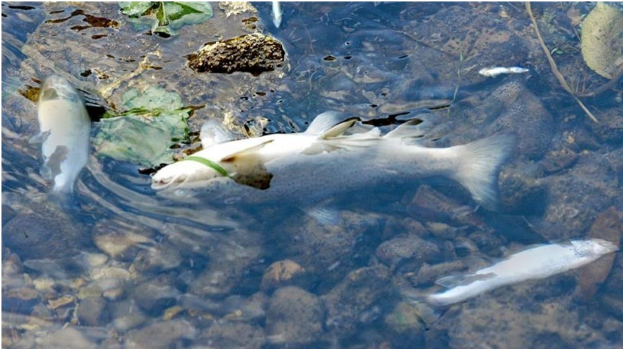
Slika 11. Zijev riba ili asfiksija