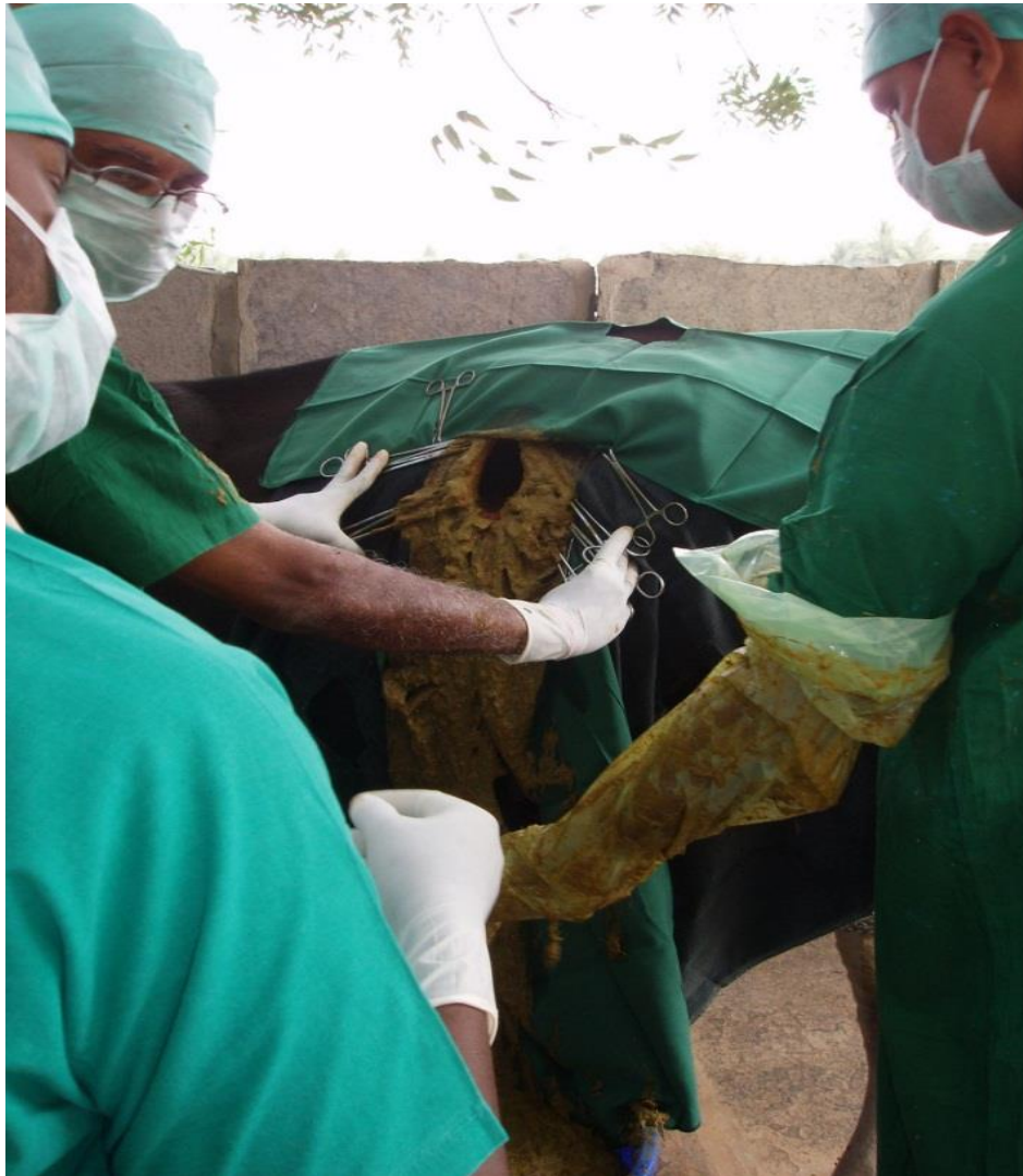
Slika 3. Ruminotomija