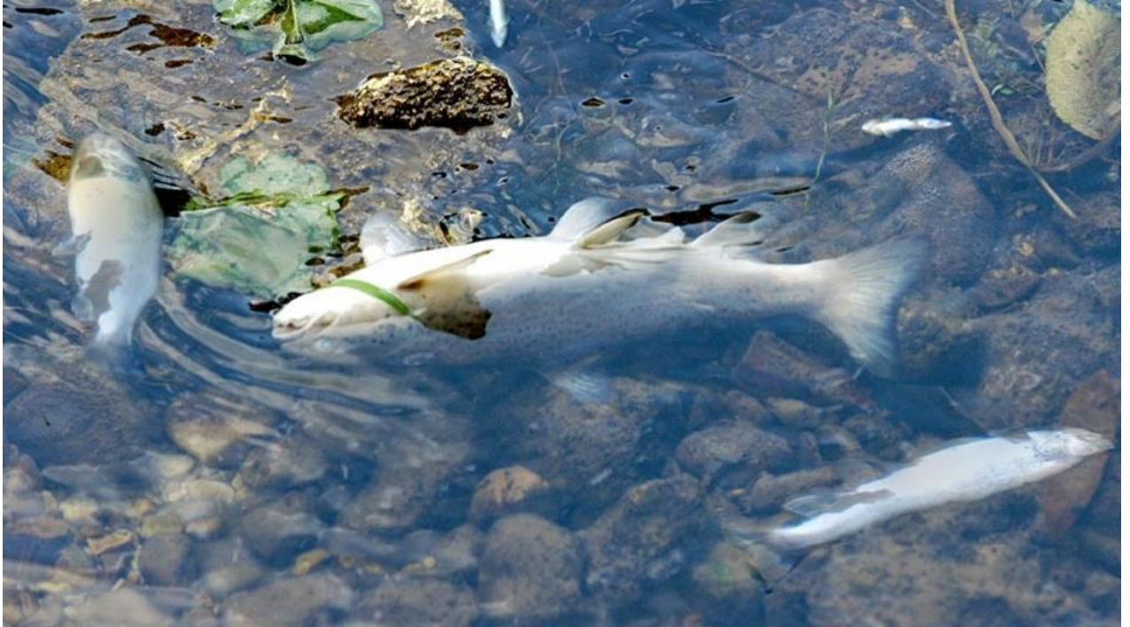
Slika 11. Zijev riba ili asfiksija