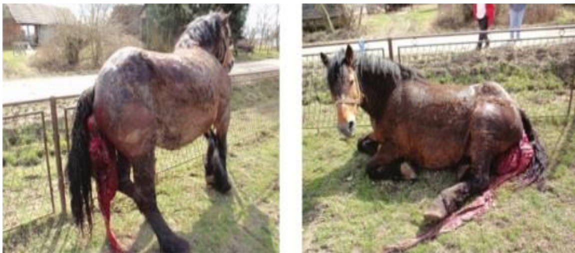
Slika 2. Kobila s izvalom maternice, stojeći i ležeći položaj