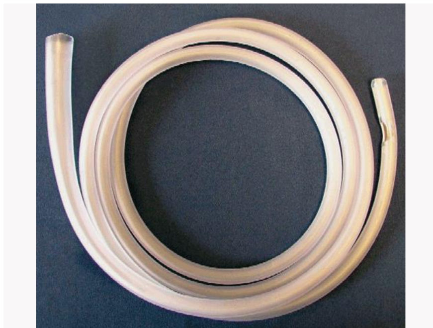
Slika 5. Izgled sonde

Kod ovaca troakar postavlja u sjedećem položaju životinje, između nogu pomagača, i zatim se stišće abdomen s obje strane, a masažom i sondiranjem se odstranjuju plinovi.