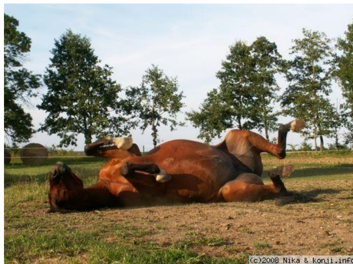
Slika 1. Način na koji se očituje kolike kod konja - konj se postavlja u položaj psa da bi se pokušao osloboditi bola i "uklonio si teret s trbuha"

Profilaktička mjera bi bila paziti svakako na prehranu, na brzinu uzimanja hrane i samu kvalitetu hrane, na nagle izmjene temperature i tlaka, izbjegavati propuh i vlagu, održavati higijenski mjesto boravka i kretanja konja, te pripaziti da bolovi nisu uzrokovani nekim patološkim promjenama u probavnom sustavu.