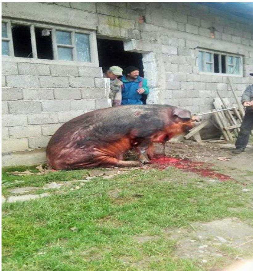
Slika 7. Namjerno uzrokovano arterijskog krvarenja kod svinje tijekom svinjokolje

Arterijsko krvarenje, koje pripada vanjskom krvarenju, je iznimno opasno jer životinja gubi velike količine krvi velikom brzinom, krv koja izlazi je svjetlije boja i izlazi van u velikim mlazovima.