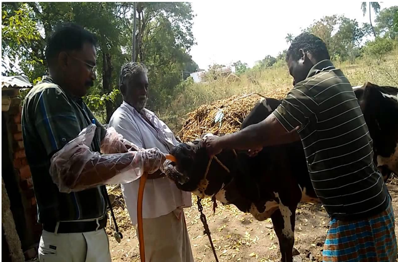
Slika 10. Guranje cijevi kravi kroz usta da bi se pomakao predmet i završio u buragu

Veliki predmeti također cjevčicom mogu biti ugurani u burag radi prestanka gušenja i lakšeg uklanjanja predmeta.