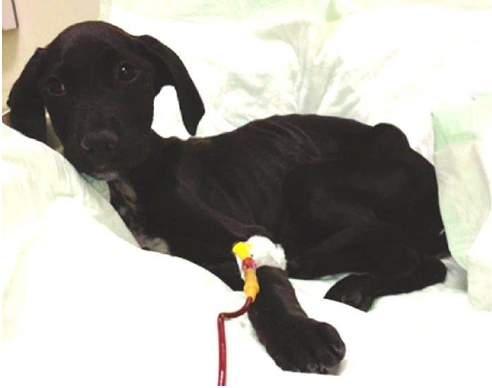
Slika 6. Pas koji prima transfuziju krvi

(Izvor: Petak i sur. 2015.; http://veterina.com.hr/?p=42697 )