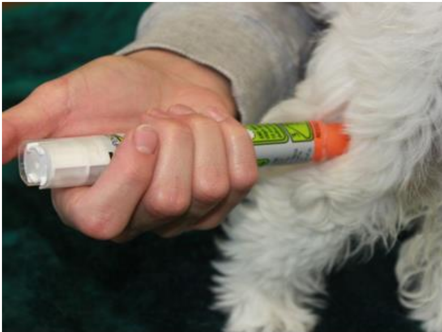
Slika 12. Aplikacija adrenalina

Kod anafilaktičkog šoka, koji je dosta burna reakcija imunološkog sustava na alergen, daje se injekcija adrenalina, ali samo u takvim opasnim situacijama gdje postoji velika vjerojatnost da će životinja uginuti. Kod blažih alergijskih reakcija adrenalin injekcija se ne daje životinjama.