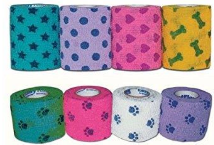
Slika 8. Kompresivni zavoj za životinje

Ukoliko se radi o krvarenju iz arterije, čvor mora biti iznad rane, a ukoliko se radi o venoznom, čvor mora biti ispod nje.