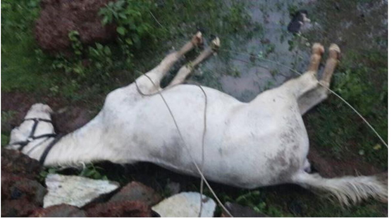
Slika 13. Konj koji je uginuo od posljedice strujnog udara