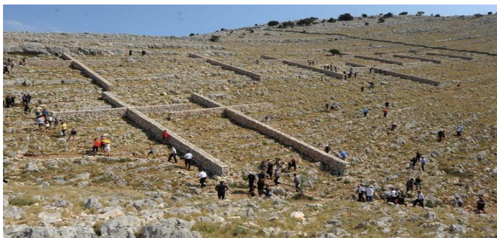
Slika 7. Kornatska tragedija

Privedeno je osam ljudi osumnjičenih za podmetanje požara, a za požar je okrivljen 20-godišnji recepcionar u NP Kornati, koji je navodno opuškom cigarete izazvao požar.