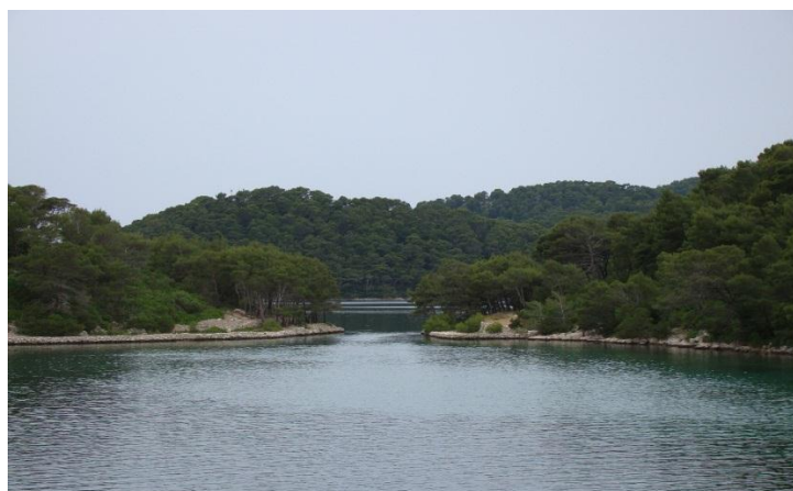
Slika 6. Nacionalni park Mljet

Autohtone šume hrasta crnike i šume alepskog bora prekrivaju više od 90% površine Parka, dajući mu posebnu biološku i estetsku vrijednost. Bogatu otočnu floru i faunu, uz mnoge sredozemne vrste, karakterizira i značajan broj endema Hrvatskog primorja, kao i različiti mljetski stenoendemi. (Palković i sur., 2005.) Obilježja su Parka i dva slana jezera Veliko i Malo jezero, povezana međusobno uskim prolazom a i s otvorenim morem, što svjedoče o negdašnjim krškim poljima, potopljenim poniranjem zapadnog dijela otoka u prijašnjim geološkim razdobljima. U sklopu Nacionalnog parka su mnogi kulturno-povijesni spomenici, među kojima su ostaci iz vremena Rimljana kasnoantičke građevine, monumentalni benediktinski Samostan sv. Marije na otoku na Velikom jezeru iz 12.stoljeća, dvor predstavnika dubrovačke republike te brojne stare crkvice i njihove ruševine iz 10., 12., 16., i 17.stoljeća. (Vidaković, 2003.)