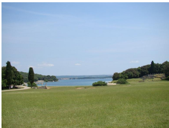
Slika 8. Nacionalni park Brijuni

Nacionalni park Brijuni (Slika 8) obuhvaća otočnu skupinu od 14 otoka i otočića, među kojima su dva veća, Veliki Brijun (690 ha) i Mali Brijun (170ha), a 12 je manjih. Ukupna je površina svih 14 otoka oko otprilike 1000 ha, a obala im je duga pedesetak kilometara (Slika 9). Brijunsko otočje smješteno je ispred zapadne obale Istre, od koje je odijeljeno Fažanskim kanalom širokim oko 2 km. Udaljeno je od Pule desetak kilometara, a ističe se posebnim klimatskim, pejzažnim i kulturno - povijesnim osobitostima. (Palković i sur., 2005.)