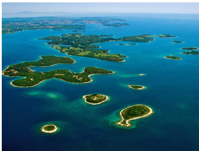
Slika 9. Brijuni

čine skladnu cjelinu sa šumskom i travnjačkom vegetacijom. Na Brijunima su očuvani brojni kulturno-povijesni spomenici. Rimsko je doba ostavilo dubok trag, a materijalna su svjedočanstva ostaci nekoliko dvoraca i drugih objekata iz 1. stoljeća