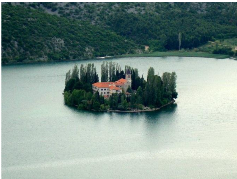
Slika 12. Otočić Visovac

Rijeku Krku ubrajamo među najvrednije i najprivlačnije u Hrvatskoj. Krka je osobita i zbog svoje jedinstvene biocenoze i stvaranje sedre. Bogata je i raznovrsnom florom i faunom. Krka je prije bila zaštićeni prirodni objekt, „značajan krajolik“ ali je, zbog sve većeg pritiska da je se iskoristi u hidroenergetske svrhe bilo nužno poduzeti odgovarajuće mjere zaštite da bi dobila status Nacionalnog parka. Posebnu pejzažnu draž ovom prostoru daje otočić Visovac s crkvom i samostanom (Slika 12)