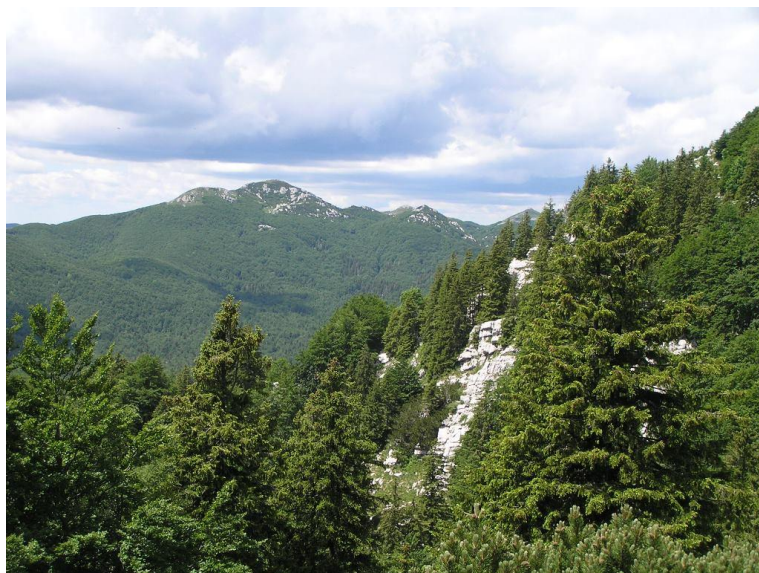
Slika 5. Nacionalni park Risnjak.

Šumoviti gorski masiv dobio je naziv po svom najpopularnijem stanovniku, risu. Zbog čvorišnog položaja na prijelazu iz Alpa u Dinaride te iz Sredozemlja u Panoniju na razmjerno malom prostoru okupljeni su glavni tipovi goranskih šuma s osebujnim visinskim rasporedom, prašumski predjeli, netaknuti planinski vrhovi, sačuvane gorske livade, dinarski krš specifične hidrografije i oblika (Slika 5). Park se nalazi u zaleđu grada Rijeke i Kvarnerskog priobalja, na sjeverozapadnom djelu Gorskog kotara. Pored planinskih masiva Risnjaka i Snježnika obuhvaća i hidrološki zaštićeni spomenik prirode – izvor rijeke Kupe s njenim gornjim tokom. Područje je proglašeno zaštićenim 12. prosinca 1963. godine u površini od 10 ha. Izvor rijeke Kupe, jedna je od mnogih još uvijek neriješenih zagonetki krša, jedno od najjačih i najdubljih hrvatskih vrela. Na nadmorskoj visini od 321 m, vodena je masa oblikovala tirkizno jezero zeleno - plave boje. (Palković i sur., 2005.). Bogati životinjski svijet ovoga nacionalnog parka osim „zaštitnika” risa čine i smeđi medvjed, kuna i puh. Najviša točka je vrh Veliki Risnjak sa 1528 m (Izvor: http://croatia.hr/hr-HR/Otkrij-Hrvatsku/Priroda/Nacionalni-parkovi/Nacionalni-park/Risnjak-?ZHNCNjAwLHBcMTYz ).