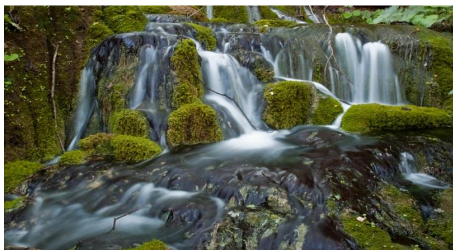
Slika 2. Sedrene barijere na Plitvičkim jezerima