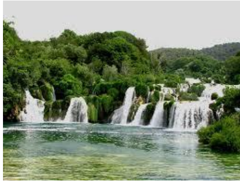
Slika 11. Skradinski buk