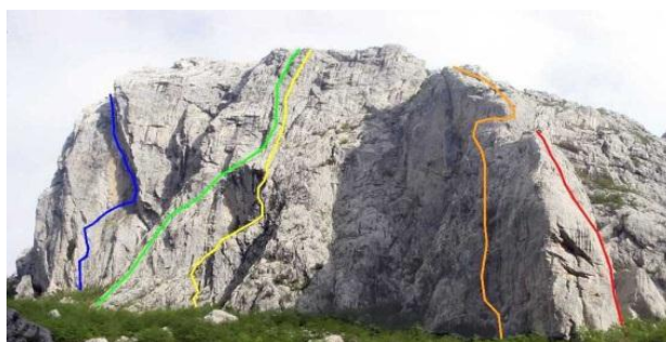
Slika 4. Anića kuk

Paklenica je i poznato europsko penjačko središte. Penjalište se nalazi na samom ulazu u kanjon Velike paklenice gdje se stijene uzdižu i do 400m visine. Penjalište raspolaže s gotovo 400 penjačkih smjerova različitih težina i dužina, a najpoznatiji je Anića kuk (Slika 4). Sezona penjanja traje od ranog proljeća do kasne jeseni. Sve ljepote Paklenice moguće je doživjeti jedino pješaćenjem, a upravo tome služi 150 km uređenih pješććkih staza i putova. Posebnu draž ovom prostoru daje blizina obale koja omogućuje jedinstven doživljaj svih čari planine i mora na jednom mjestu.(Izvor: http://www.rivijera-paklenica.hr/paklenica )