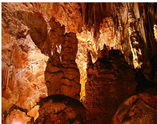
Slika 3. Manita peć u Nacionalnom parku Paklenica