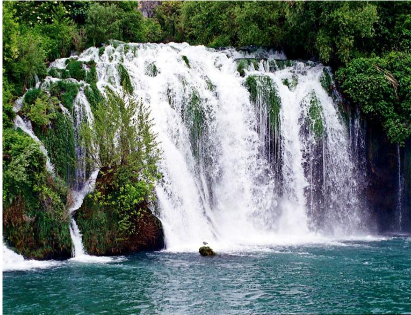
Slika 10. Roški slap

Prvi je slap Bilušića buk visok oko 22 m i dugačak 300 m. Skupina Roški slap (Slika 10) s 12 slapova i slapišta, visoka je od 25,5 do 15 m. Jedan je od najljepših u parku. Pod Roškim slapom počinje najveći ujezerni dio toka, dugačak 13 km, a širok oko 1 km. Na njemu su milinice, stupe i valjalice, od kojih su neke još u pogonu.