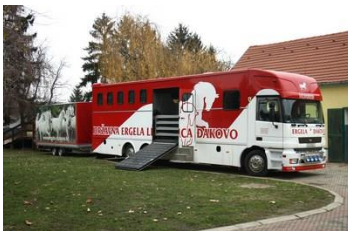
Slika 13.: Transportno vozilo za konje na ergeli Đakovo (Butković, S.)

Transport treba obaviti što mirnije kako životinja (konj) ne bi doživjela traumu (Ivanković, 2004.).