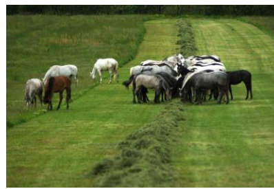
Slike 7., 8., 9.: Prikaz kobila i ždrjebadi na ispaši ergele Ivandvor