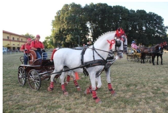
Slika 11.: Zaštitna oprema na konjima za vrijeme natjecanja