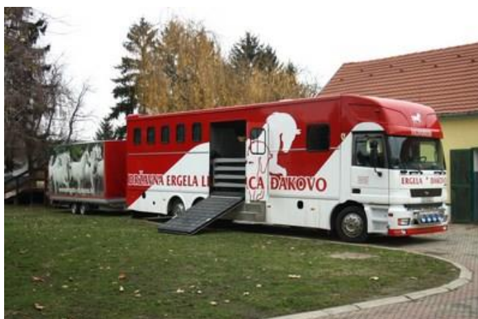
Slika 13.: Transportno vozilo za konje na ergeli Đakovo (Butković, S.)

Transport treba obaviti što mirnije kako životinja (konj) ne bi doživjela traumu (Ivanković, 2004.).