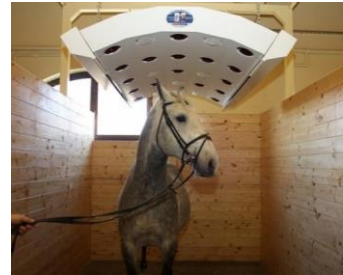
Slike 4., 5., 6.: Individualni boksovi i solarij na Državnoj ergeli lipicanaca Đakovo.