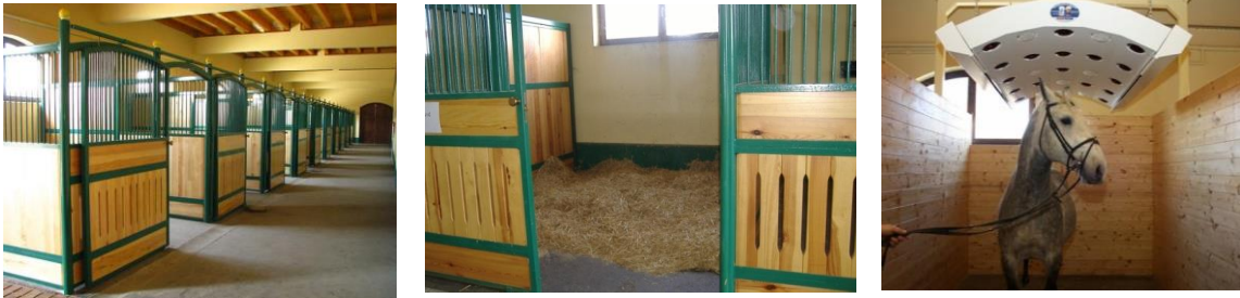
Slike 4., 5., 6.: Individualni boksovi i solarij na Državnoj ergeli lipicanaca Đakovo.

Za zdravlje konja je izuzetno važno svakodnevno čišćenje staje, jednom dnevno. Iz prostora gdje se nalaze konji potrebno je uklanjati izmet i mokru slamu i nakon toga, treba rasprostrijeti novu, čistu stelju. Prije čišćenja podova, konji trebaju biti vezani ili slobodni u ispustu, ukoliko je to moguće. Potreban pribor za čišćenje staje su: vile za uklanjanje izmeta i prljave slame, plosnata čelična lopata, grablje, kruta metla, četka za čišćenje pojilica, te kolica za odvoženje nečiste i dovoženje čiste stelje (Baban, 2015. b).