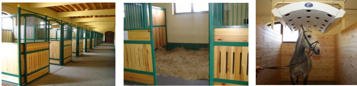
Slike 4., 5., 6.: Individualni boksovi i solarij na Državnoj ergeli lipicanaca Đakovo.

Za zdravlje konja je izuzetno važno svakodnevno čišćenje staje, jednom dnevno. Iz prostora gdje se nalaze konji potrebno je uklanjati izmet i mokru slamu i nakon toga, treba rasprostrijeti novu, čistu stelju. Prije čišćenja podova, konji trebaju biti vezani ili slobodni u ispustu, ukoliko je to moguće. Potreban pribor za čišćenje staje su: vile za uklanjanje izmeta i prljave slame, plosnata čelična lopata, grablje, kruta metla, četka za čišćenje pojilica, te kolica za odvoženje nečiste i dovoženje čiste stelje (Baban, 2015. b).