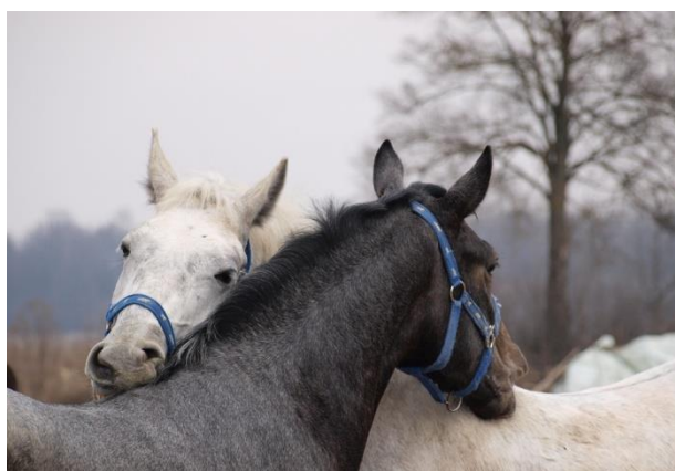
Slika 10. Međusobno čišćenje konja

Držanje konja zahtijeva svakodnevno čišćenje i njegu, ne samo zbog lijepog izgleda, nego zbog održavanja dobrog stanja kože, dlake i kopita. Redovitim četkanjem, pranjem i struganjem, uklanjaju se stare i odumrle stanice dlake i kože te sprječava razvoj štetnih mikroorganizama i bakterija. Čišćenjem kopita svakodnevno obavljamo i pregled, pa je lakše uočiti rane znakove nekih oboljenja ili ozljeda, a samim time omogućava se pravovremena intervencija (Lang, 2005.). Dok su na ispaši, konji međusobnim griženjem, trljanjem od ogradu ili valjanjem, čiste dlaku kako bi ubrzali proces linjanja.