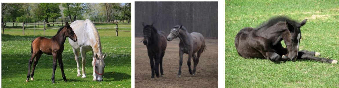
Slika 1., 2. i 3.: Lipicanska ždrijetad na ispaši (Slika 1. i 3., izvor: Butković, S., Slika 2., izvor: Brkanac, M.)

Tretiranje protiv parazita se vrši antiparazitskom pastom. Najbolji rezultati se postižu ako se u isto vrijeme tretiraju svi konji koji borave u istoj staji ili na istom pašnjaku. Najveću pažnju treba posvetiti kobilama i ždrijetadi (u dobi od 6 do 8 tjedana), ako je potrebno postupak ponoviti nakon trideset dana. Redovitim tretmanima smanjuje se opasnost od pojave kolika uzrokovanih odbićem (Trailović i sur., 2012.).