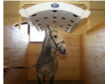
Slike 4., 5., 6.: Individualni boksovi i solarij na Državnoj ergeli lipicanaca Đakovo.