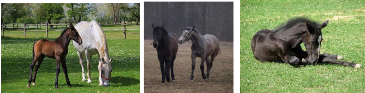
Slika 1., 2. i 3.: Lipicanska ždrijebad na ispaši (Slika 1. i 3., izvor: Butković, S., Slika 2., izvor: Brkanac, M.)

Tretiranje protiv parazita se vrši antiparazitskom pastom. Najbolji rezultati se postižu ako se u isto vrijeme tretiraju svi konji koji borave u istoj staji ili na istom pašnjaku. Najveću pažnju treba posvetiti kobilama i ždrijebadi (u dobi od 6 do 8 tjedana), ako je potrebno postupak ponoviti nakon trideset dana. Redovitim tretmanima smanjuje se opasnost od pojave kolika uzrokovanih odbićem (Trailović i sur., 2012.).