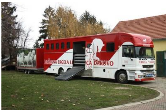
Slika 13.: Transportno vozilo za konje na ergeli Đakovo (Butković, S.)

Transport treba obaviti što mirnije kako životinja (konj) ne bi doživjela traumu (Ivanković, 2004.).