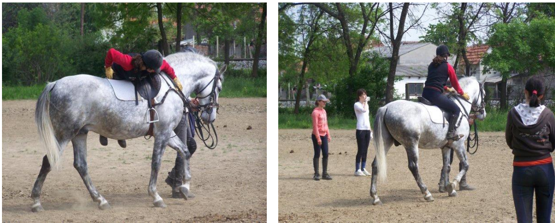
Slika 2. Postupno privikavanje konja na jahača

dvoje ili više ljudi. Kod najahivanja jahač ne smije odmah sjesti na konja, već se postepeno konj privikava na težinu jahača (slika 2.). Prvo penjanje na konja obavlja se tako da se jahač trbuhom nasloni na sedlo. Kada se konj navikne da ima nekoga na leđima jahač može normalno sjesti u sedlo. Prva jahanja rade se na malim ograđenim površinama te započinju laganim korakom konja. Nakon nekoliko dana postepeno se uvodi lagani kas, a nakon toga i galop. Nakon što se konj navikne na jahača, nakon nekoliko dana, ukoliko je miran tijekom jahanja može se maknuti lonža i nastavlja se jahanje u krug bez lonže. Kada procijenimo da je konj pripremljen, može se prijeći na veće otvoreno jahalište (Ivanković, 2004.).