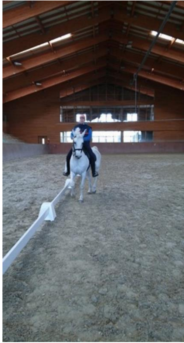
Slika 11. Izvedba vježbe renvers na konju lipicanske pasmine u Ergeli Đakovo