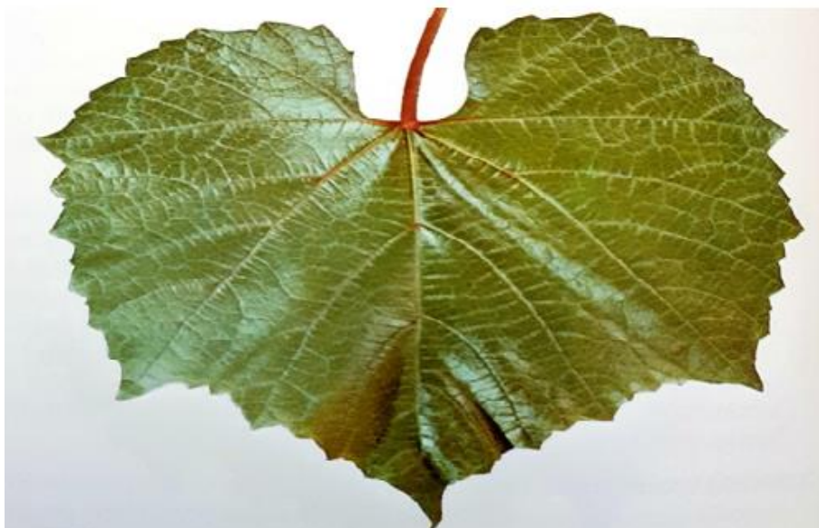
Slika 5. List podloge Vitis berlandieri x Vitis riparia Kober 5BB

Pri otvaranju pupovi su izduženi. Vrh mladice je paučinast i povinut. List može biti srednje velik ili velik, širi nego duži, mješurast, mrežast i trodjelan. Cvijet je hermafroditan, funkcionalno ženski ili funkcionalno muški. Mladica je glatka i blijedozelena. Rozgva je dugačka, tamnosmeđe boje s tamnijim prugama po rebrima. Drvo je tvrdo, uske srži i razvijene dijafragme. Rast je stablast, bujan i dugačkih mladica ( Mirošević i Turković, 2003.).