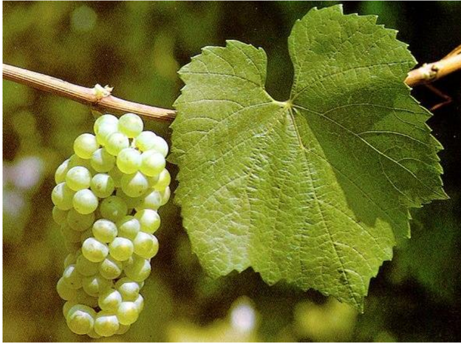
Slika 3. Chardonnay