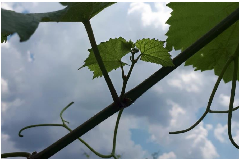
Slika 8. Zaperak

Zaperak je mladica koja tijekom vegetacije izraste iz ovogodišnje mladice, a nastaje iz ljetnog ili zaperkovog pupa. Razvoj zaperka je ponekad slab pa se osuši i otpadne. Njihov razvoj ovisi o sorti, bujnosti trsa, agrotehnici, ampelotehnici, vlažnosti i ishranjenosti. Izgledom su tanji, kraći, manjega lišća svijetle boje za razliku od glavne mladice. Pomoću zaperka trs nastoji stvoriti što više asimilata te sa njihovom zalihom ući u stadij zimskog mirovanja. Važni su u slučaju oštećenja vinove loze proljetnim mrazovima jer njihovim razvojem nadoknađujemo vegetativnu masu uništenu mrazom. Ako se glavna mladica rano pincira, zaperak može preuzeti njezinu ulogu. Pri dobroj ishranjenosti u zaperkovu pupu se oblikuju cvati iz kojih se razviju grozdovi. Takvi grozdovi uglavnom ostaju nedozreli i nazivaju se martinsko grožđe ili greš. Zaperci su većinom nepotrebni i nerodni pa se u ranijoj fazi vegetacije uklanjaju ili prikraćuju (Puhelek i sur., 2010.).