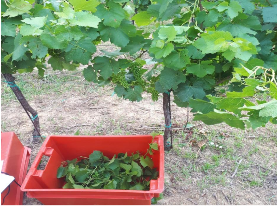
Slika 10. Uklonjeni zaperci u kašetama