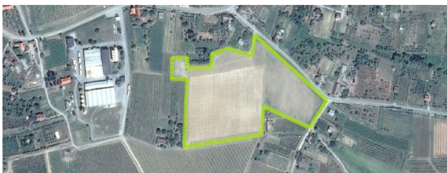
Slika 2. Pokušalište Mandićevac - snimka iz zraka

Položaj vinograda znatno utječe na rodnost jer djeluje na makroklimatske uvjete koji se mogu odraziti na proizvodnju grožđa i vina. Godine 2012. kupljena je površina veličine 3,3570 ha na lokaciji Mandićevac, vinogorje Đakovo koje spada u Istočnu kontinentalnu vinogradarsku regiju i podregiju Slavonija. Vinograd je nepravilnog poligonalnog oblika. Smješten je na nadmorskoj visini od 208 m, južne ekspozicije s padom W→E od 9.8%. Tijekom 2013. godine posađen je proizvodno-pokusni nasad sa vinskim sortama za proizvodnju bijelih vina: Chardonnay, Graševina, Rizling rajnski, Sauvignon bijeli i Traminac mirisavi, te za proizvodnju crnih vina: Cabernet sauvignon, Merlot i Frankovka. Ukupna pokusna površina je 14534 m 2 , međurednog razmaka 2,2 m, a unutar reda 0.8 m. Svaka sorta je zastupljena s 1040 trsova, najčešće na dvije podloge i s dva klona.