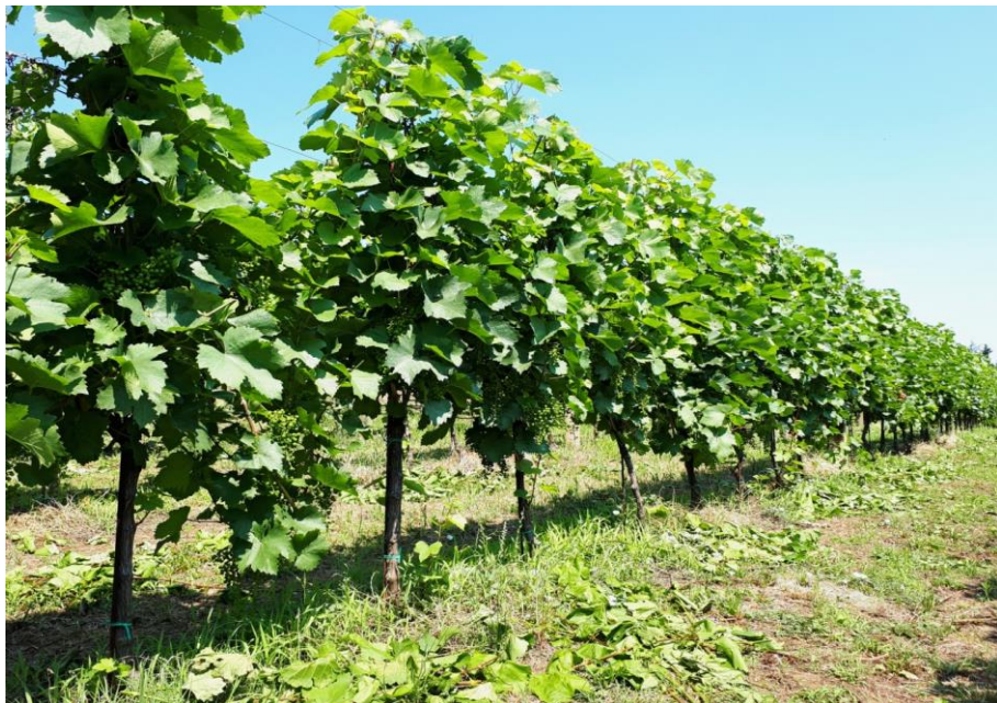
Slika 4. Trsovi kultivara Chardonnay