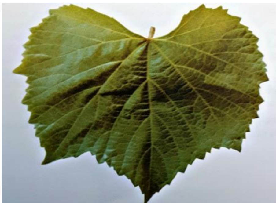
Slika 6. List podloge Vitis berlandieri x Vitis riparia SO4

Pri otvaranju pup je bubrežast i blijedo zelenkast. Vrh mladice je uspravan ili povinut te paučinast. Listovi su srednje veliki do veliki i cijeli. Plojka je mjehurasta, mala, kratke peteljke i široko otvorenog sinusa u obliku slova "U". Cvijet je muški odnosno hermafroditan, ali funkcionalno muški. Mladica je rebrasta i zelenkasta s ljubičastim nodijima. Rozgva je žućkastosmeđe boje. Zimski pupovi su mali ili srednje veliki i izduženi (Mirošević i Turković, 2003.).