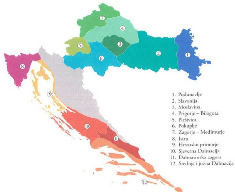
Slika 1. Vinogradarske podregije