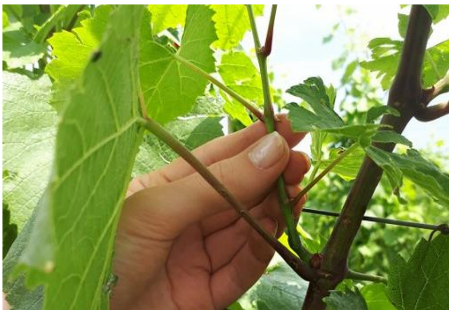
Slika 7. Ručno skidanje zaperaka

Mjera zelenog reza koja se obavlja istodobno s plijevljenjem ili pinciranjem. Zaperke moramo ukloniti na vrijeme u zoni cvatova odnosno donjih koljenaca na mladici jer tako poboljšavamo uvjete cvatnje i oplodnje. Razvijene zaperke prikraćujemo na jedan pup kako nebi oštetili zimski pup, a mlade zaperke uklanjamo u potpunosti. Skidanje i zalamanje zaperaka u kasnijim fazama razvoja trsa nije potrebno. Zahvat se obavlja ručno ili škarama.