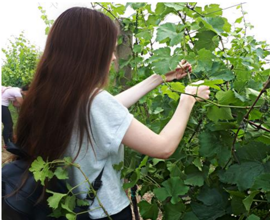
Slika 9. Uklanjanje zaperaka

Testiranje razlika između dviju prosječnih vrijednosti napravljeno je su pomoću t-testa.