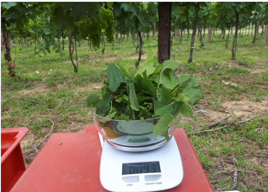
Slika 11. Vaganje uklonjenih zaperaka digitalnom vagom