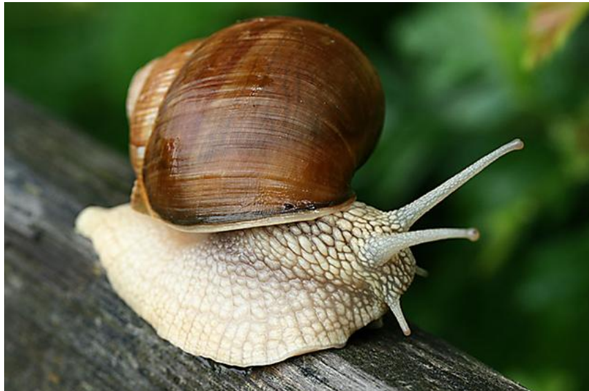
Slika 1 Helix Pomatia (L.), Izvor: http://big-snail.hr/helix-pomatia/

( Helix pomatia L.) veličine oko 4,5 centimetara, okruglog oblika, žučkasto-smeđe boje s poprečnim nepravilnim prugama, a ako se duže vremena zadržava na suncu ili kiši, postaje bijele boje. Otvor kućice je okrugao, tijelo je krupno, žućkaste boje, a nalazimo ga na prostranstvima cijele Hrvatske. Najidealniji prostor za uzgoj su vapnenasti tereni - otočni suhozidi s relativno suhim zemljištem. Pari se najmanje dva puta godišnje i polaže oko 60 jaja. U uzgajalištu daje dobre rezultate, a nakon 20 mjeseci spreman je za konzumiranje.