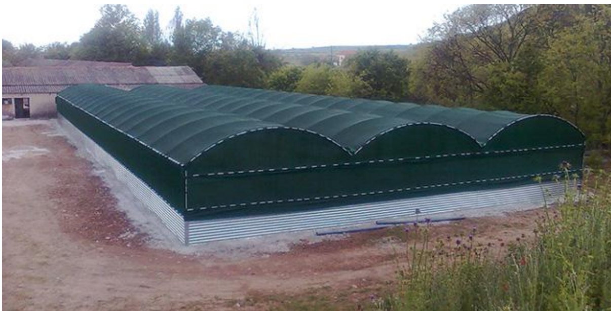
Slika 5 Izgled farme puževa