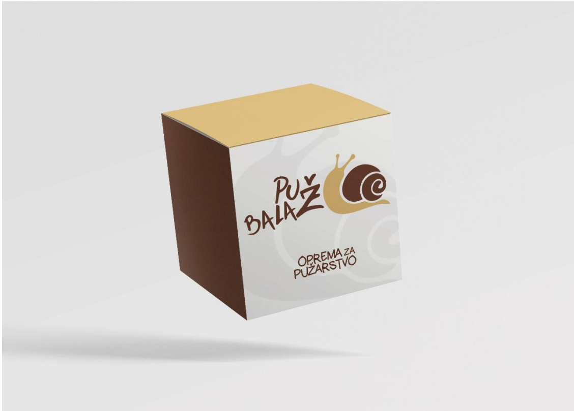
Slika 3 Oprema za pužarstvo branding 2.