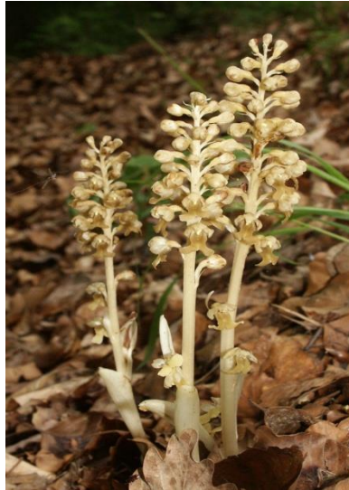
Slika 20. Neottia nidus-avis (L.) Rich.