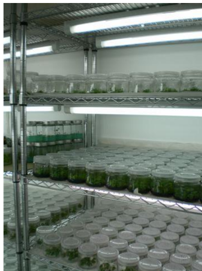
Slika 38. Klima komora

Nakon sterilizacije, pripremaju se majčinske biljke za uvođenje u kulturu. Odabrane biljke moraju biti zdrave i sortno čiste. Zatim se priprema početni materijal za razmnožavanje (eksplantat). Eksplantat se mora brzo prebaciti na pripremljenu podlogu kako ne bi došlo do sušenja tkiva. Staklenke se slože u klima komore (Slika 38.) i tamo započinje proces razmnožavanja.