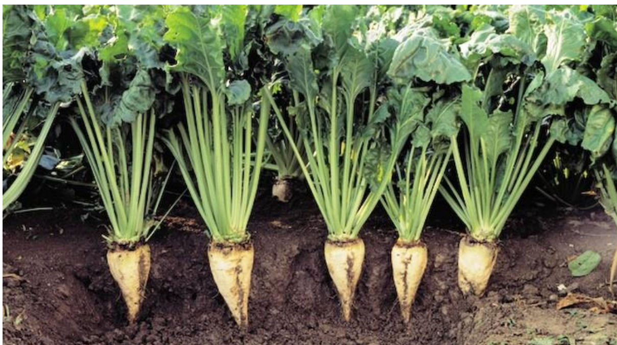
Slika 1. Šećerna repa

Šećerna repa ( Beta vulgaris var. saccharifera ) spada u porodicu Chenopodiaceae , a spada u industrijska biljke koje se uzgajaju za proizvodnju šećera zbog visoke koncentracije saharoze u njezinom zadebljanom korijenu. Sadržaj šećerne repe je 75% voda, 16% - 18% šećera, 5% - 6% celuloze te 2% - 3% ostalih suspcstanci. Dvogodišnja je biljka koja u prvoj godini stvara zadebljani korijen i rozetu listova, a drugoj godini stvara se stabljika, cvijet i plod.