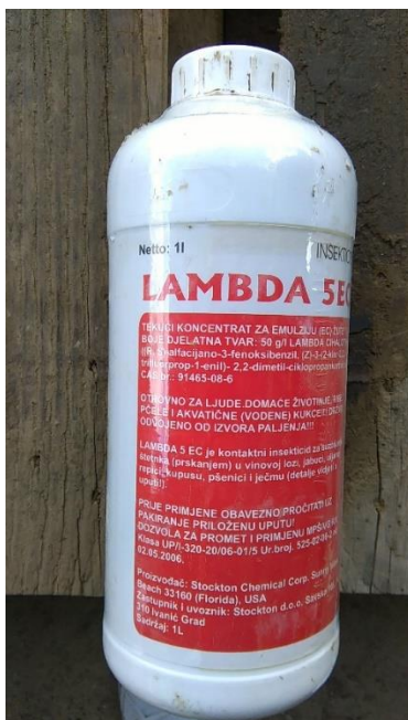
Slika 20. Insekticid „Lambda 5EC“

Prve veće štete na usjevima pojavile su se početkom mjeseca svibnja na pšenici. Oulema melanopus L. je pronađena u nekim poljima, te je apliciran insekticid aktivne tvari lambda cihalotrin (Slika 20.) kako bi se spriječilo dalje širenje i oštećenje biljaka.