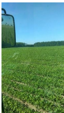
Slika 5. Soja u zadnjim vegetativnim stadijima