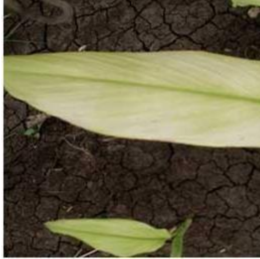
Slika 11. Deficit željeza (Fe) kod kurkume

Sunil i sur. (2014.) proučavali su utjecaj navodnjavanja i gnojidbe na prinos kurkume tijekom dvije godine. Značajno viša visina biljke, broj cvjetova po biljci, broj listova po biljci, lisna površina, LAI i LAD su zabilježeni u navodnjavanju kap po kap u usporedbi s ostalim metodama. Veći prinos zabilježen je kod Cudappah vrste kurkume u odnosu na Pratibha. Što se tiče gnojidbe, najveći prinos je zabilježen na tretmanu gnojidbe 270:135:180 kg/ha. Zabilježen je značajan utjecaj tretmana navodnjavanja i gnojidbe na prinos i parametre rasta kurkume. Navodnjavanje sustavom kap po kap Cudappah varijetetom uz gnojidbu od 270:135:180 kg/ha rezultiralo je značajno većim prinosom (26,13 t/ha).