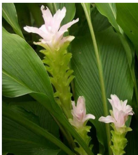
Slika 9. Cvat Curcuma longa L. (bijela)