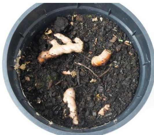
Slika 6. Razmnožavanje kurkume rizomom

Bočni izdanci su često nazvani „prsti“ te služe za razmnožavanje kurkume kako je prikazano na slici 6.