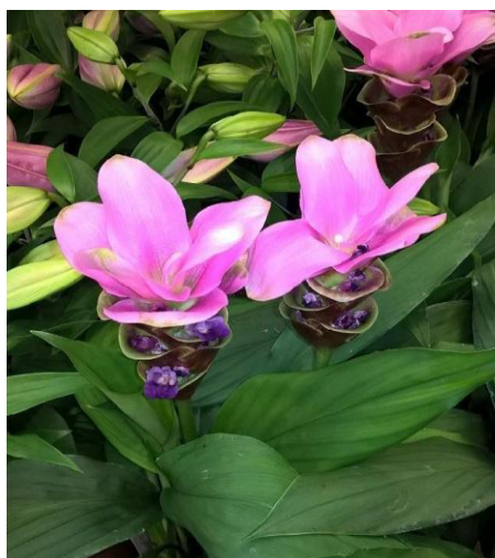
Slika 8. Cvat Curcuma longa L. (ružičasta)

Cvjetovi kurkume su dvospolni i skupljeni u guste cvatove koji rastu u srednjem dijelu biljke. Cvat je šiljastog, cilindričnog oblika dugačak 10 do 15 cm i širok 5 do 7 cm, a nalazi se uz lisnu peteljku. Brakteje su spiralno raspoređene u gustom sklopu što daje cvjetovima izgled stošca. Brakteje su zbijene i kopljastog oblika, dugačke 5-6 cm i široke oko 2,5 cm. Prvih 3 do 7 i zadnjih 5 do 10 brakteja su bez cvijeta. Gornje brakteje su sterilne, bijele su boje (ili bijele sa zelenim prugama) sa ružičastim vrhom. Brakteole su tanke, epileptične i duge oko 3,5 cm. Cvjetovi se otvaraju jedan po jedan. Broj cvjetova po cvatovima kreće se od 26 do 35 (Purseglove i sur., 1981., Sherlija i sur., 2001.). Kurkuma u svom prirodnom staništu cvate u kolovožu. Kurkuma u cvatu prikazana je slikama 8. i 9.