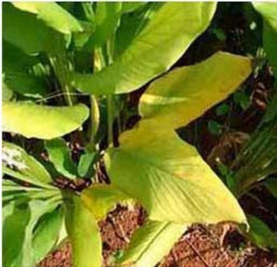
Slika 10. Deficit dušika (N) kod kurkume