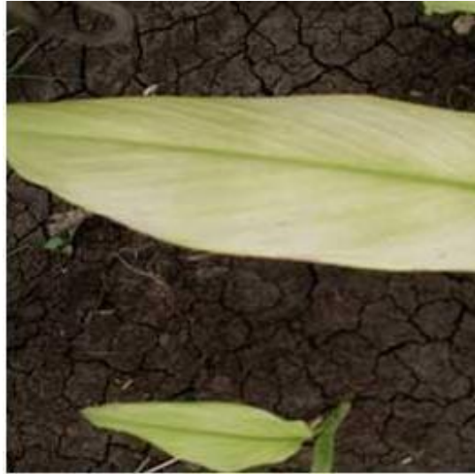
Slika 11. Deficit željeza (Fe) kod kurkume

Sunil i sur. (2014.) proučavali su utjecaj navodnjavanja i gnojidbe na prinos kurkume tijekom dvije godine. Značajno viša visina biljke, broj cvjetova po biljci, broj listova po biljci, lisna površina, LAI i LAD su zabilježeni u navodnjavanju kap po kap u usporedbi s ostalim metodama. Veći prinos zabilježen je kod Cudappah vrste kurkume u odnosu na Pratibha. Što se tiče gnojidbe, najveći prinos je zabilježen na tretmanu gnojidbe 270:135:180 kg/ha. Zabilježen je značajan utjecaj tretmana navodnjavanja i gnojidbe na prinos i parametre rasta kurkume. Navodnjavanje sustavom kap po kap Cudappah varijetatom uz gnojidbu od 270:135:180 kg/ha rezultiralo je značajno većim prinosom (26,13 t/ha).