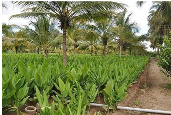
Slika 12. Intercropping – kurkuma i kokos

usjevima kao što su ricinus ( Ricinus communis L.) i Sesbania grandiflora (L.) Poiret. Na slici 12. prikazan je uzgoj kurkume u kombinaciji s kokosom.