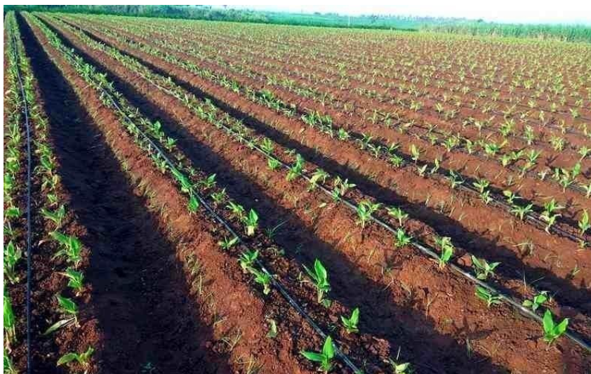
Slika 13. Navodnjavanje polja kurkume sustavom „kap po kap“

samo za neke usjeve i površine, a najšira primjena je u zemljama gdje nema dovoljno vode i gdje je voda dragocjenost, a bez nje nema poljoprivredne proizvodnje (Izrael, Jug Italije, Francuska, SAD). Najekonomičniji je sustav jer štedi vodu, a s najmanjom količinom vode postiže najveće učinke u biljnoj proizvodnji. Navodnjavanjem kapanjem smanjena je potrošnja vode u navodnjavanju kurkume za 20 do 60 % (Singte i sur., 1997.).