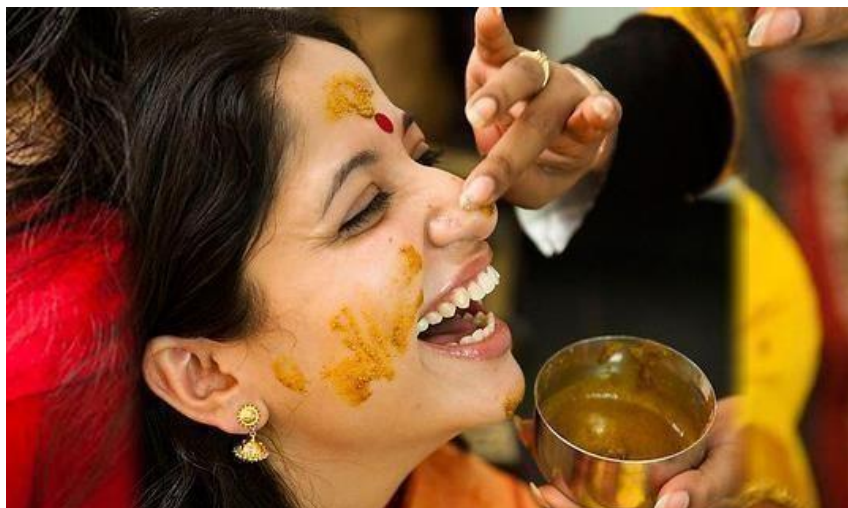
Slika 2. Ukrašavanje kurkumom na tradicionalnim indijskim vjenčanjima

Tumori dojki mogu se liječiti ekstraktima kurkume. U Indiji je kurkuma korištena u ritualima ljepote u vidu njege lica i tijela te u ceremonijama tradicionalnog vjenčanja (slika 2.).