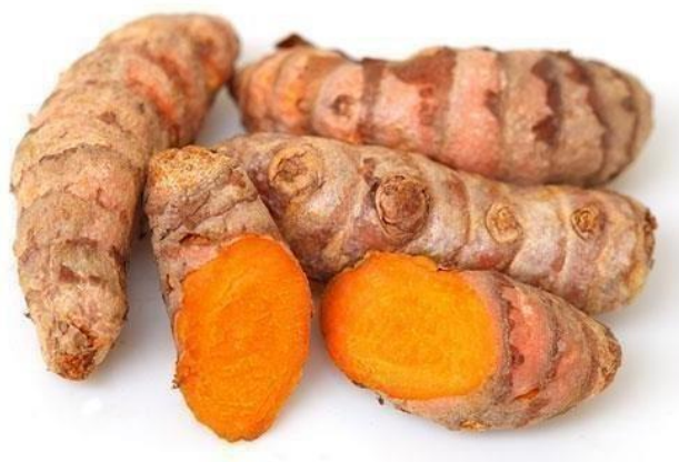
Slika 5. Rizom kurkume

Korijen (rizom) ili podzemni dio biljke čini zadebljani gomolj elipsoidne građe s oko 5 do 8 cm dugim i 15 mm debelim bočnim izdancima koji mogu biti ravni ili blago zaobljeni. Kompleksne je građe s bočnim, sekundarnim izdancima. Izvana je smeđe boje, a unutar se krije žarko narančasto meso. Kurkuma se razmnožava vegetativnim putem preko svojih rizoma, a ne preko sjemena. Rizom kurkume se može pojaviti u obliku cilindra s učestalim spiralnim dijelovima (slika 5.).