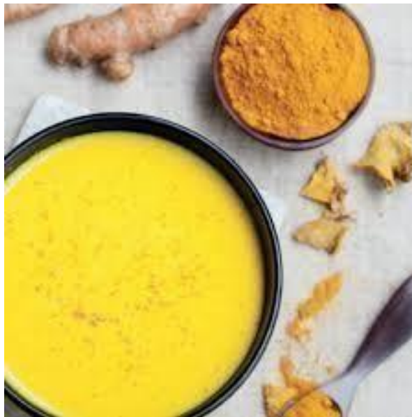
Slika 3. Kurkuma kao začin

Kurkuma se prvi puta pojavila kao začin u kuharici Hannah Glasse iz 1747. godine. Začin je upečatljive zlatno-narančaste boje, a pigmenti u začinu su fluorescentni (slika 3.). Prije same uporabe podanak kurkume je potrebno obraditi na slijedeći način. Podanak se kuha ili pari, potom se suši na suncu kako bi krajnji sadržaj vlage bio između 8 % i 10 %. Osušeni podanci se poliraju kako bi se uklonila gruba površina i na kraju se melju. Dobiveni prah zadržava boju dulje vremensko razdoblje, međutim kako navodi Wee i sur. (2011.) okus se s vremenom može promijeniti.