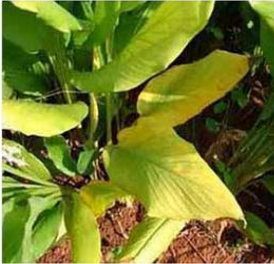
Slika 10. Deficit dušika (N) kod kurkume