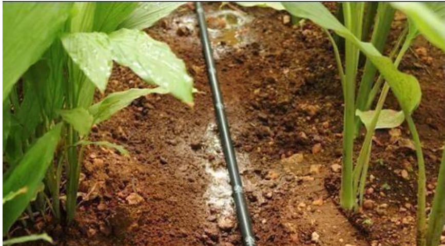
Slika 14. Polietilenske cijevi u sustavu ap po kap