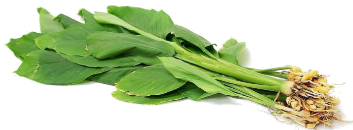
Slika 7. Listovi kurkume