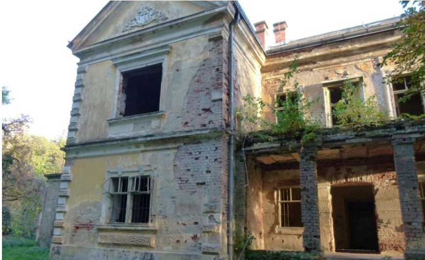
Slika 21_Središnja zgrada s vidljivim obiteljskim grbom obitelji Janković