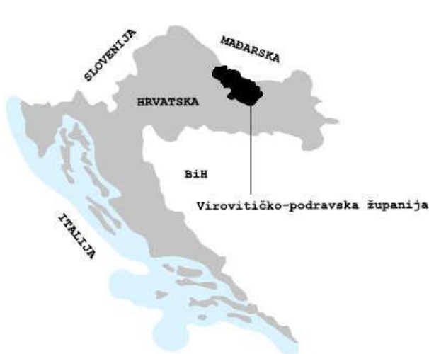
Slika 1_Položaj Virovitičko-podravne županije u Republici Hrvatskoj; izrađivač: ZPUVPŽ

Dvorac se nalazi u središtu naselja Suhopolje, neposredno uz državnu cestu D-2, na udaljenosti od 9,8 km od sjedišta Županije – Grada Virovitice, 157 km od Zagreba i 117 km od Osijeka. Povoljan smještaj dvorca neposredno uz državnu cestu, a ujedno i u neposrednoj blizini samoga središta naselja, otvara mogućnost da se sadržaj koji se planira uvesti u dvorac otvara većem broju korisnika. Stoga je u dvorac poželjno smjestiti sadržaje ugostiteljsko-turističkoga karaktera.