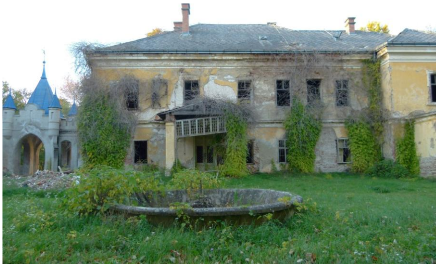
Slika 22_Pogled s dvorišne (južne) strane na središnju zgradu