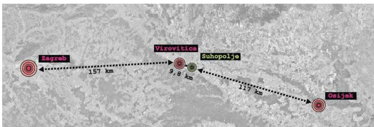
Slika 3_Prikaz prosječnih udaljenosti Suhopolja od Zagreba, Virovitice i Osijeka; izrađivač: ZPUVPŽ