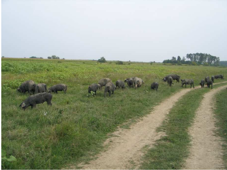
Slika 2. Crne slavonske svinje u otvorenom sustavu držanja