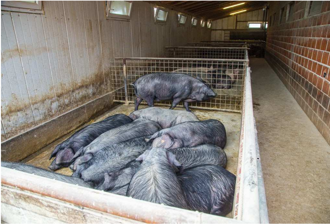
Slika 4. Crne slavonske svinje u zatvorenom sustavu držanja