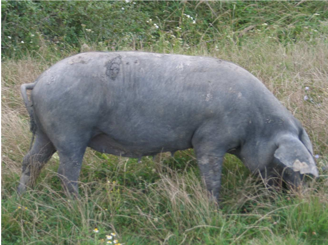
Slika 1. Crna slavonska svinja

Pasmina je pod zaštitom Nacionalnog programa za očuvanje autohtonih i ugroženih pasmina domaćih životinja u Hrvatskoj, a FAO / EAAP status ugroženosti je – potencijalno ugrožena.