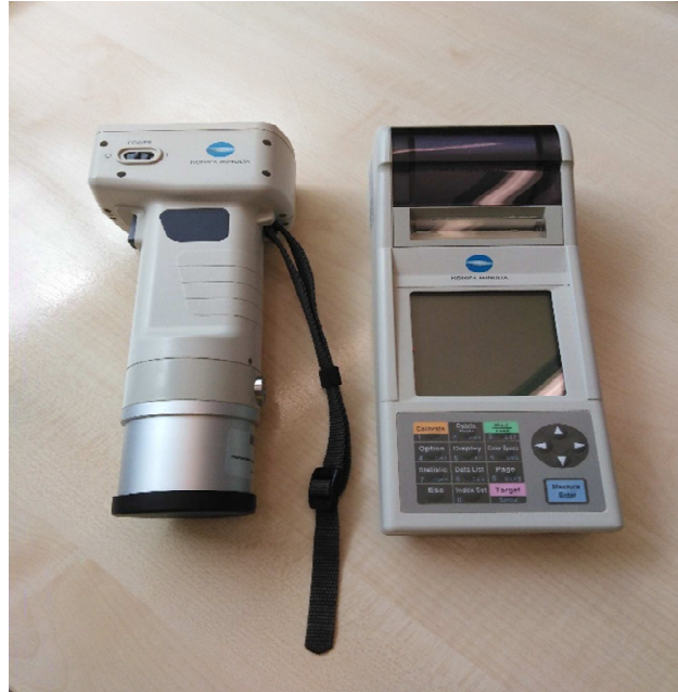
Slika 5. Kolorimetar MINOLTA CR-410

svinjetine je ružičasto – crvena (Mancini i Hunt, 2005.). Boju mesa je moguće odrediti vizualno – različitim skalama za ocjenjivanje i objektivno (fotometar, spektrofotometar i kolorimetar).