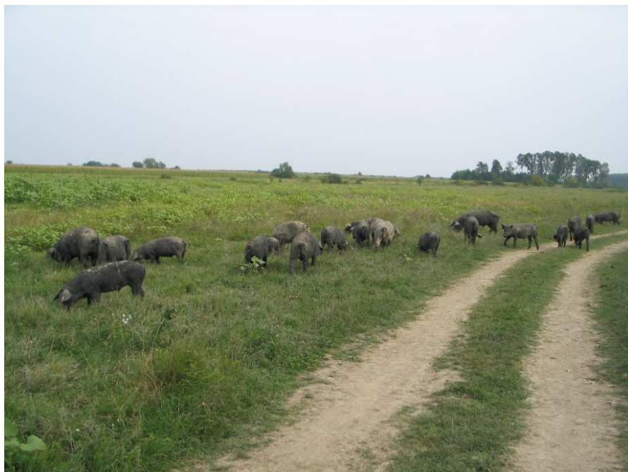
Slika 2. Crne slavonske svinje u otvorenom sustavu držanja