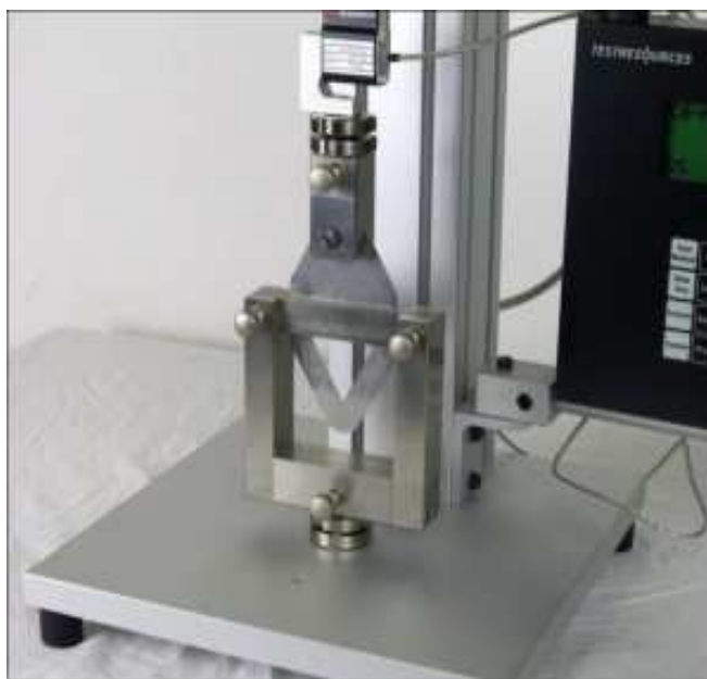
Slika 6. Warner- Bratzler (WB) uređaj za sječenje

Sila potrebna za presijecanje uzorka mesa mjeri se pokretom metalnih sječiva, a ovo mjerenje se izvodi uporabom Warner- Bratzler (WB) uređajem za sječenje.