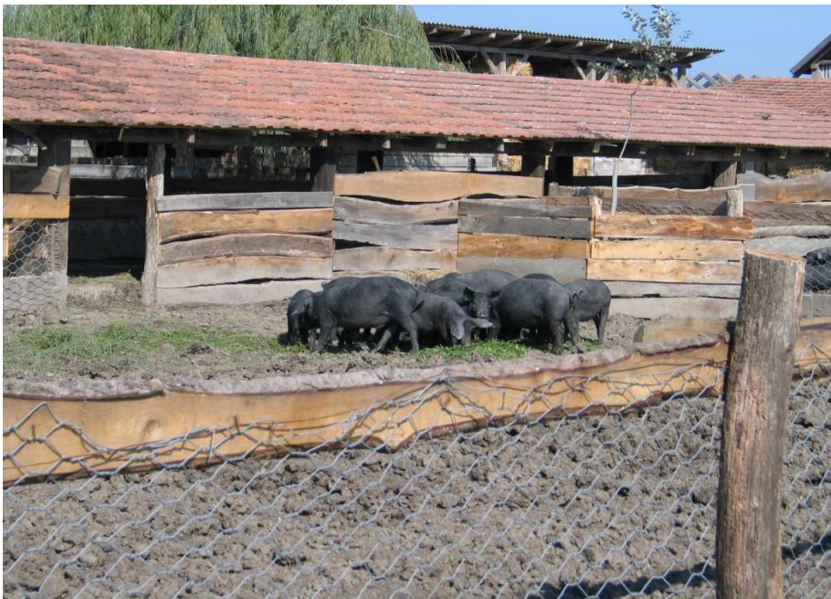
Slika 3. Crne slavonske svinje u poluotvorenom sustavu držanja