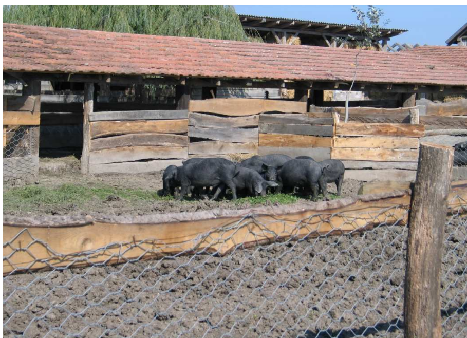
Slika 3. Crne slavonske svinje u poluotvorenom sustavu držanja