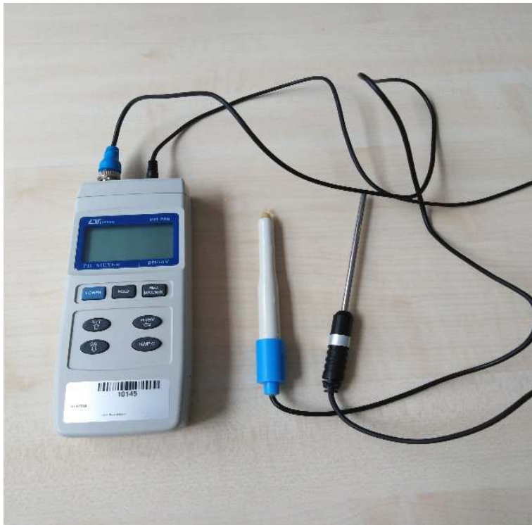
Slika 7. pH metar