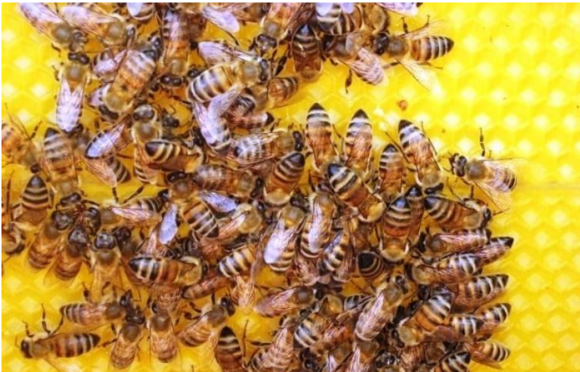
Slika 8. Pčelinja zajednica

Utjecaj pesticida na zajednice može biti vrlo opasan, i uključuje i učinak na proizvodnju saća (što smanjuje dostupno područje za podizanje legla i spremanje meda), izlijevanje jajašaca, opstanak preko zime, zamjenjivanje starih matica mladima te sposobnosti zajednice da izabere novu maticu. Svi ovi učinci imaju potencijal da imaju veliki utjecaj na opstanak zajednice.