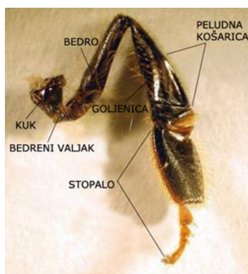
Slika 3. Građa stražnje noge

Srednje noge služe za čišćenje krila, četkanje peludi na peludnoj košarici i skidaju vosak iz voštanih džepića.