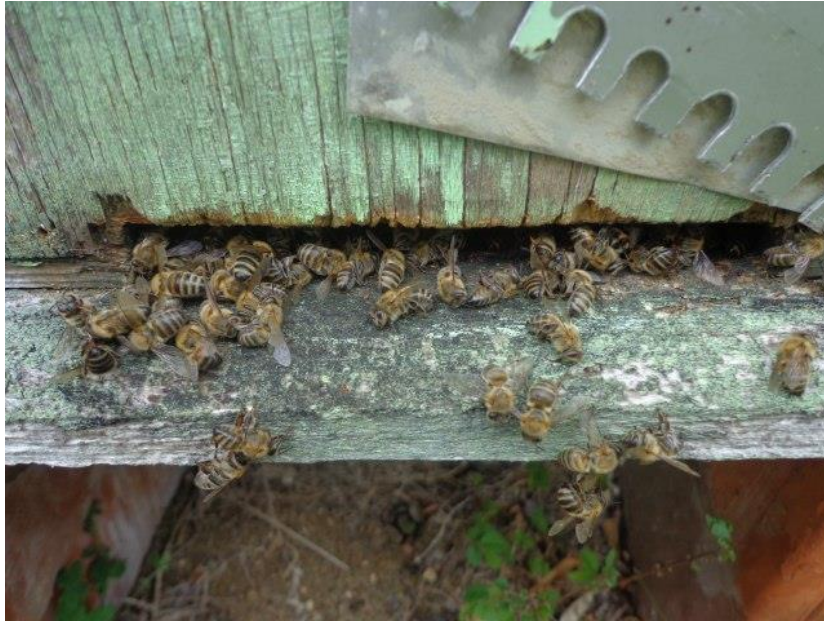
Slika 6. Otrovana pčelinja zajednica

(Kirchner). Manja je motivacija da se izvede ples zatkom i porast drhtavog plesa. Sposobnost sakupljačica da se vrate može uvelike utjecati na preživljavanje zajednice budući da regrutiranje pčela hraniteljica da tragaju za hranom smanjuje proizvodnju legla. Učinak na prenošenje informacija o izvoru hrane je možda manje značajan budući da će pčele vjerojatno tragati za hranom prije nego se vrate bez nektara ili peludi.