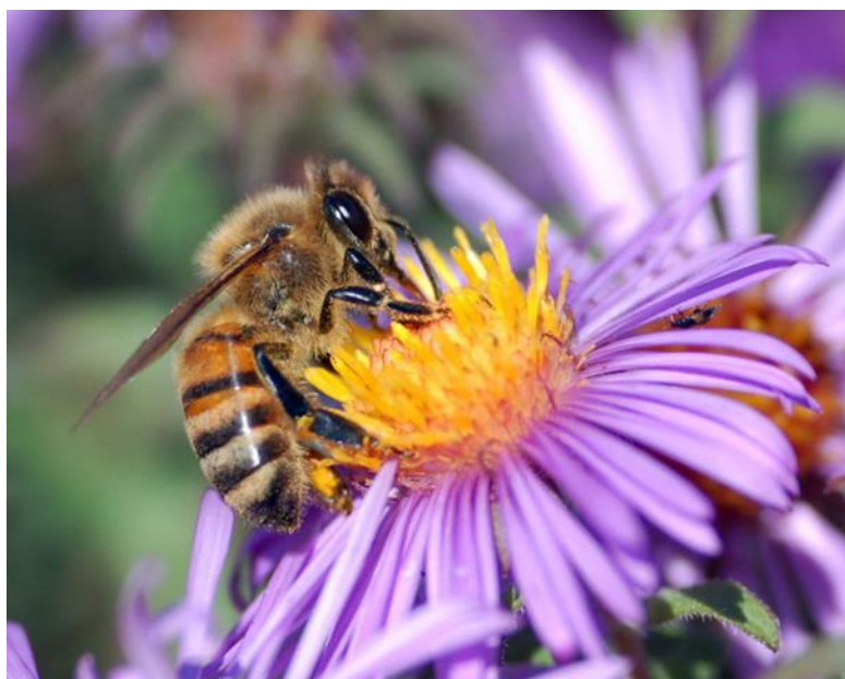
Slika 1. Pčela medarica na cvijetu

To je jedini kukac-životinja koji proizvodi hranu koju jedu i ljudi