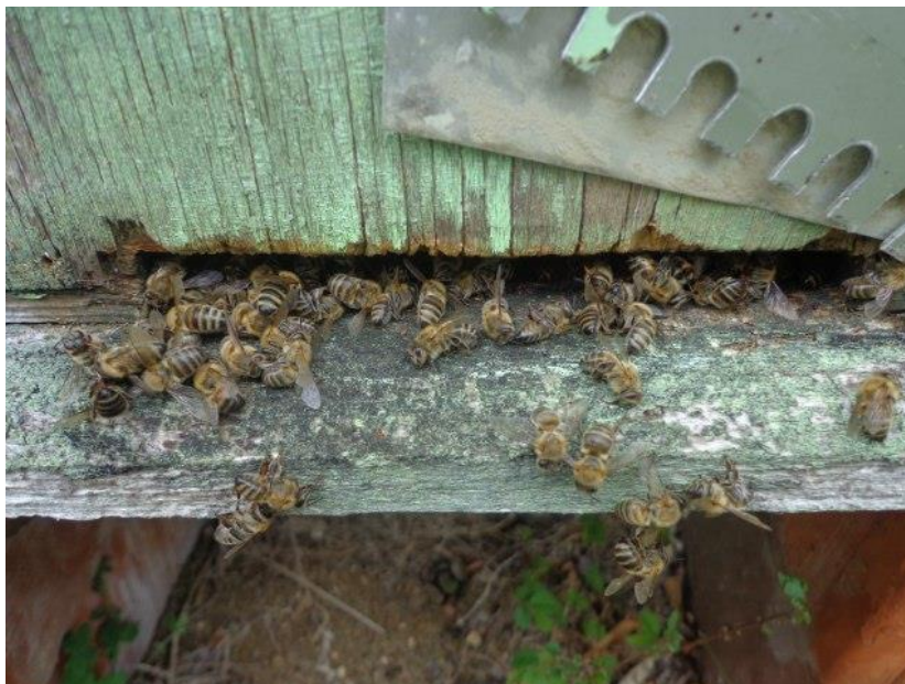
Slika 6. Otrovana pčelinja zajednica

(Kirchner). Manja je motivacija da se izvede ples zatkom i porast drhtavog plesa. Sposobnost sakupljačica da se vrte može uvelike utjecati na preživljavanje zajednice budući da regrutiranje pčela hraniteljica da tragaju za hranom smanjuje proizvodnju legla. Učinak na prenošenje informacija o izvoru hrane je možda manje značajan budući da će pčele vjerojatno tragati za hranom prije nego se vrte bez nektara ili peludi.