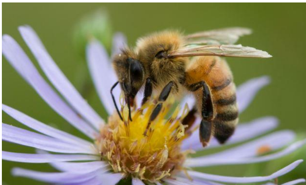
Slika 5: Pčela skuplja pelud

netretiranih pčela. Pogreške u uzorku plesa pčela sakupljačica rezultira pogrešnim usmjeravanjem skupljačica početnica pokazujući važnost plesa u usmjeravanju pčela sakupljačica prema izvorima nektarima. Slično, pčele su radile pogreške u udaljenosti do 6 sati koji ima utjecaj ne samo na neotrovane novake, koje su tražile hranu preblizu košnici, nego i na otrovane pčele koje nisu stigle do izvora.