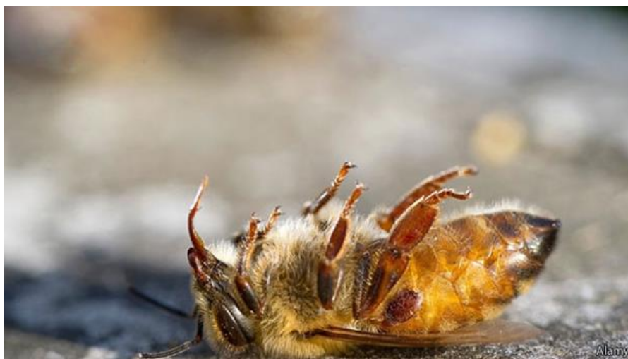
Slika 7. Uginula pčela