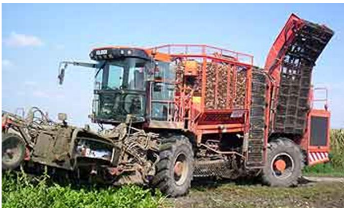
Slika 5. Vadilica šećerne repe