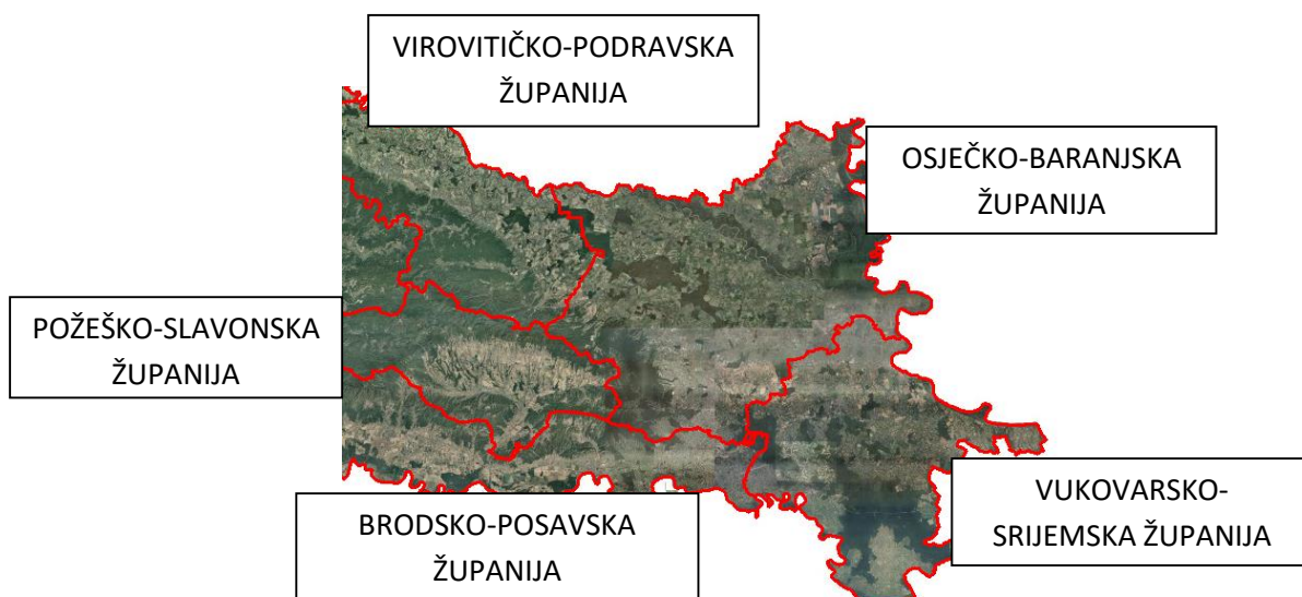
Slika 1. Područja u Republici Hrvatskoj na kojima se uzgaja šećerna repa ( http://preglednik.arkod.hr/ARKOD-Web/#layers=OSNOVNI%20PROSTORNI%20PODACI )

Šećerna repa u Republici Hrvatskoj uzgaja se na području Slavonije, Baranje, Srijema, Podravine i Međimurija (Slika 1.). Navedena područja pogodna su za uzgoj šećerne repe u Republici Hrvatskoj jer imaju tla pogodna za uzgoj iste. Na nekima je potrebno navodnjavanje, a neka su kisela pa se mora aplicirati karbokalk..