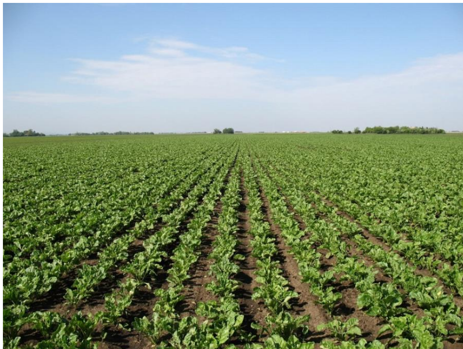
Slika 3. Izgled šećerne repe OPG-a „Leko Tomislav“ 1. 6. 2017.