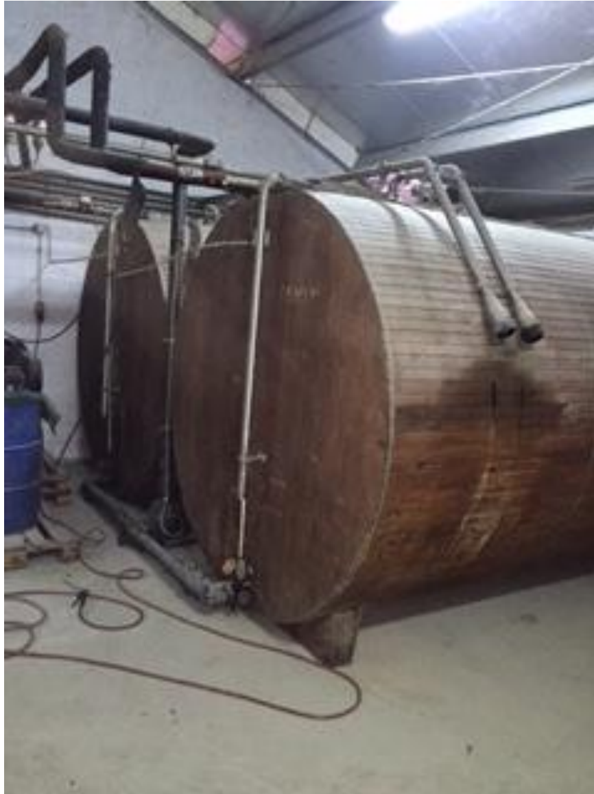
Slika 8. Tankovi za kokosovo i palmino ulje

Od objekata na farmi nalazi se i nadstrešnica dužine 70 m, i širine 24 m, koja služi kao skladište mehanizacije za tvrtku. Na ulazu u farmu je i objekt za pripremu vode iz arteškog bunara. Kao energent na farmi koristi se ukapljeni plin, a služi za grijanje vode u bojlerima i grijanje ulja u tankovima. Oko proizvodnih objekata su putevi za manipulaciju i zelene površine. Radna snaga na farmi je: veterinar na pola radnog vremena i 5 djelatnika za hranidbu teladi.