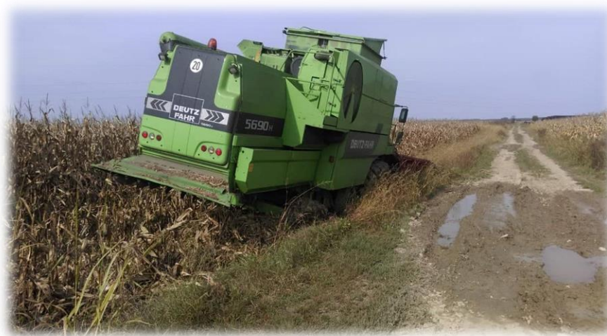
Slika 5. Žetva kukuruza

Ubiranje silažnog kukuruza - Preporučuje se podešavanje duljine reza od 4 do 10 mm. Kraći rez omogućuje bolje gaženje i sabijanje biljne mase te lakšu probavljivost kod preživača. Dio kukuruza koji se namjerava koristiti u ishrani stoke najracionalnije je koristiti u obliku silaže. Na taj način pojeftinjuje se proizvodnja stočne hrane po jedinici površine. Kukuruz upotrijebljen u obliku silaže ima gotovo 50 % veći hranidbeni efekt nego kukuruz u obliku suhog zrna (Zovkić, 1981.).