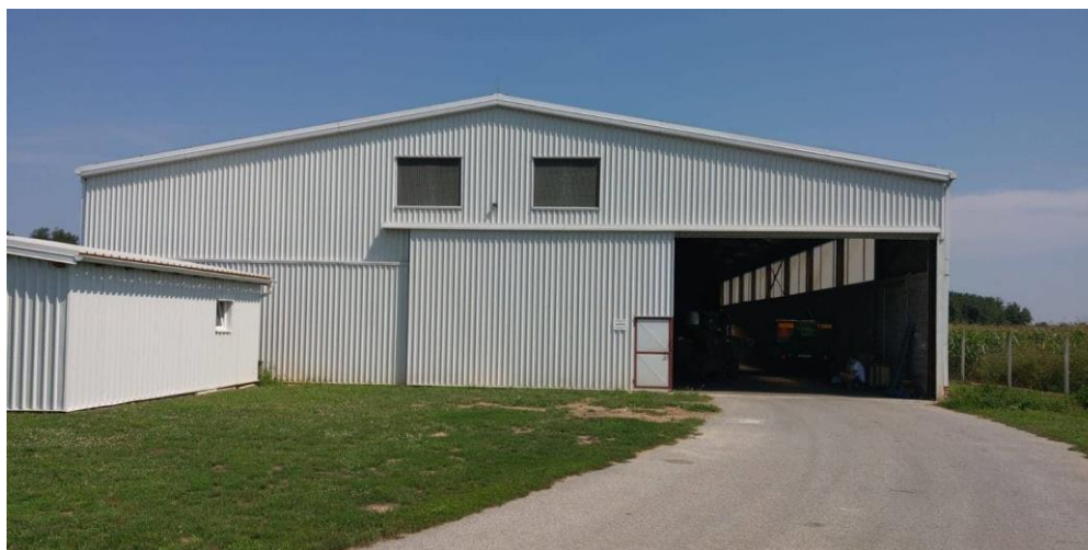
Slika 1. Prostor namijenjen za skladištenje ratarskih kultura

Nekoć su se bavili stočarstvom te strpljivo i revno držali krave i bikove, no danas se, s obzirom na stanje u stočarstvu, a i na lokaciju gospodarstva gdje je niža vodoopskrba zbog čega nisu mogli ishoditi dozvolu za izgradnju većeg objekta, bave isključivo ratarstvom, a zahvaljujući tomu, žive od svog rada.