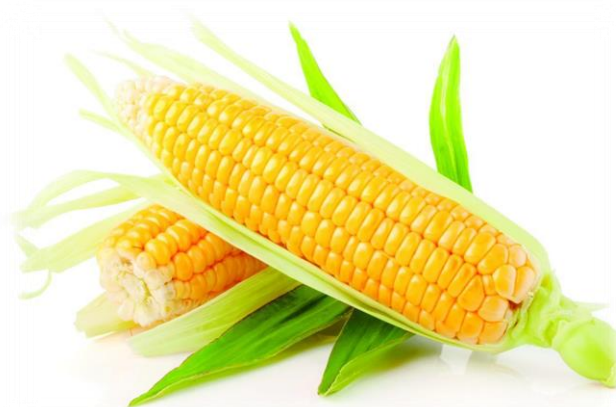
Slika 3. Kukuruz, Zea Mays

Od kukuruza se u svijetu proizvodi više od 1000 raznih proizvoda. Kukuruz ima poseban značaj u stočarstvu, bilo kao zrno ili silaža cijele biljke. Ne zbog boje zrna, nego zbog velike gospodarske vrijednosti kukuruz se naziva i "zlatno zrno". Zbog lakog uzgoja kukuruz se sve više širi pa se danas sije i u zemljama gdje ga ranije nisu poznavali. Kukuruz sve više potiskuje pšenicu i druge ratarske kulture. U prehrani ljudi kukuruz konzumiramo kao povrće ili samljevenog u brašno od kojeg se radi kukuruzni kruh, ali i palenta. Isto tako se proizvode i popularni proizvodi kao što su kukuruzne pahuljice ili kokice. U paleti proizvoda od kukuruza nalazi se i kukuruzno ulje koje se dobiva od kukuruznih klica. Klica kukuruza sadrži preko 30% vrlo kvalitetnog ulja za ljudsku prehranu. Agrotehnička važnost kukuruza je vrlo velika jer se sije na velikim površinama, pa na većim površinama dolazi kao predkultura drugim kulturama (Kovačević i Rastija, 2009.).