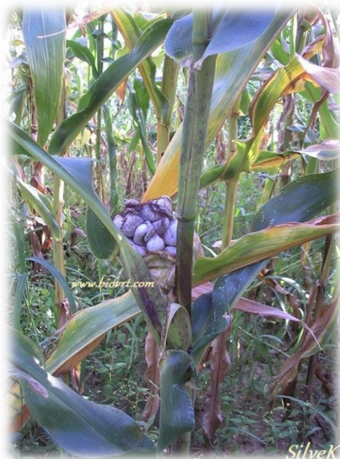
Slika 4. Mjehurasta snijet kod kukuruza

Kukuruz napadaju uglavnom gljivične bolesti. Među prvim bolestima koju možemo opaziti na mladom kukuruзу kada dosegne visinu od 30 do 50 je mjehurasta snijet.