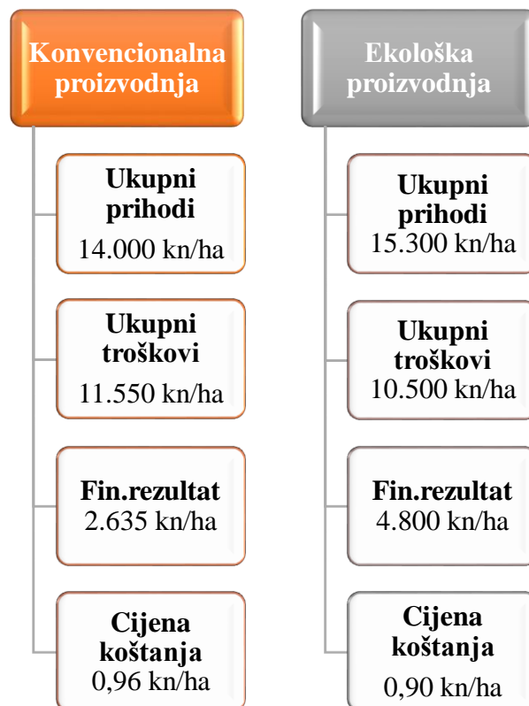
Shema 1. Apsolutna mjerila uspješnosti kukuruza u konvencionalnom i ekološkom sustavu