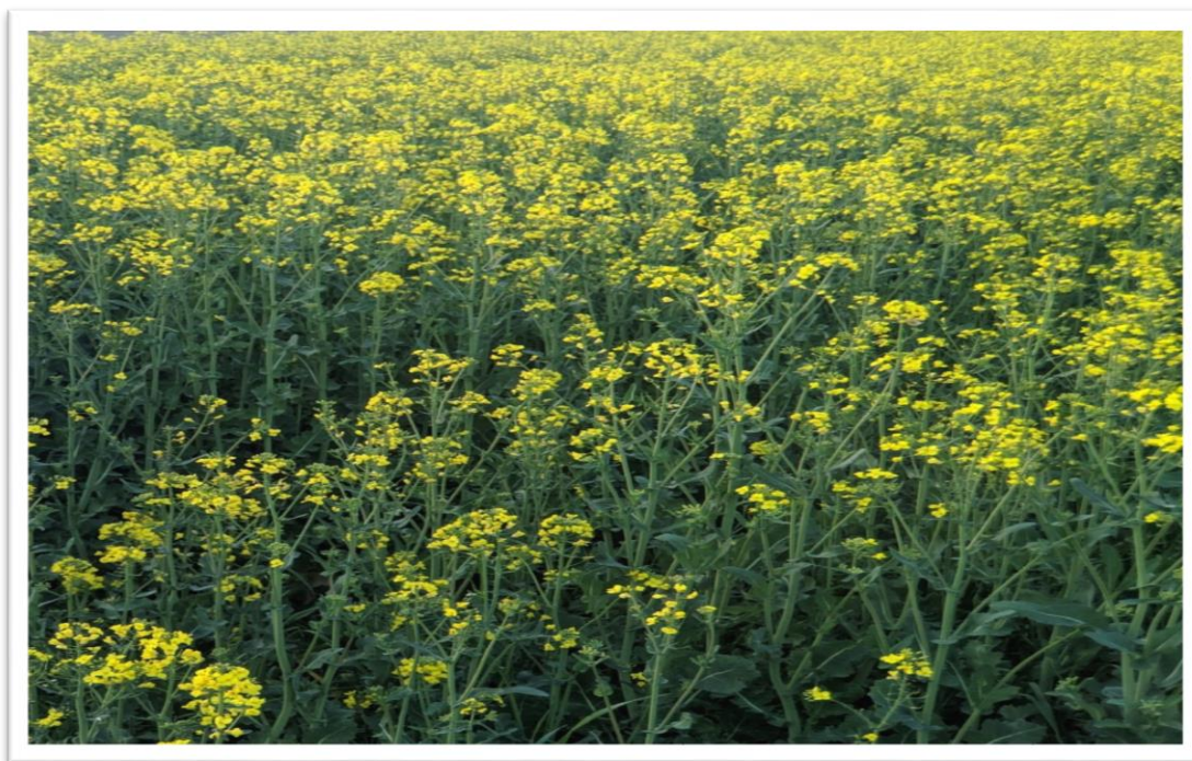
Slika 1. Uljana repica (Dora Radovanić)

Proizvodnja sjemena uljane repice u svijetu iznosi 55,7 milijuna tona. Stvaranje i uvođenje u proizvodnju novih sorata i hibrida uljane repice „00“ kvalitete omogućilo je brzo širenje ove kulture, osobito u Europi gdje je postala najvažnija uljarica (Pospišil, 2013.). Na svjetskom tržištu raste zainteresiranost za proizvodnju uljane repice (Slika 1.), uzgaja se u 30 zemalja, a zbog njenog značaja je među najvažnijim uljanim kulturama u svijetu. Proizvodnja uljane repice konstantno raste jer se osim za dobivanje ulja koristi i za dobivanje biodizela. Najveći proizvođači uljane repice u Europi su Francuska, Poljska, Njemačka i Danska. Njena najveća proizvodnja je započela tek nakon drugog svjetskog rata. Kanada se nalazi među većim svjetskim izvoznicima zrna uljane repice, a Europska unija među uvoznicima.