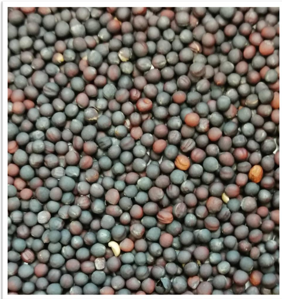
Slika 2. Sjeme uljane repice (Dora Radovanić)

Plod uljane repice je komuška dužine 4 - 11 cm. Na jednoj biljci se može nalaziti 100 – 600 komuški, a u komuški 20 – 40 sjemenki koje su pupčanom vrpcom vezane za središnju lamelu. Njihov broj ovisi o dužini komuške. Broj sjemenki po biljci uz masu 1000 sjemenki predstavlja najvažniju komponentu prinosa. Sjemenka (Slika 2.) je dužine 1,8 - 2,8 mm, sitna i okruglasta, može biti crno–smeđe i plavičasto–crne boje i glatke površine, a koristi se u proizvodnji ulja. Masa 1000 sjemenki varira od 4 – 8 g, hektolitarska masa od 65 do 70 kg. Masa i hektolitarska masa ovise o sorti ili hibridu. Za sjetvu se koriste priznate sorte sa certifikatom iz kontrolirane proizvodnje (Pospišil, 2013.).