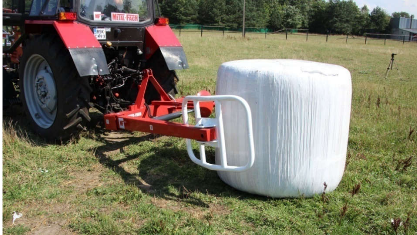
Slika 17. Traktor BELARUS s zadnjim utovarivačem (link 9.)