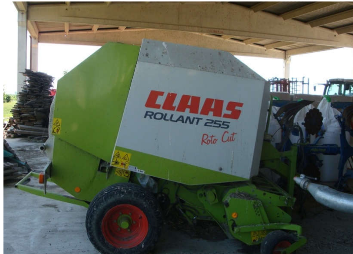
Slika 11. Preša Claas Rollant 255 Roto Cut za valjkaste bale

Osim preše za valjkast bale farma posjeduje i Claas Quadrant prešu za izradu četvrtastih bala dimenzija 120 x 90 cm. Takve preše vrlo kvalitetno prešaju sjenažu ali se u praksi na gospodarstvu ne koriste u tu svrhu jer je takve kvadratne bale vrlo teško omotati u foliju. Stoga se ovaj tip preše koristi konkretno za sijeno i slamu.