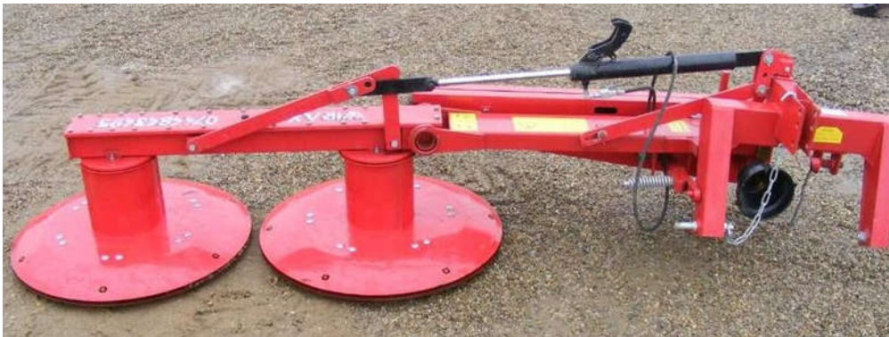
Slika 5. Radni organi rotirajuće travokosilice („SIP")

Podešavanje rotacijske travokosilice s gornjim pogonom se vrši promjenom tanjura koji se nalaze sa donje strane bubnja ispod noževa. Tanjuri su zaobljene izvedbe tako da se visina košnje pomjera više ili niže stavljanjem debljih ili tanjih tanjura.