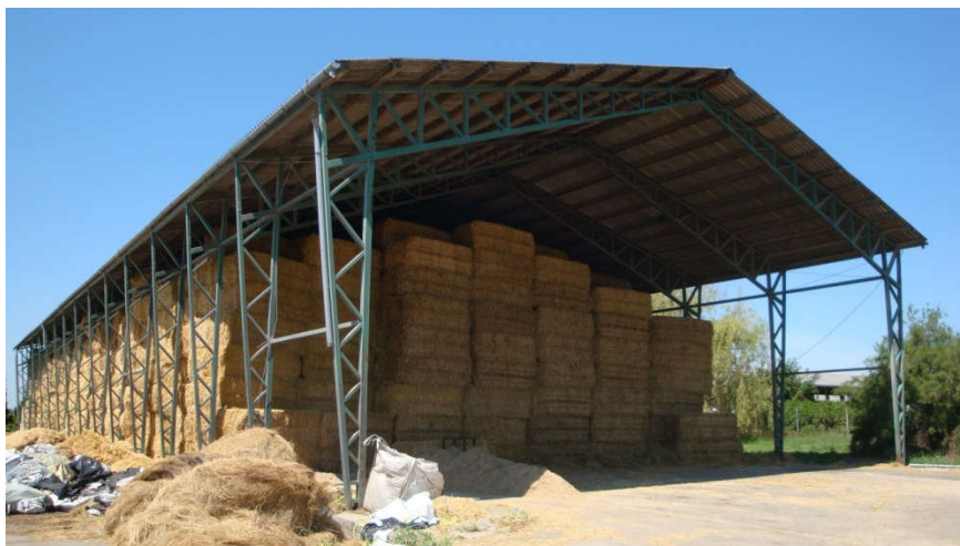
Slika 15. Poluzatvoreni objekat za čuvanje sijena

Farma ne posjeduje silos za sjenažu pa se na gospodarskom dvorištu nalazi točno određeni prostor gdje se odlaže sjenaža koja se nalazi omotana u balama. Bale se stavljaju jedna na drugu kako nebi zauzimale puno prostora. Ovakav tip skladištenja bala nije idealan ali ne dovodi u pitanje kakvoću sjenaže jer stretch folija osigurava sigurnu zaštitu od svih vremenskih uvijeta.