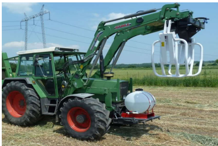
Slika 16 . Traktor FENDT s prednjim utovarivačem (link 8.)

Postupak spremanja sjenaže u omotane bale se preporučuje za manje farme, koje spremaju godišnje do oko 500 bala ili do oko 300 – 500 t sjenaže.