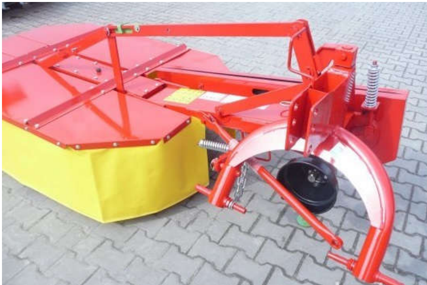
Slika 6. Kosilica-gnječilica „SIP SIL VERCUT DISC 270 S RC“

Gospodarstvo Simental-Comerce posjeduje kosilicu-gnječilicu marke „SIP SILVERCUT DISC 270 S RC“. Takav tip kosilice-gnječilice opremljen je sa rebrastim valjcima sa spiralnim žljebovima po površini. Valjci na sebi imaju gumenu prevlaku da nebi došlo do većih oštećenja prilikom prolaska kamenja ili sličnog kroz njih.