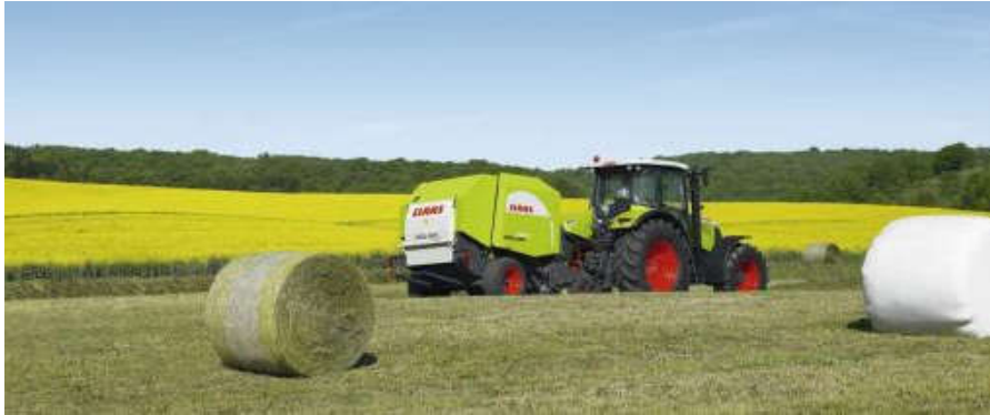
Slika 3. Baliranje sijena za sjenažu (link 2.)

gnječenje što stvara pozitivan učinak na jednoličnost sušenja cijelokupne biljke i otvara mogućnost da se sačuva maksimum hranjivih tvari u biljci. Kao posljednja faza u cijelokupnom procesu je uskladištenje sjenaže koje se izvodi kada vlaga u biljnoj masi padne na zadovoljavajuću razinu te se sjenaža formira u valjkaste bale koje se omotavaju u plastične folije da budu hermetički zatvorene. Tako obavijenepotom se odvoze sa polja i skladište u sjenažne silose do korištenja.