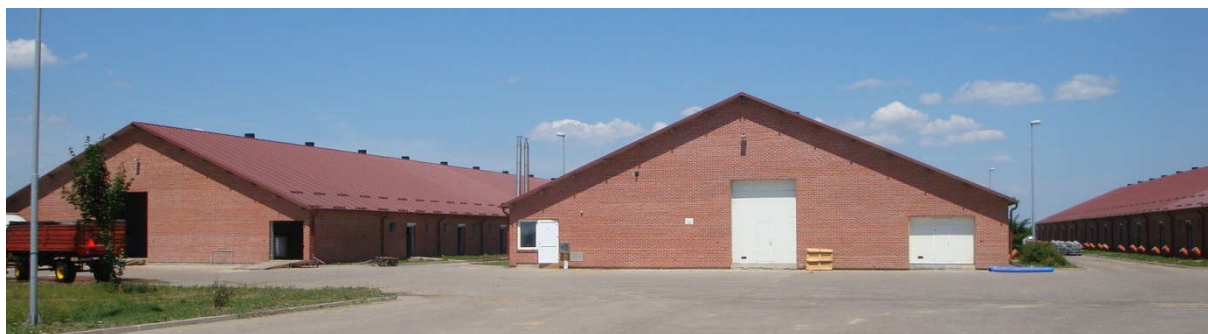
Slika 2. Farma tovne junadi „Simental-Commerce“ D.O.O.