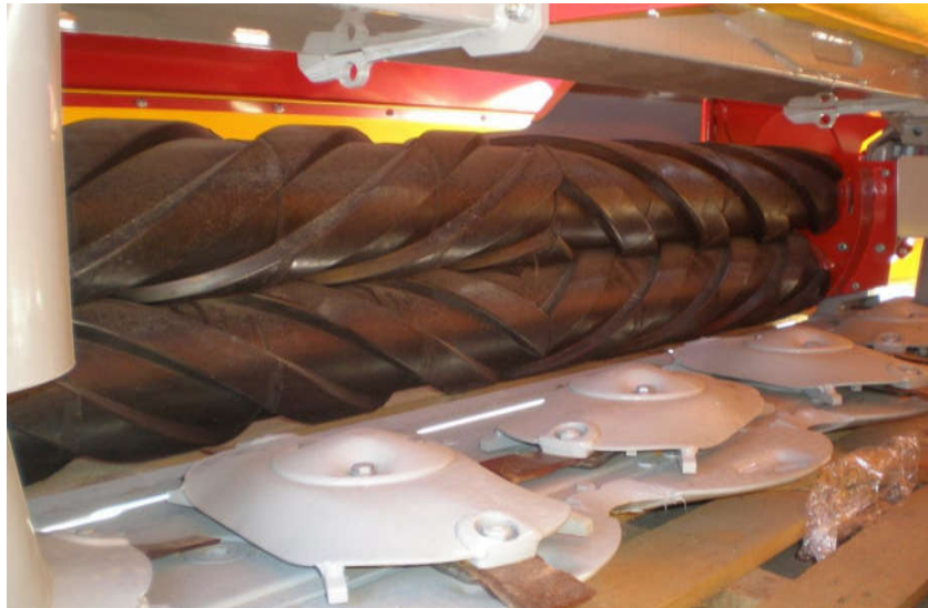
Slika 7. Unutrašnjost kosilice - gnječilice s valjcima „SIP“ (link 4.)