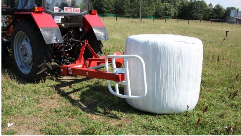
Slika 17. Traktor BELARUS s zadnjim utovarivačem (link 9.)