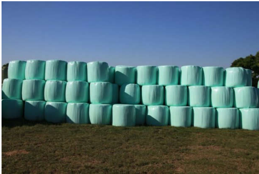
Slika 18. Omotane bale sjenaže u „stretch“ folije

Metoda spremanja krme u ag-bag vreće je također zastupljena na gospodarstvu „Simental-Commerce“, a ta se metoda koristi za spremanje silaže lucerne, ječma, smjese žitarica i grahorica te siliranog kukuruza. AG-BAG (polietilensko crijevo) je promjera 244 cm i duljine 60 m. Za punjenje vreće se koristi AG-BAG preša „G 6000 Europe“ koja se može koristiti za spremanje silaže i sjenaže ali na farmi se prvenstveno koristi za silažu. Radna širina prese je 4,5 m, visine 3 m, te mase 2800 kg. Kapacitet prese je 25-60 t/h.