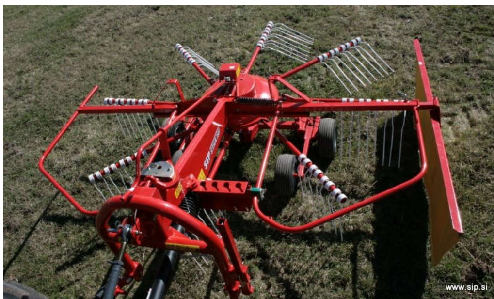
Slika 9. Rotacijske grablje SIP STAR 300/8 ALP (link 5.)

podizü i odbacuju unatrag. Pri sakupljanju se postavljaju sakupljačke zavijese koje usmjeravaju biljnu masu. Brzina rada grablji ove izvedbe iznosi do 15 km/h.