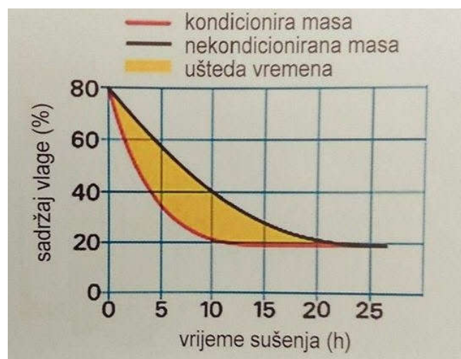
Slika 8. Dijagram procesa sušenja krme u polju djelovanjem gnječilice

Ovakvi tipovi strojeva su obloženi posebnom zaštitom koja čuva valjke gnjetače u slučaju jakih udaraca kada se radi na kamenitim terenima da nebi došlo do izbacivanja opasnih predmeta uslijed velike brzine rotiranja valjaka. Između ostalog na stroju je ugrađen reduktor za 540 \text{ min}^{-1} te klizač za viši otkos (+ 50 mm).