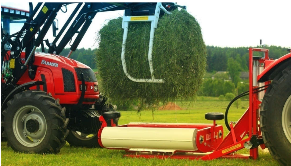
Slika 13. Stavljanje bale sijena na omotač bala (link 6.)

Nakon postupka baliranja dolazimo do omotavanja bala „stech“ folijom. Omotavanje je potrebno izvršiti kvalitetnom stech folijom, kako bi se istiskalo što više zraka, tj. da bala bude hermetički zatvorena za pokretanje anaerobne fermentacije biljne mase. Omatanje bala bi se trebala obavljati odmah nakon prešanja. Stoga gospodarstvo „Simentan-Commerce“ posjeduje omotač bala folijom na koji bala nakon izrade dolazi i omata se „strech“ folijom. Omotač bala posjeduje uređaj za rezanje i hvatanje folije a omotač ima brojač koji prikazuje broj omatanja, vrijeme rada, količinu bala i prosječnu količinu bala na sat.