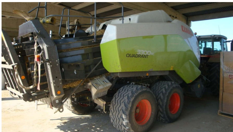
Slika 12. Claas Quadrant 3300 RC za kvadratne bala

Osim preše za valjkast bale farma posjeduje i Claas Quadrant prešu za izradu četvrtastih bala dimenzija 120 x 90 cm. Takve preše vrlo kvalitetno prešaju sjenažu ali se u praksi na gospodarstvu ne koriste u tu svrhu jer je takve kvadratne bale vrlo teško omotati u foliju. Stoga se ovaj tip preše koristi konkretno za sijeno i slamu.