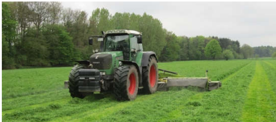
Slika 1. Košnja djeteline za ishranu stoke (link 1.)

Zadatak ovog završnog rada je objasniti tehniku dobivanja, proizvodnje te spremanja sjenaže koja se daljnje koristi kao hrana za junad. U daljnjem tekstu opisuju se strojevi koji se koriste na farmi „Simental-Commerce” kako bi se dobila što bolja stočna hrana za ishanu tovne junadi te objasniti koji su osnovni postupci u spremanju sijena i sjenaže na koje trebamo obratiti pozornost kako bismo ostvarili gore navedene ciljeve.