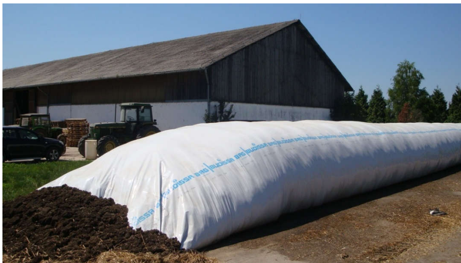
Slika 19. AG-BAG vreća za silažu