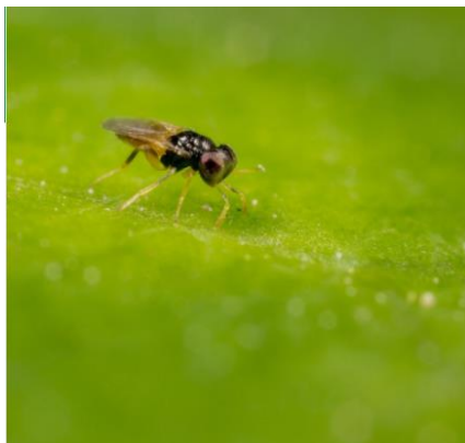
Slika 6: Aphelinus abdominalis