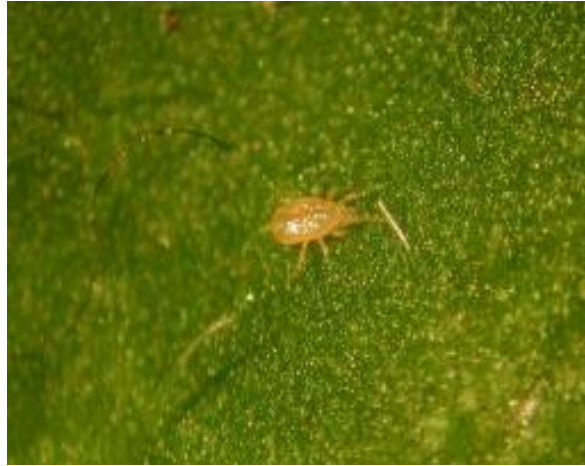
Slika 3: Predatorska grinja

no jednom kada se tripsi potpuno istrijebe sa područja gdje je predator unesen Cucumeris se počinje hraniti sa polenom i paukovim grinjama. Vrlo je mobilna i na dan pojede 2 do 3 tripsa, a isto toliko izlegne i jaja. Životni ciklus ne traje duže od 3 do 4 tjedna ( https://www.biobestgroup.com/ ).