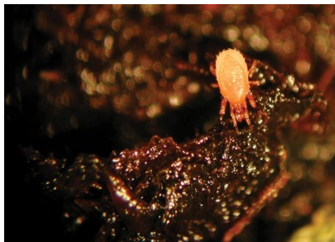
Slika 4: grinja S.Scimitus