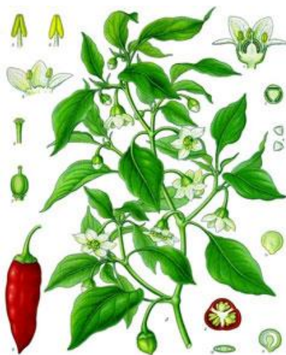
Slika 1: Morfološki prikaz Capsicum annuum