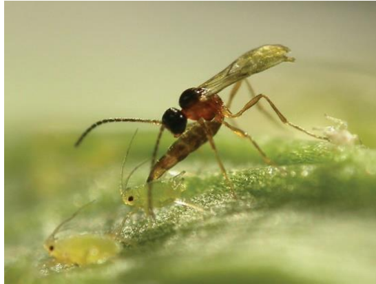
Slika 5: Aphidius matricariae

što je parazitirala, polaze uš na list, fiksira ju i mumificira. Za razliku od ostalih Aphidius vrsta matricariae najbrže parazitira i u većem broju. U svom procesu parazitiranja ženka leže oko stotine jaja i može napasti više od 300 lisnih uši. Žive 2-3 tjedna. Imaju odlične sposobnosti za pronalaženje kolonija uši ( https://www.biobestgroup.com ).