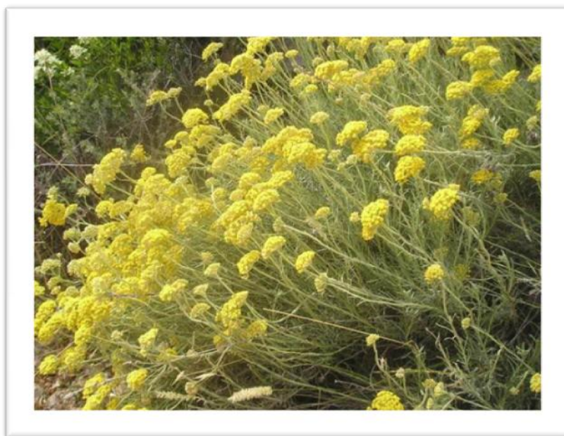
Slika 8. Helichrysum arenarium (L.) Moench- Smilje

Smilje je trajna zeljasta biljka sivkaste boje, obrasla vunanim dlakama (Slika 8.). Naraste do 60 cm visine. Stabljika je uspravna, ne razgranjena, i na njoj su na izmjenice raspoređeni listići čvrste kutikule, koji su s lica zeleni, a s naličja sivo zeleni, prekriveni sitnim dlačicama. Donji listići pri osnovi su skupljeni u rozetu.