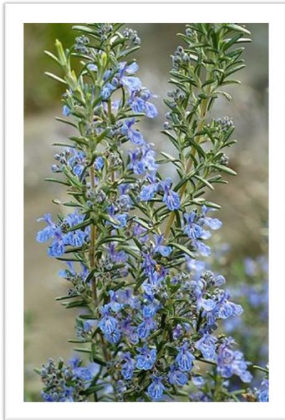
Slika 4. Prikaz cvjetova ružmarina

Ružmarin je vazdazelena grmolika biljka koja može narasti od 1 do 3 metra u visinu. Na odrvenjeloj stabljici se nalaze nasuprotno raspoređeni linearni listovi. Oni su sjedeći, čvrsti, kožasti podvinuta i cjelovita ruba, te prekriveni žljezdastim dlakama. (Slika 4). Cvjetovi se nalaze na maloj peteljci i smješteni su pršljenasto između ogranaka. Sitni su i ljubičastoplave boje. Cvatnja je od ožujka do svibnja, a ponekad i drugi puta u rujnu.