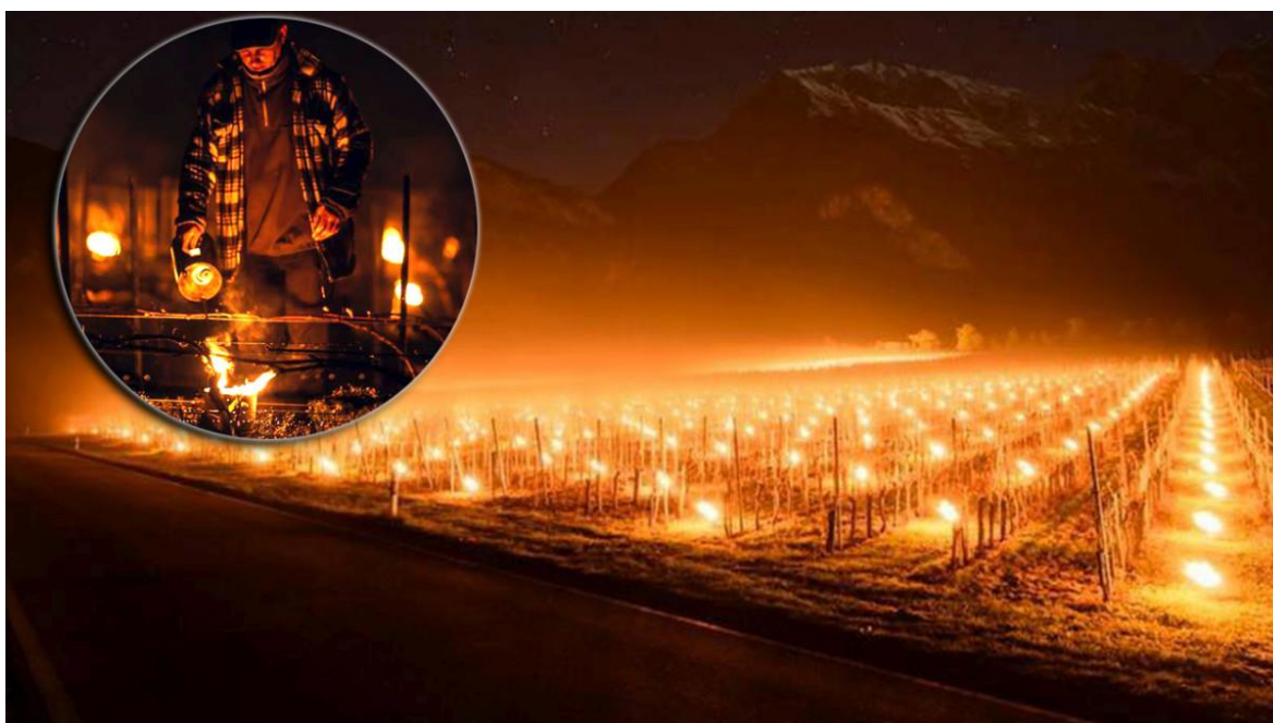
Slika 8. Paljenje StopGEL svijeća