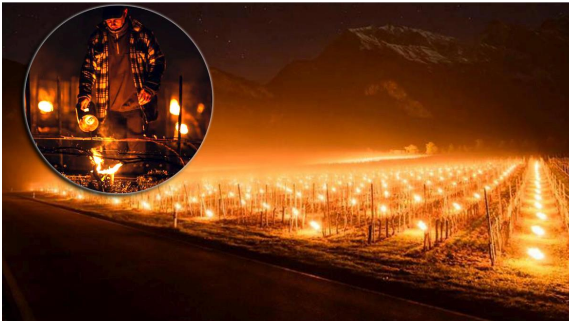
Slika 8. Paljenje StopGEL svijeća