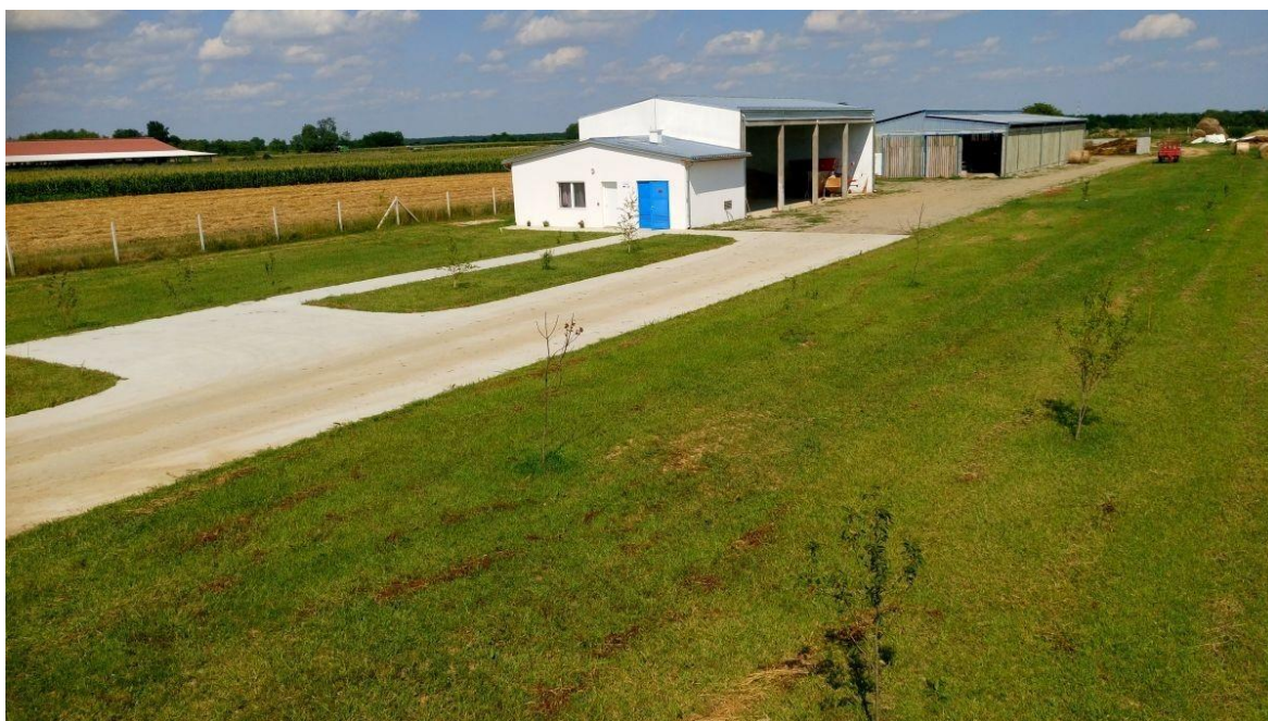
Slika 1. Farma Franković

Obiteljsko poljoprivredno gospodarstvo bavi se tovom junadi već 4 godine. Farma se nalazi na relaciji Gorjani- Đakovačka Satnica i udaljena je 500-tinjak metara od Gorjana. Osim tovom junadi, OPG se bavi i ratarstvom. Obraduje 80 hektara privatne i državne zemlje uz vlastitu mehanizaciju koju je kompletirao tijekom godina, te sam proizvodi svu hranu potrebnu za tov junadi. Na OPG-u nema radnika već cijela obitelj sudjeluje u poslu. Trenutno se na farmi nalaze 93 junice.