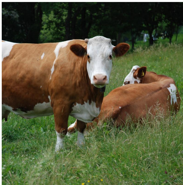
Slika 4. Simentalsko govedo

Tjelesna masa krava je od 600 do 750 kg, a visina grebena 135 do 140 cm. Boja dlake je svjetlo žuta do crvena s bijelim mrljama, te bijele glave i repa. Prosječna proizvodnja mlijeka je 5 028 kg mlijeka sa 4,05% mliječne masti i 3,32% proteina. Tovne sposobnosti simentalaca su visoke, tako dnevni prirast u tovu mlade junadi do 450 kg iznosi 1,2 do 1,3 kg, randman mesa je između 60 i 62%, kasniji je početak zamašćivanja trupova, vrlo dobra kakvoća mesa i mramoriranost (Agroklub).