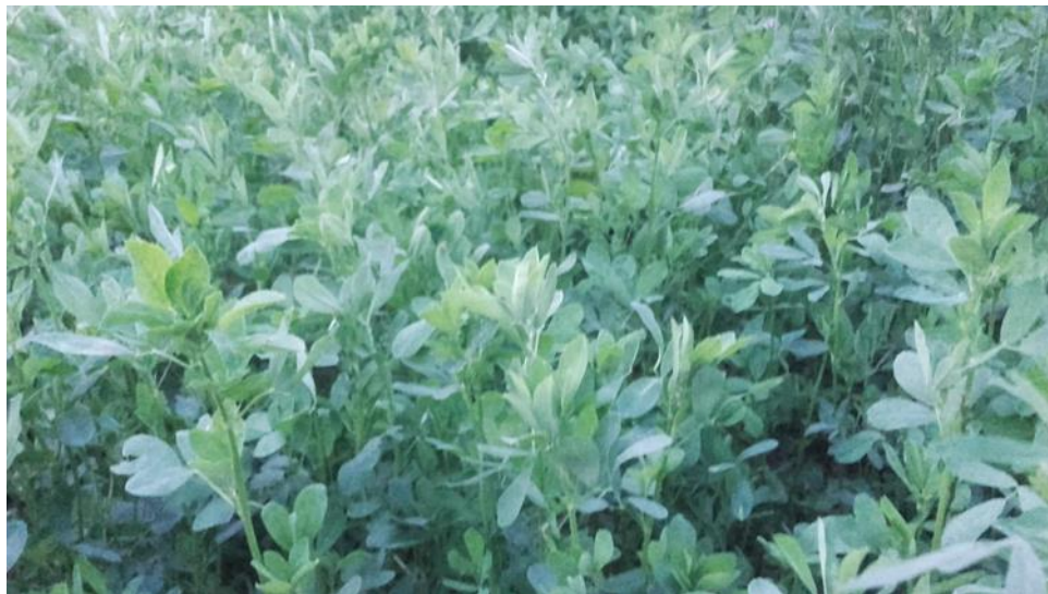
Slika 11. Lucerna