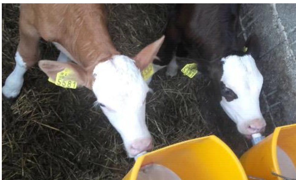
Slika 18. Napajanje teladi zamjenskim mlijekom-zamjenicom

Na gospodarstvu se hranjenje goveda obavlja dva puta na dan, jednom ujutro te jednom navečer. Smjesa se pripravlja od samljevenih žitarica, odnosno kukuruza, ječma i tritikala te se u nju dodaje silaža. Smjesa se miješa u mikserici kako bi sve bilo ravnomjerno izmiješano. Nakon toga, goveda dobiva čisto sijeno, a voda im je dostupna u svako doba dana kroz automatske pojilice. Količina hrane ovisi o dobi goveda. Ukoliko se kupe vrlo mala telad, jedno određeno vrijeme se hrani zamjenskim mlijekom, zamjenicom Milsan koju nabavljaju u poljoprivrednim trgovinama. Teladi se zamjenica sa vremenom smanjuje te se telad uči na konzumaciju voluminozne i koncentrirane krme.