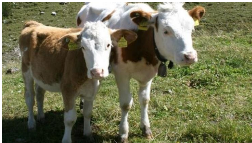
Slika 23. Bolest zglobova kod teladi